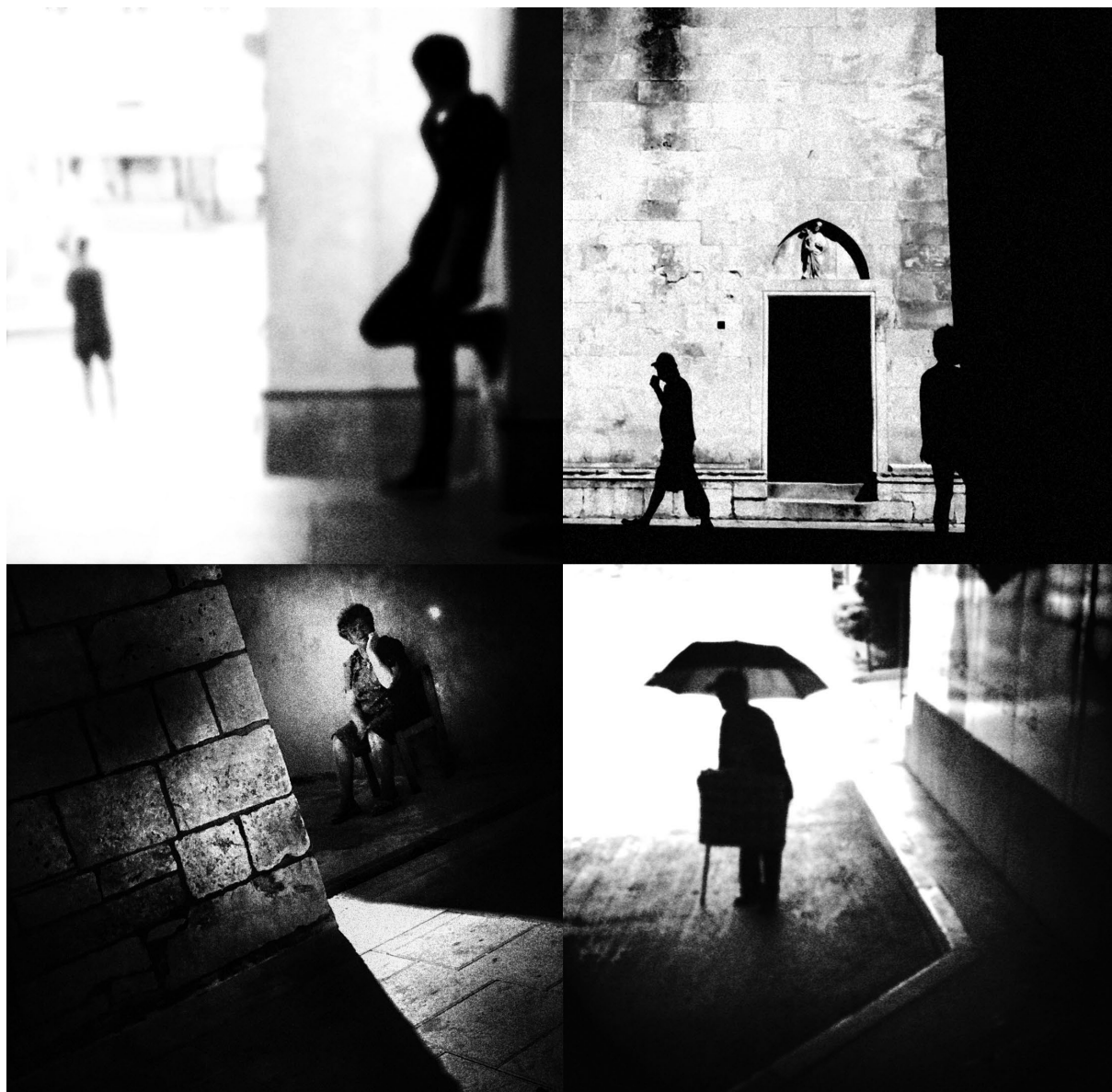
Vela Luka - Korčula - Zagreb, 2011.

Fotografski naginjem popodnevnom ljetnom svjetlu i njegovim karakterističnim zasićenim bojama te oštrim i dubokim sjenama... Volim spontanu portretnu i uličnu fotografiju, veliko je zadovoljstvo uhvatiti ključni tipični izraz ili trenutak.