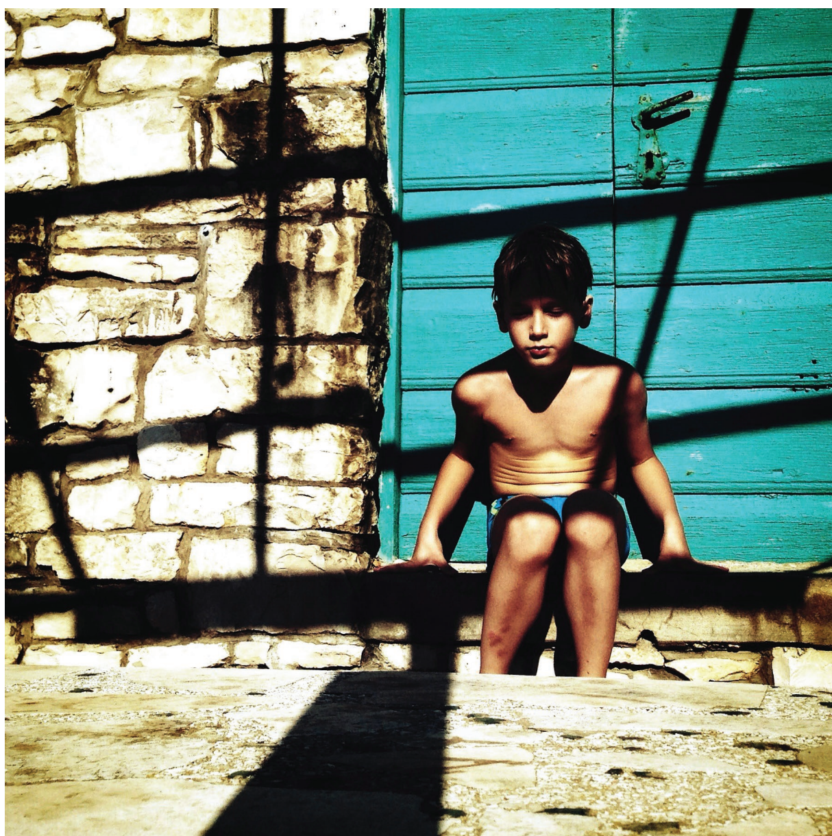
Vela Luka, 2015.