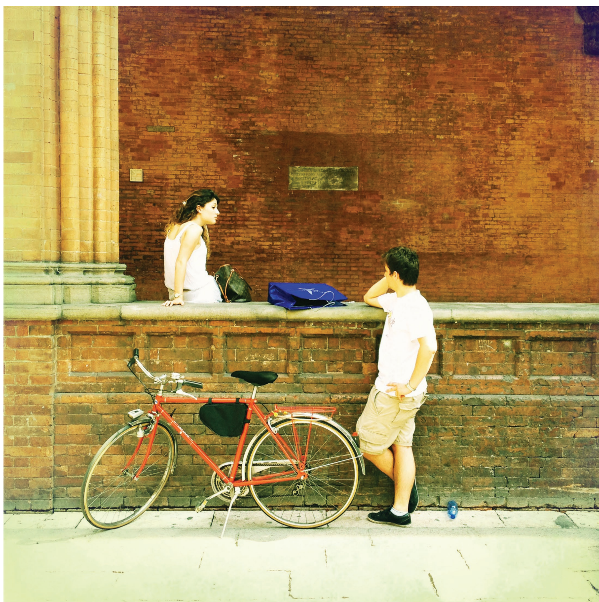
Romeo i Julija, 2012.