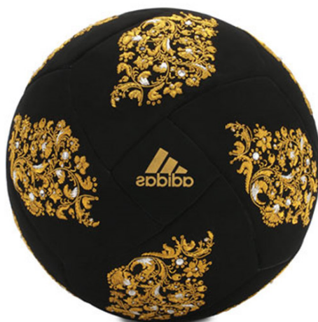
Slika 3. Adidas – Swarovski FIFA WC lopta