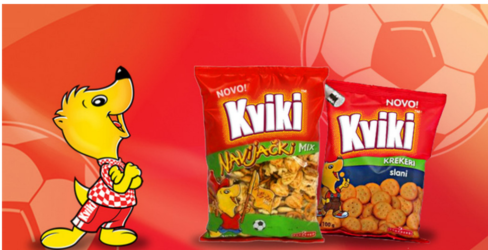
Slika 2. Podravka Kviki „navijački“ krekeri