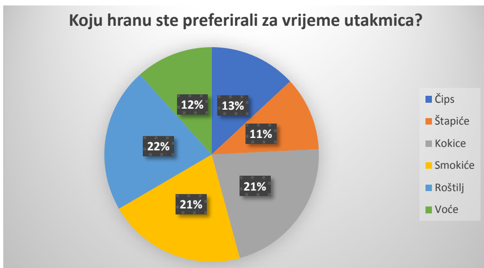
Grafikon 2. Preferirana hrana za vrijeme utakmica

Prema dobivenim rezultatima ankete po 41% ispitanika je gledalo utakmice kod kuće ili u kafiću. 2% ispitanika je utakmice gledalo uživo na stadionima u Rusiji, dok je 16% ispitanika gledalo na trgovima diljem Hrvatske.