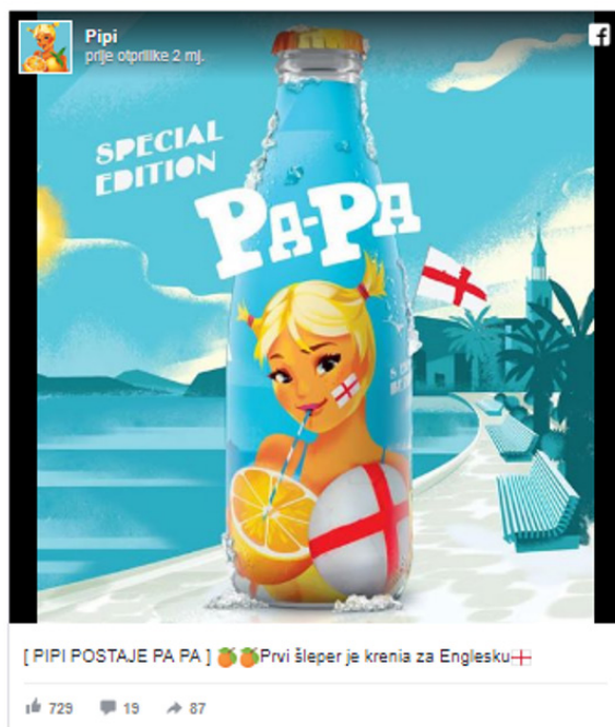
Slika 7. Posebna verzija napitka Pi-pi