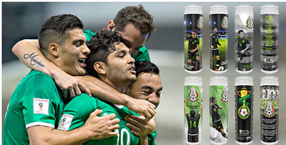
Slika 5. Navijački svijećnjaci Nogometne reprezentacije Meksika