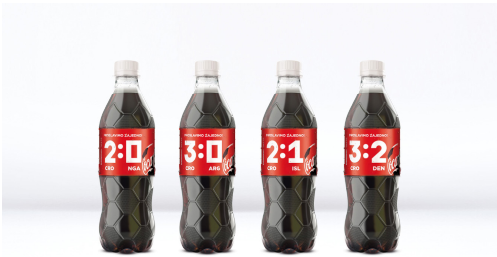
Slika 6. Coca Cola boce s rezultatima Hrvatske reprezentacije na Svjetskom prvenstvu