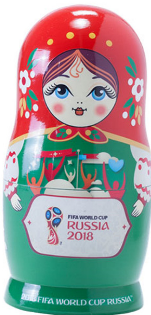
Slika 4. Babuška s temom Svjetskog nogometnog prvenstva