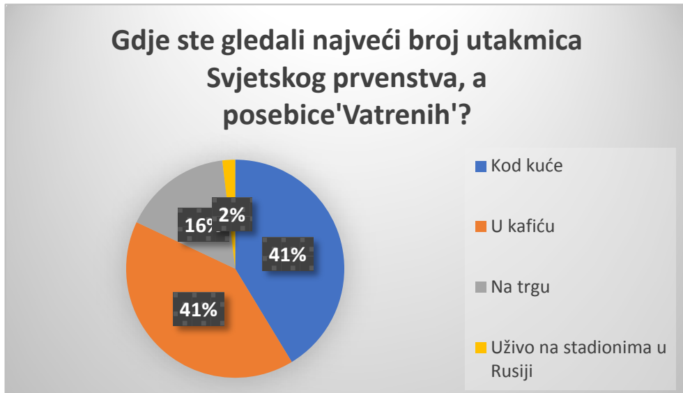
Grafikon 1. Lokacija gledanja utakmica