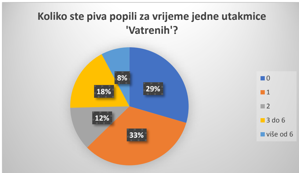
Grafikon 4. Broj konzumiranih piva za vrijeme utakmica Hrvatske nogometne reprezentacije