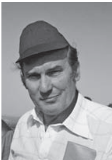
Slika 4. Profesor Krajinina 1976. godine Figure 4. Professor Krajinina in 1976