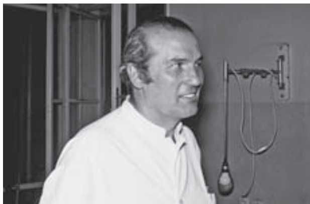
Slika 2. Profesor Krajina u pedesetim godinama Figure 2. Professor Krajina in his fifties

Težačko dinarsko podrijetlo prof. Krajine odražavalo se ne samo stasitim i snažnim fizičkim habitusom nego i tipičnim psihičkim karakteristikama kao što su oštro rasuđivanje, snalažljivost, dinamičnost, izdržljivost i iskrenost gotovo do grubosti, ali s razboritim taktičkim ograničenjem: nikada povišen glas. Bio je vrlo racionalan, sistematičan i