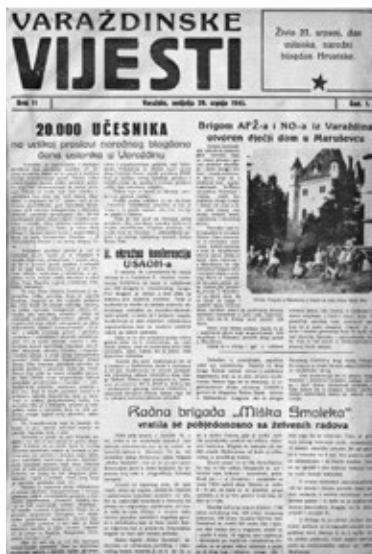
Slika 3: Naslovna stranica Varaždinskih vijesti s prvom fotografijom