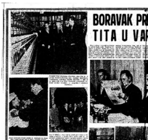
Slika 4: Prilikom posjeta Varaždinu, drug Tito pročitao je i Varaždinske vijesti

Upravo polovicom 1960-ih u Jugoslavenskom institutu za novinarstvo provedena je analiza lokalnog tiska koja je ukazivala na glavne osobine lokalnog tiska kao takvog. Primjerice, utvrđeno je da lokani listovi većinom izlaze na 8-10 stranica, cijena je varirala od najniže 20 dinara naviše, a u najvećem broju slučajeva iznosila je 40 dinara. Različita je bila i tiraža takvih listova. U najvećem broju slučajeva kretala se između 2.000 i 5.000, ili 5.000 i 10.000 primjeraka, pri čemu su najveću nakladu imali listovi koji su izlazili u Sloveniji. Utvrđeno je također da naklade listova nisu značajno porasle