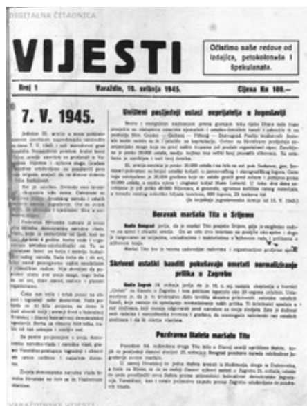
Slika 1: Naslovna stranica prvog broja Vijesti , od 19. svibnja 1945.

Sa sedmim brojem konačno dolazi do promjene naziva iz Vijesti u Varaždinske vijesti pod kojim novine izlaze i danas. I dalje su postojale rubrike kao što su sindikalne vijesti, zadrugarstvo, gospodarstvo, a vijesti su obuhvaćale i događanja u Sutinskim Toplicama i Budinščini, što je zna-