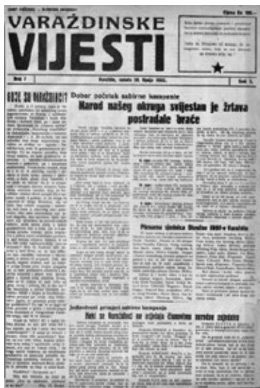
Slika 2: Naslovna stranica novina preimenovanog imena u Varaždinske vijesti