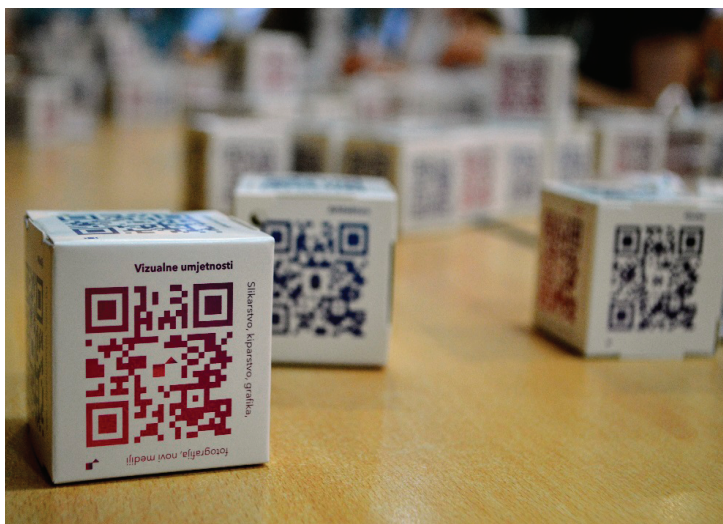
Slika 3. QR kod sektora Vizualne umjetnosti

Napomena: Pametnim telefonom skenirajte sliku 2