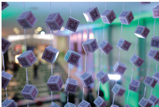
Slika 2. Prostorna instalacija - QR kockice i sektori kreativne industrije