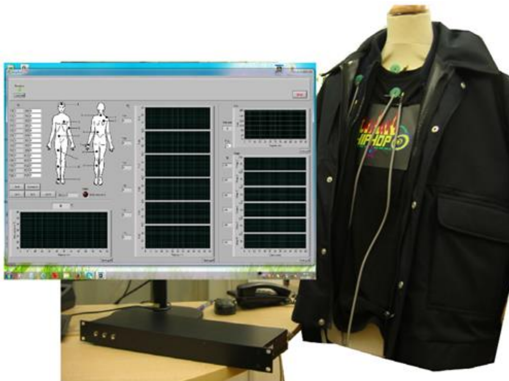
Sl. 2. Centralna jedinica mjernog sustava, izgled zaslona monitora i način postavljanja mjernih sondi

Na sl. 2. je prikazana centralna jedinica sustava (niska crna kutija) na koju priključen spomenuti multiplekser sa sondama i osobno računalo za prihvatanje, pohranjivanje, izračun, analizu i prikaz rezultata mjerenja te za tisak protokola o mjerenju. Na sl. 2. je također prikazan i izgled zaslona monitora s mnogobrojnim prozorima za komunikaciju s mjernim sustavom i za ispis mjernih rezultata i iscrtavanje dijagrama mjerenja. Također je prikazan i odjevni predmet sa sondama za mjerenja parametara okoliša, u slojevima odjeće i u mikroklimi odjavnog predmeta.