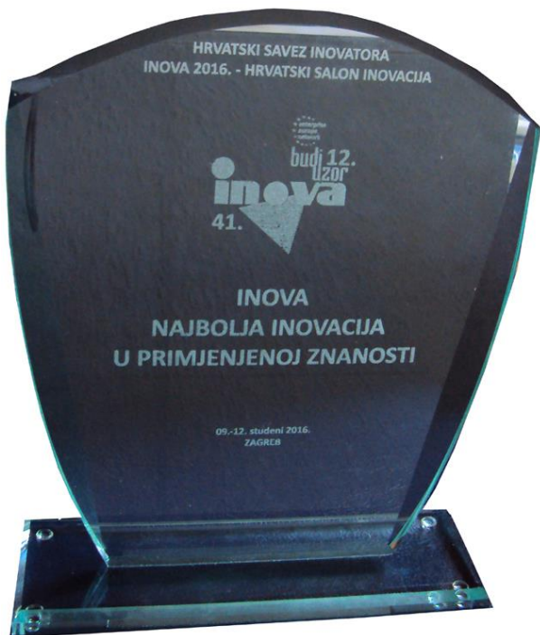
Sl. 1 Nagrada za najbolju inovaciju u primijenjenoj znanosti, INOVA 2016