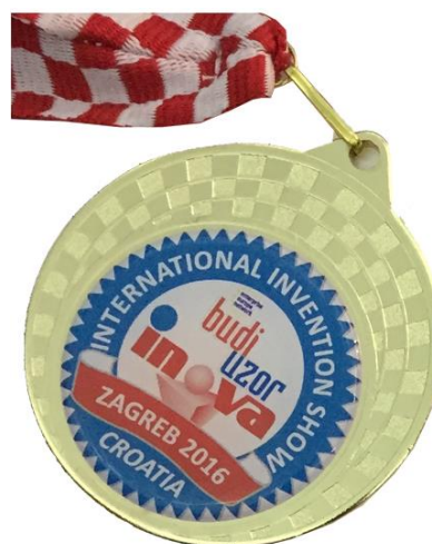
Sl. 2 Zlatna medalja, INOVA 2016