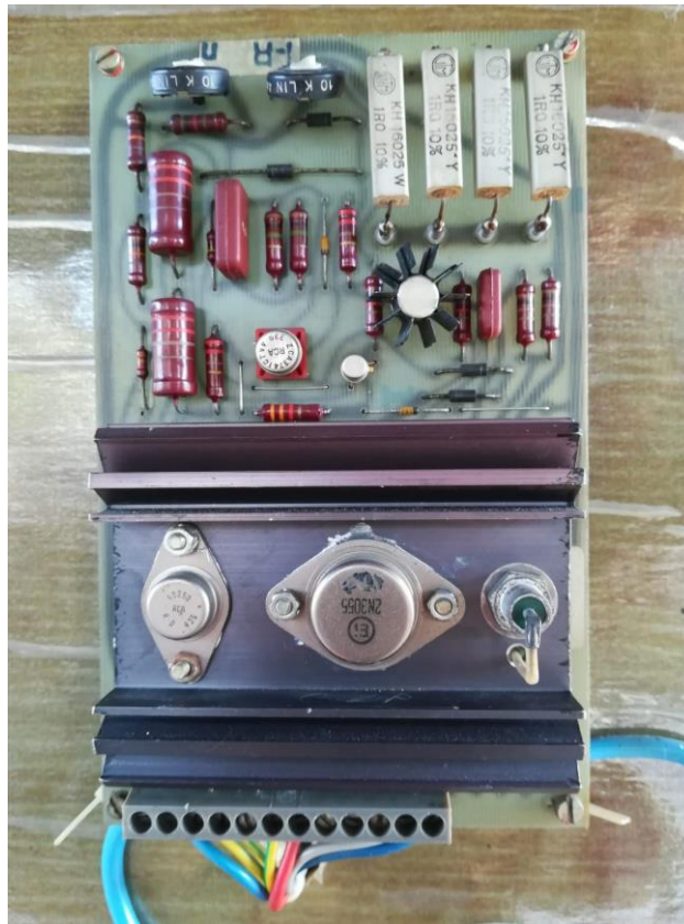
Sl. 1. Realizirana pločica regulacije namatanja spirale patent zatvarača

također inovacija Induktivni pretvornik pomaka za regulaciju napetosti niti, opisana u narednom poglavlju. Izlazna naprava je bio 24 V kolektorski istosmjerni motor koji je pokretao bubanj za namatanje. Da se spriječi negativan efekt iskrenja na kolektoru rotora elektromotora dodana je snažna dioda, smještena na aluminijskom hladilu, dolje desno na sl. 1., koja je kratko spajala inducirane naponske vrhove.