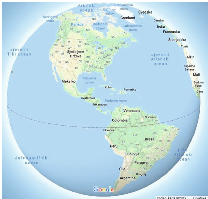
Slika 2. Karta najsitnijeg mjerila u Google Mapsu . Fig. 2 Map at the smallest scale in Google Maps .

in the middle and at the bottom, it can be concluded the projection is a normal aspect cylindrical projection – by our estimate it is the Web Mercator projection. We applied this procedure to determine the scales to which the Web Mercator projection was applied in producing maps. If the longitude on the Northern hemisphere at middle latitudes at the edge of the screen increases from the bottom to the top, the conclusion is the normal aspect conical projection was applied.