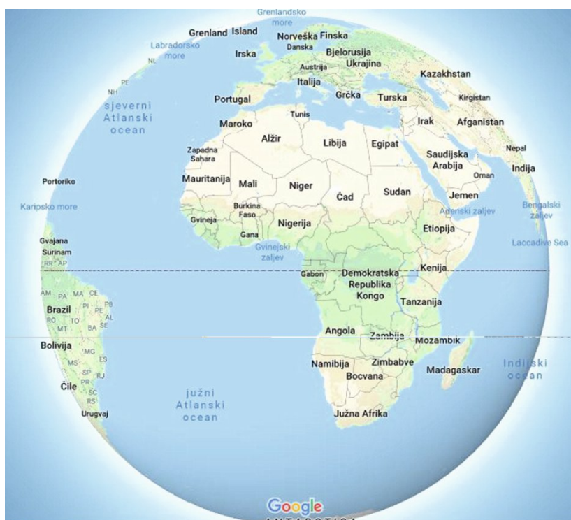
Fig. 3 Google Maps in transverse external perspective azimuthal projection.

Na području približno omeđenom paralelama s geografskim širinama \varphi = 10^\circ i \varphi = 30^\circ ustanovili smo da su karte svih mjerila do mjerila 1:2 500 000 (5. razina), na području omeđenom paralelama \varphi = 30^\circ i \varphi = 60^\circ sve do mjerila 1:1 250 000 (6. razina), na području omeđenom paralelama \varphi = 60^\circ i \varphi = 70^\circ sve do mjerila 1:625 000 (7. razina), a na području omeđenom paralelama \varphi = 70^\circ i \varphi = 80^\circ sve do mjerila 1:312 000 (8. razina) izrađene u web-Mercatorovoj projekciji. Sve karte sitnijih mjerila do mjerila 1:5 000 000 (4. razina) izrađene su u konusnoj projekciji. To bi prema preporukama Ginzburga i Salmanove (1957) trebala biti konformna konusna projekcija jer i na karti mjerila 1:5 000 000 pružanje u smjeru sjever-jug nije veće od 7^\circ ili oko 760 km. Četiri karte najsitnijih mjerila (1:80 000 000, 1:40 000 000, 1:20 000 000 i 1:10 000 000) u azimutnoj su projekciji. Prema preporukama kartografa za karte polusfera najprikladnija je ekvivalentna azimutna