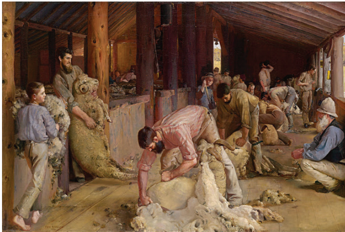
Tom Roberts, Shearing the Rams , 1890

Australci su, kao saveznici Britanaca, sudjelovali u ratovima na Novom Zelandu (1863.-1865.) i u Sudanu (1885.), ali su to činili kao stanovnici Viktorije, Južne Australije, itd., a ne kao Australci. Prvi put su kao zajednica nastupili u Burskom ratu (1899.-1902.). Sudjelovanje u ratovima omogućilo je Australcima da vide sebe i svoju državu kao jasno izdvojen entitet u sastavu Carstva. Uključivanje u Prvi svjetski rat na strani Britanije bilo je popraćeno golemim javnim odobravanjem i dobrovoljnim prijavljivanjem u vojsku. Bitka na Galipolju (1915.) osobito je pridonijela osjećaju nacionalnog jedinstva, jer su Australci smatrali da su ih otad svjetske sile počele prihvaćati kao sebi jednake. Novinar Keith Murdoch postao je nacionalna legenda kad je u pismu premijeru Andrewu Fisheru kontrastirao fizički nadmoćne Australce i Britance, koje je izjednačio sa slabijom djecom. Svojom je korespondencijom ojačao osjećaj nacionalnog ponosa Australije 6 (West, Murphy, 2010: 104-108).