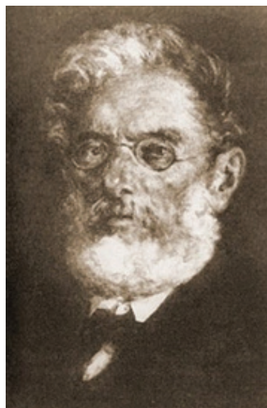
Carlo de Franceschi

Kako je već navedeno, počeci istarskog iredentizma sežu i prije 1848. godine. Prema Boži Milanoviću taj je pokret temeljen u početku više na osjećajima, nego na djelovanju. Bio je više pjesnički, a manje politički i ostao je ograničen na nekoliko pojedinaca ( Milanović, 1967 : 145). Talijanski su nacionalisti zauzimali stajalište da je Istra zapadno od Učke talijanska zemlja i da se hrvatsko-slovenska većina u njoj mora potalijančiti. Ne čudi stoga takvo mišljenje istarskih nacionalista jer je već 1854. godine glavni stožer sardinskog kralja Karla Alberta tvrdio da strateške granice nove Italije moraju biti na Bitoraju i sezati od Ljubljane te da moraju obuhvatiti Istru, Bakar, Kraljevicu, Krk, Idriju i Logatec. U prvoj polovici 19. stoljeća posebno su bili aktivni odvjetnik iz Kopra Antonio Madonizza, Michelle Fachinetti te povjesničar i sudac Carlo de Franceschi, a kasnije su im se pridružili labinski gradonačelnik Tomaso Luciani te koparski profesor i odvjetnik Carlo Combi.