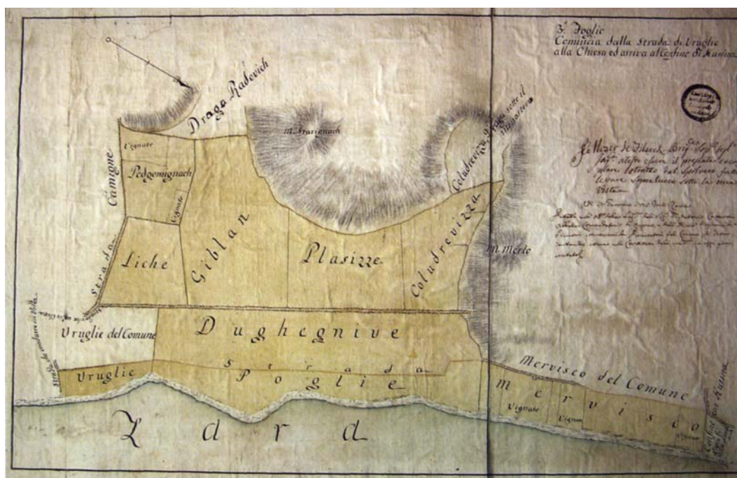
Third part of the map of Rogovska opatija property in littoral Tkonosko, 1778.

Treći dio karte posjeda rogovske opatije u tkonskom priobalju, 1778.