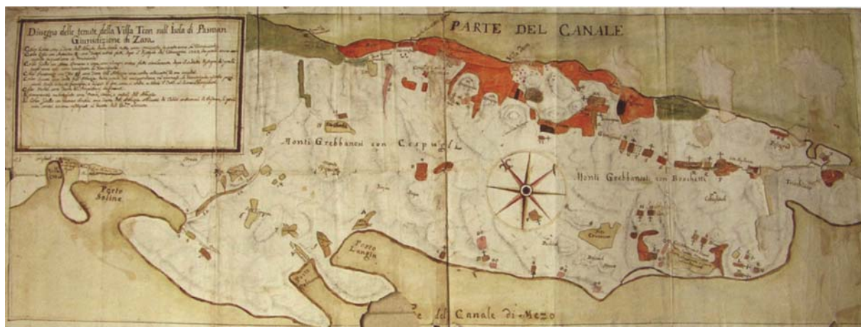
Southwest part of the island of Pašman on the map Disegno delle tenute della Villa Tcon... , approximately 1723.

Jugozapadni dio otoka Pašmana na karti Disegno delle tenute della Villa Tcon... , cca 1723.