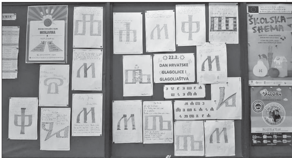
2. slika: Dan hrvatske glagoljice i glagoljaštva u Osnovnoj školi Mate Lovraka Kutina

U osnovnim školama diljem Hrvatske organizirane su kreativne radionice s glagoljičnom tematikom, na kojima su se učenici upoznavali s glagoljicom dok su izrađivali uporabne i ukrasne predmete i ukrašavali ih glagoljičnim slovima, igrali obrazovne igre ili učili pisati svoja imena na glagoljici.