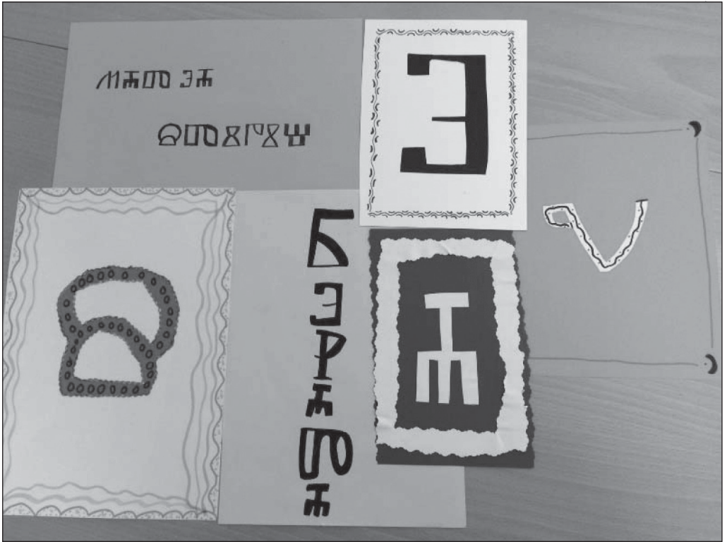
4. slika: Radovi s likovne radionice na hrvatskoj nastavi u Švicarskoj Izvor: mrežne stranice hrvatske nastave u Švicarskoj

Novi Vinodolski u suradnji sa školskom knjižnicom organizirala je izlet na Krk i posjet crkvi sv. Lucije u Jurandvoru, u kojoj su učenici među ostalim vidjeli i repliku Bašćanske ploče na mjestu na kojemu se ona izvorno nalazila. Obilježavanje Dana hrvatske glagoljice i glagoljaštva proširilo se i izvan granica Republike Hrvatske te su se tom prigodom glagoljičnom tematikom bavili i polaznici hrvatske nastave u kantonima Aargau i Bern u Švicarskoj. Mlađi su se polaznici upoznali s osnovnim obilježjima toga starog hrvatskog pisma te su se okušali u slikanju glagoljičnih slova, a stariji su glagoljičnu tematiku povezali s poviješću hrvatskoga jezika i suvremenim pitanjima poput njegova statusa u Europskoj uniji.