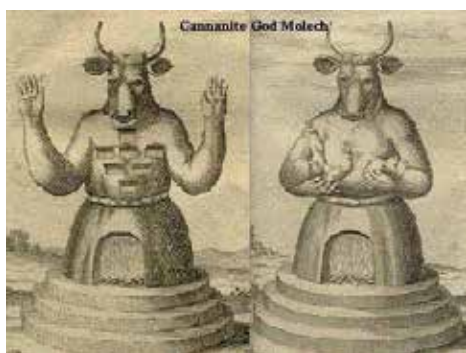
Slika 7. Kanaanski bog Molek i žrtva - dijete