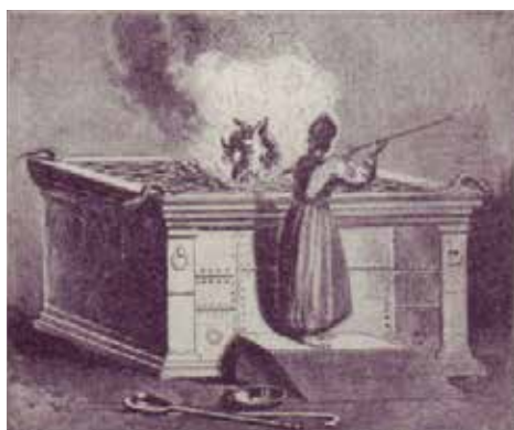
Slika 6. Žrtvenik za paljenice