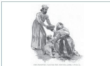
Slika 5. Klanje žrtvenog janjeta

je osoba koja bi dovela životinju položila svoje ruke na nju, na glavu životinje, u znak zamjenskog, zastupničkog žrtvovanja. Tada bi životinju zaklali. Slijedi škropljenje oltara krvlju žrtve. Na kraju se životinja spaljuje cijela ili se određeni pečeni dijelovi blaguju (Schultz, 1970.) (Slike 3-6).