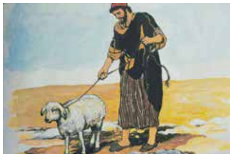
Slika 3. Dovođenje životinje za žrtvu

Osim dosad navedenih posebnosti životinjskih žrtava evo i nekoliko osnovnih, odnosno općih pravila žrtvovanja , vidljivih pri svakoj pojedinoj žrtvi. Prvo se životinju prikazalo pri oltaru. Zatim