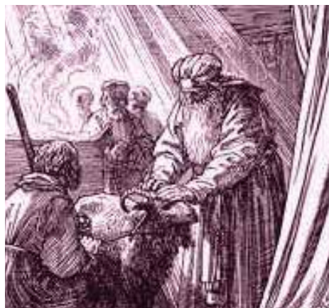
Slika 4. Polaganje ruku na žrtvenu životinju