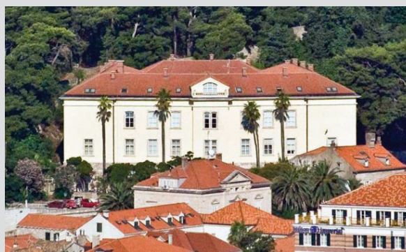
Slika 2 – Međunarodni sveučilišni centar (IUC) u Dubrovniku – mjesto održavanja Skupa