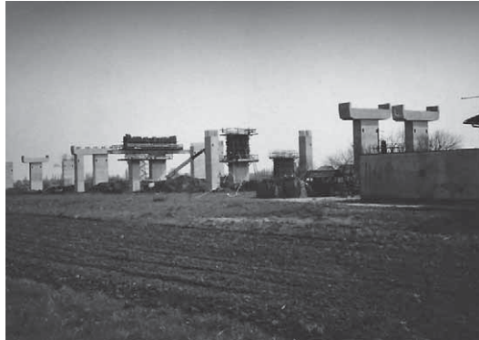
Slika 8: Izgradnja vijadukta "Drežnik" kod Karlovca