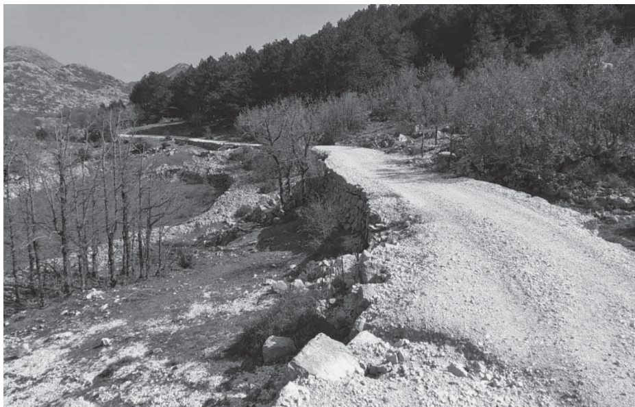
Slika 4: Rodičeva cesta u parku prirode Biokovo (iznad Makarske)