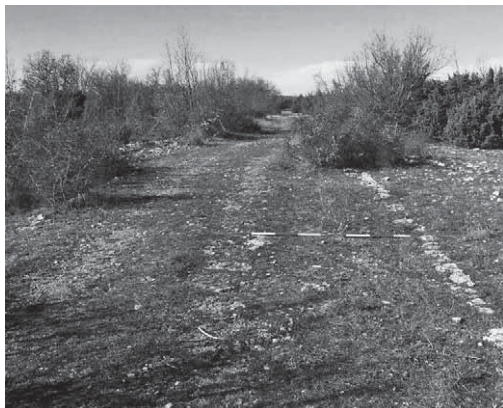
Slika 2: Ostaci rimske ceste u Dalmaciji (tada provincija Dalmatia) kod Knina

Izvor: http://tris.com.hr/2014/04/novootkrivena-najduza-rimska-cesta-u-hrvatskoj-ugrozena-vjetroelektranama/