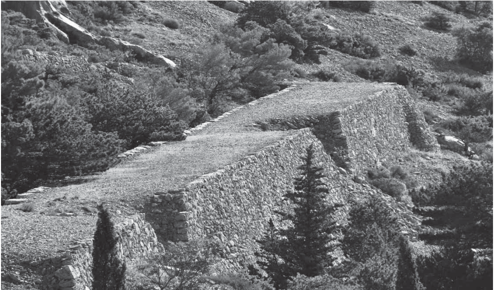
Slika 7: Ostaci Francuske ceste na planini Biokovu