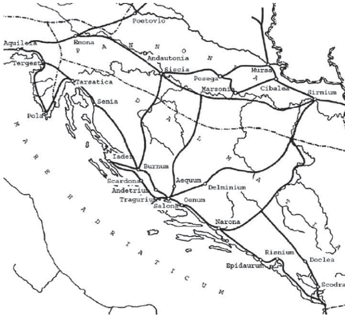
Slika 1: Mreža glavnih cesta u rimskim provincijama "Dalmatia" i "Panonia"