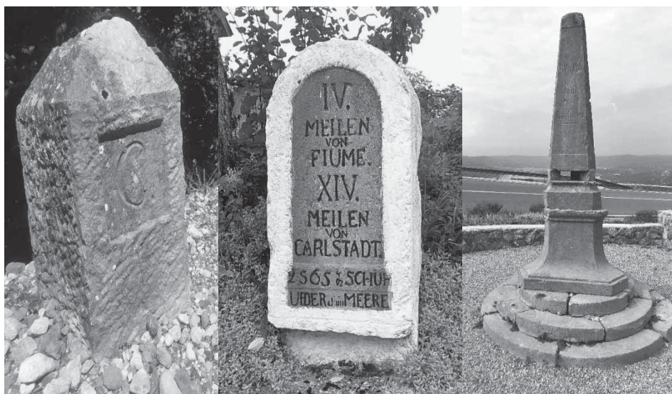
Slika 5: Kameni miljkazi za označavanje udaljenosti tijekom 18. i 19. stoljeća

* lijevi na Majstorskoj cesti između Svetog Roka i Obrovca, srednji i desni na Lujzijanskoj cesti između Karlovca i Rijeke