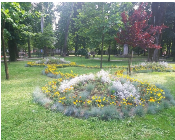
Slika 7. Pogled – 1. na Gradski park (Foto: E. Delić, 2018).

Figure 7. View – 1 at City park (Photo: E. Delić, 2018).