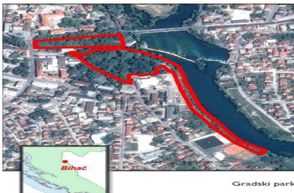
Slika 2. Satelitski snimak Gradskog parka u Bihaću (označeno crvenim) (Natura Jadera, 2014, prema Delić et al., 2018).

Figure 1. Satellite image of the town of Bihać (Google Earth).