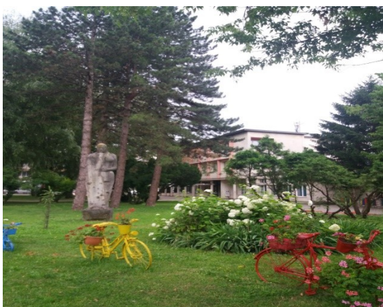
Slika 3. Jedna gradska zelena površina u Bihaću (Foto: B. Dorbić, 2018).

Figure 3. One green urban area in Bihać (Photo: B. Dorbić, 2018).