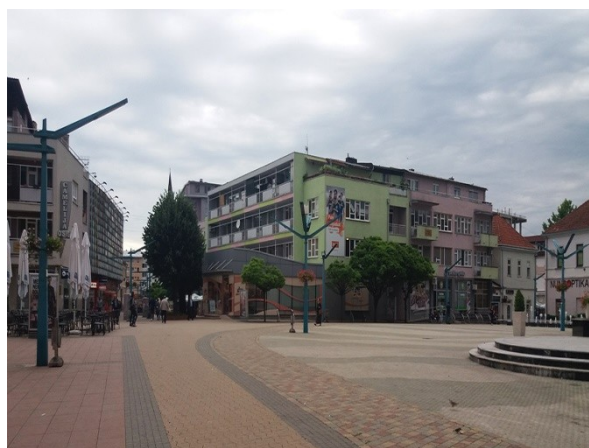
Slika 4. Zelenilo u centralnom dijelu Bihaća.

Figure 3. One green urban area in Bihać.