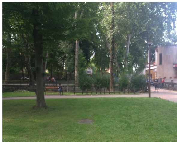
Slika 8. Pogled – 2. na Gradski park (Foto: E. Delić, 2018).

Figure 7. View – 1 at City park (Photo: E. Delić, 2018).