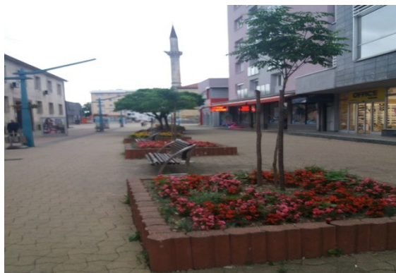
Slika 5. Cvjetne gredice u centru Bihaća – Situacija – 1.