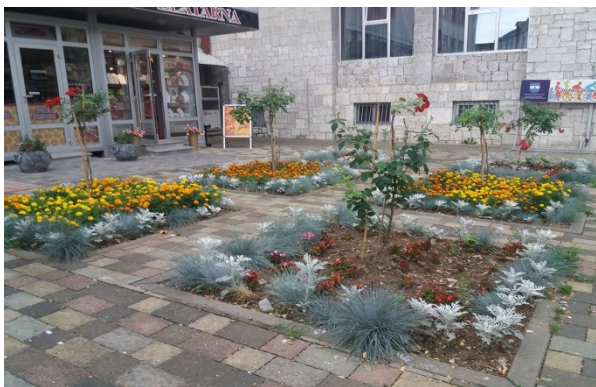
Slika 6. Cvjetne gredice u centru Bihaća – Situacija – 2 (Photo: B. Dorbić, 2018).