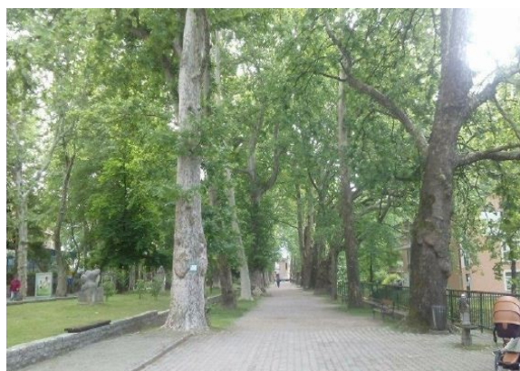
Slika 10. Aleja platana u Gradskom parku (Foto: A. Poprženović, 2018).

Figure 9. Paving paths in the City Park (Photo: B. Dorbić, 2018).