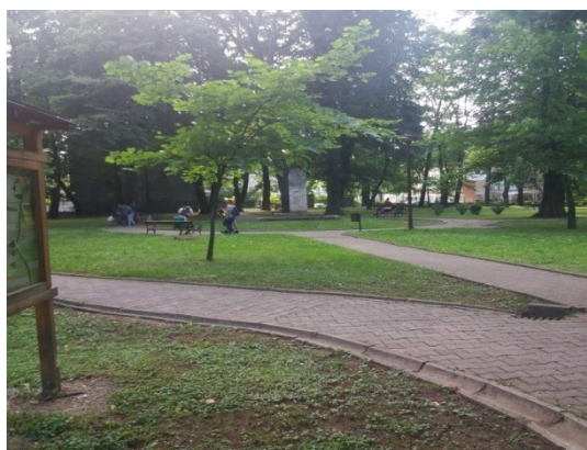
Slika 9. Popločane staze u Gradskom parku.

U ovom objektu gradskog zelenila problematični su dijelovi prema prometnicama (sjeverni dio) gdje su vidljiva oštećenja od automobilskih guma (dijelovi nagaženih travnjaka, uništeni pokoji tlo pokrivači te oštećeni betonski rubnjaci. Bolja prometna regulacija i postavljanje dodatnih prometnih barijera umanjili bi ovaj problem (Slika 10.).