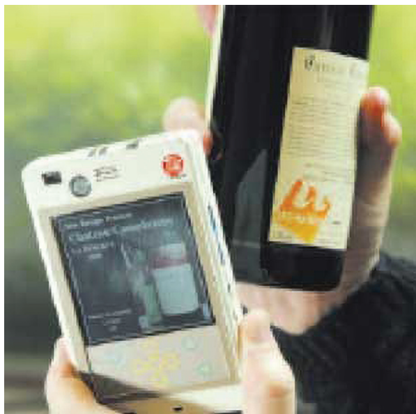
Slika 6 Sustav za očitavanje RFID tagova

Transponderi se dijele na: -aktivne i -pasivne. Aktivni transponderi rade na baterije, odašilju signal čitaču i mogu raditi na udaljenosti od oko 50 m. Pasivni transponderi rade na manjoj udaljenosti (do 5 m), ali rade na osnovu energije koju šalje čitač čime im omogućava neograničen vijek trajanja [12,13].