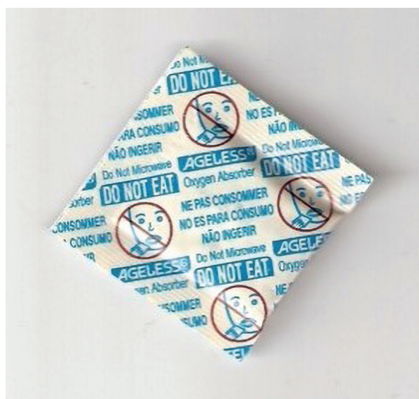
Slika 1 Željezni prah - "hvatač" kisika

Povećana koncentracija kisika unutar pakiranja dovodi do oksidacije pa time i kvarenja namirnice, stoga su razvijeni načini da se smanji koncentracija kisika. Jedan od temeljnih načina je da se koristi sakupljač (apsorber) kisika na bazi željeznog praha. Željezni prah se koristi na način da se stavi u propusne paketiće koji se implementiraju unutar ambalaže pa kako željezo hrđa tj. oksidira, na taj način veže na sebe kisik i smanjuje njegovu koncentraciju unutar samog pakiranja. Postoje i razni moderni postupci koji se temelje na ugradnji aktivnih barijera u ambalažni materijal. Te ugrađene barijere bi prema potrebi propuštale više ili manje kisika ovisno o kakvoj se namirnici radi [2].