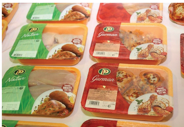
Slika 8 Pakiranje mesa u modificiranoj atmosferi