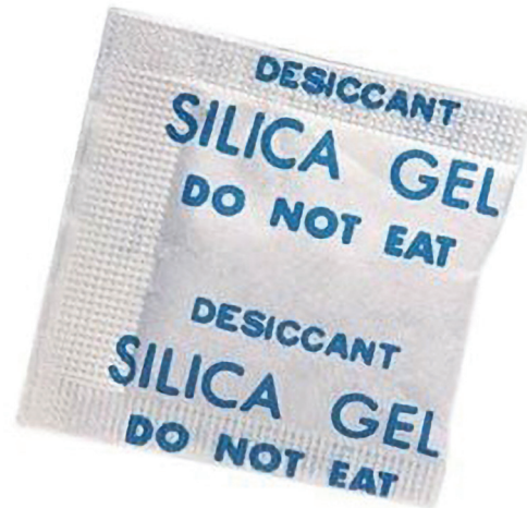
Slika 3 Vrećica sa apsorberima vlage –silikagel

Povećana koncentracija vlage u samom pakiranju može dovesti do stvaranja različitih mikroorganizama te time i do smanjenja roka trajnosti namirnice. Kako bi se to izbjeglo koriste se različiti desikanti (sredstva za isušivanje) koja na sebe vežu čestice vode [2]. Ona se koriste tako da se stavljaju u prozirne paketiće ili se ugrade u sam materijal ambalaže. Osim kod pakiranja prehrambenih proizvoda desikanti se koriste i kod pakiranja farmaceutskih proizvoda te za pakiranje osjetljivih elektroničkih dijelova. Osim desikanata koriste se i plastične presvlake protiv zamagljivanja koji dozvoljavaju neki stupanj transpiracije proizvoda pa se dio vlage na taj način izbacuje van [2].