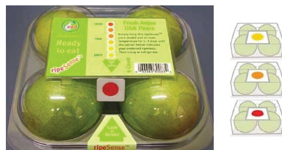
Slika 4 Pokazatelji svježine

Postoje brojni metaboliti koji bi mogli poslužiti kao markeri u razvoju indikatora svježine proizvoda. Neki od primjera su sljedeći: - U mesnim proizvodima se tijekom skladištenja mogu pratiti promjene u koncentraciji organskih kiselina kao što su n-butiratna, L-laktatna, D-laktatna i octena kiselina. Pokazatelji takvih promjena uobičajeno su različiti pH indikatori. - Etanol, zajedno s mliječnom i octenom kiselinom, važan je pokazatelj fermentativnog metabolizma bakterija mliječne kiseline. Istraživanja su pokazala da vrijeme skladištenja marinirane pileline utječe na povećanje koncentracije etanola u anaerobnom pakiranju s modificiranom atmosferom. U ovom slučaju indikatori koji mogu detektirati etanol su korisni u praćenju kvalitete ovih proizvoda. Još jedan pokazatelj kvarenja namirnice je i ugljikov dioksid koji se javlja kao popratna pojava mikrobiološkog rasta. Izuzetak su pakiranja mesnih proizvoda u modificiranoj atmosferi, gdje je teže pratiti takve promjene jer je koncentracija ugljikovog dioksida dosta visoka [8,9].