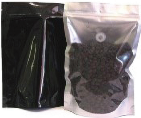
Slika 2 Prikaz pakiranja s ventilom koji sprječava ulaz kisika, a omogućuje izlaz CO 2

Problemi sa koncentracijom ugljičnog dioksida (CO 2 ) su posebno izraženi kod namirnica kao što su mljevena kava i razni sirevi. Kod povećane koncentracije ugljičnog dioksida dolazi do promjene kemijskog sastava, a samim time dolazi i do promjene organoleptičkih svojstava tih namirnica. Kako bi se smanjila koncentracija CO 2 većinom se koriste jednosmjerni ventili koji su ugrađeni u ambalažu koji dopuštaju izlaz plinova ali ne dopuštaju ulazak [1,2].