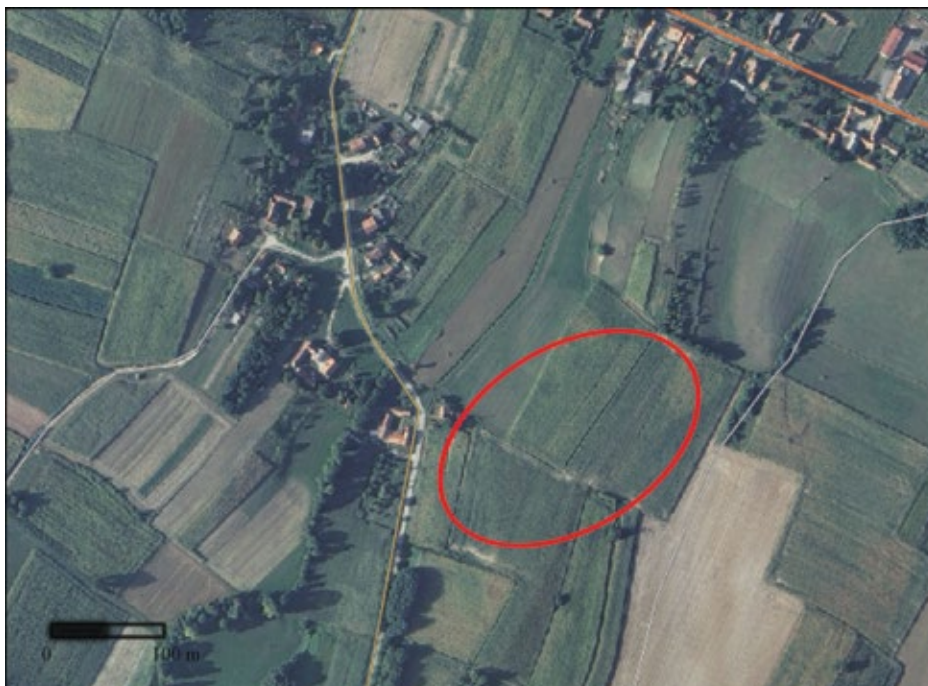
Karta 2: Položaj i areal rasprostiranja arheološkog lokaliteta Vlajslav - Brzava (podloga: geoportal.dgu.hr, izradio: I. Valent)

Keramički materijal prikupljen na lokalitetu može se većinom datirati u kasni neolitik ili eneolitik. Od 69 ulomaka iz tog vremena, njih 32 su sivo smeđe boje stjenki i presjeka, a 37 ulomka je narančasto oker boje. Najveći broj ulomaka pripada dijelovima tijela posuda, no prisutan je i ulomak niske noge, ulomci ručki, bukli i jedan blago izvučeni rub. Znatno manje ulomaka keramike (8) uglavnom sive boje stjenki i presjeka, može se datirati u mlađe željezno doba. Dalje, 2 ulomka ruba i 1 ulomak tijela ukrašen valovnicom izrazito su grafitirani. Preostali dio pronađene keramike po svojim karakteristikama može se datirati u novi vijek. Ta keramika je uglavnom narančaste boje, a pojedini ulomci su zeleno ili bijelo glazirani. Pored keramike pronađena su i 23 komada lijepa te 1 ulomak glačanog kamena.