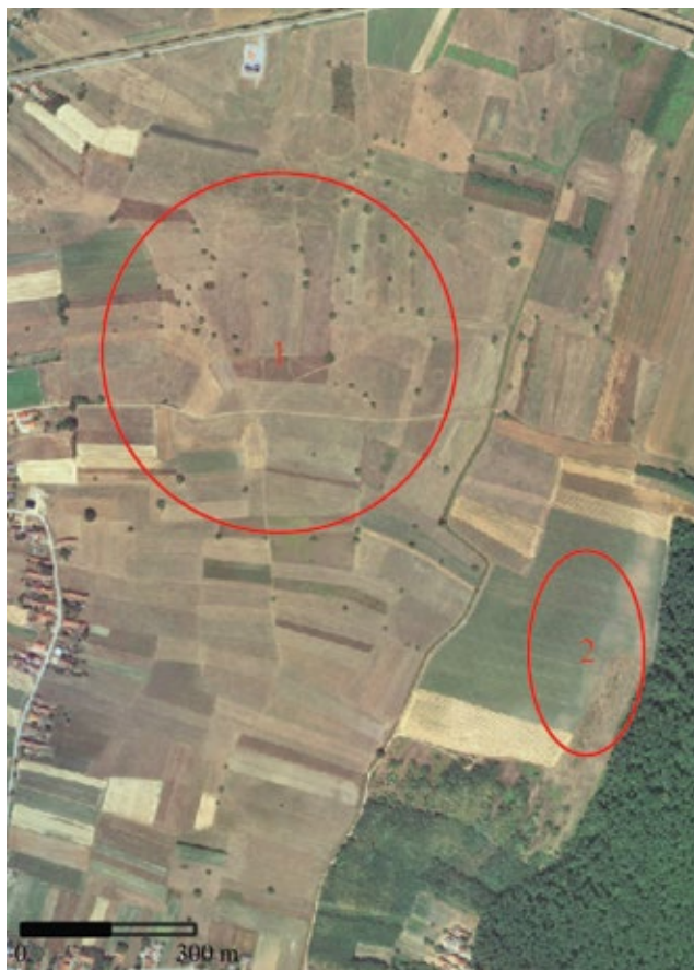
Karta 3: Položaji i areal rasprostriranja arheoloških lokaliteta Kalinovac - Vuglenice I. (1) i Kalinovac - Vuglenice II. (2) (podloga: geoportal.dgu.hr, izradio: I. Valent)

Nešto južnije od samog uzvišenja pronađena su i 4 ulomka keramike od pročišćene gline s primjesom pijeska. Stjenke i presjek su sive boje. Ovi ulomci se mogu