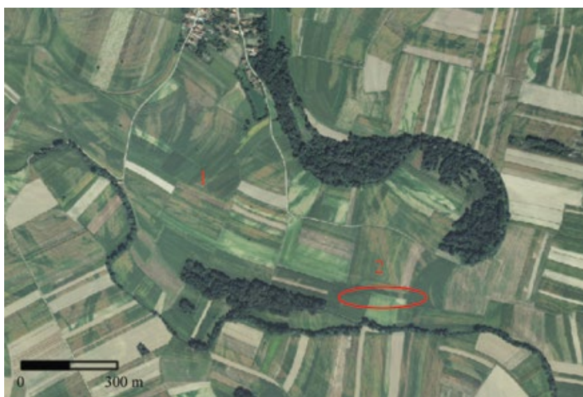
Karta 4: Prostor rasprostranjenosti nalaza recentne keramike na prostoru južno od Velikog Otoka (1) i areala arheološkog lokaliteta Veliki Otok - Rudina Jokna (2) (podloga: geoportal.dgu.hr, izradio: I. Valent)

Toponim Rudina Jokna smješten je južno od mjesta Veliki Otok i proteže se u smjeru zapad-istok prema Malom Otoku. Obuhvaća veliku površinu nizinskog prostora koji se danas velikom većinom nalazi pod poljoprivrednom obradom. Prilikom terenskih pregleda ustanovljeno je nekoliko položaja s nalazima keramike, no uglavnom se radi o malom broju ulomaka novovjekovne keramike koja je na ovaj položaj mogla dospjeti sekundarno, poljoprivrednom obradom (Karta 4:1). Nešto više keramike, koja nam sugerira postojanje arheološkog lokaliteta, pronađeno je na položaju jugoistočno od mjesta Veliki Otok, udaljenom od njega približno 1000 m zračne linije (Karta 4:2). Podjednako je udaljen i od Malog Otoka, koji se nalazi prema istoku. Južno od lokaliteta nalazi se potok prema kojem teren blago pada i od kojeg je lokalitet udaljen oko 100 m. Ovdje je prikupljena keramika koja se uglavnom može datirati u rani srednji vijek. Skupljeno je 19 sitnih ulomaka. Keramika je izrađena od gline s primjesom pijeska i sitnih kamenčića. Uglavnom je sive i smeđe boje. Pored ulomka tijela posuda pronađen je i 1 ulomak dna. Osim navedenih ranosrednjovjekovnih ulomaka prikupljeno je i 6 ulomaka koji pripadaju razvijenom / kasnom srednjem vijeku te 7 njih koje se može opredijeliti u novi vijek.