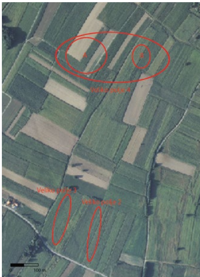
Karta 10: Položaji i areal rasprostiranja arheoloških lokaliteta Glogovac - Veliko polje 2, 3, 4 (podloga: geoportal.dgu.hr, izradio: I. Valent)

Većoj skupini materijala prikupljenog s ovog položaja pripadaju ulomci keramike izrađeni rukom čije su stjenke narančaste, tamno sive, svijetlo ili tamno smeđe boje, dok su u presjeku narančasti ili tamno sivi. Zastupljeni su komadi grublje i finije fature. Ulomci finije fature izrađeni su od pročišćene gline pomiješane s malo pijeska, dok grublji ulomci u sebi sadrže sitne kamenčiće, a pojedini i razmrvljene komadiće keramike. Većina komada pripada dijelovima trbuha posude, prikupljeno je nekoliko ulomaka dna, 1 ručkica šalice (?) te 4 komada oboda. Prva 3 oboda pripadaju posudama, imaju jednostavno izvijen obod te blago sužen i zaobljen rub, a četvrti ulomak pripada vjerojatno zdjeli, rub mu je blago zaobljen, a na obodu, koji je sužen u odnosu na trbuh nalazi se trokutasto rebro. Ukrašavanje je prisutno samo na 1 ulomku trbuha, u obliku niskih bradavičastih ispupčenja. Materijal se može datirati u brončano doba (vjerojatno srednje brončano doba).