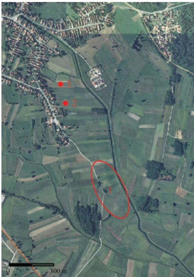
Karta 6: Položaji i areal rasprostiranja arheoloških lokaliteta Đurđevac - Kopčice I., II., III. (1-3) (podloga: geoportal.dgu.hr, izradio: I. Valent)