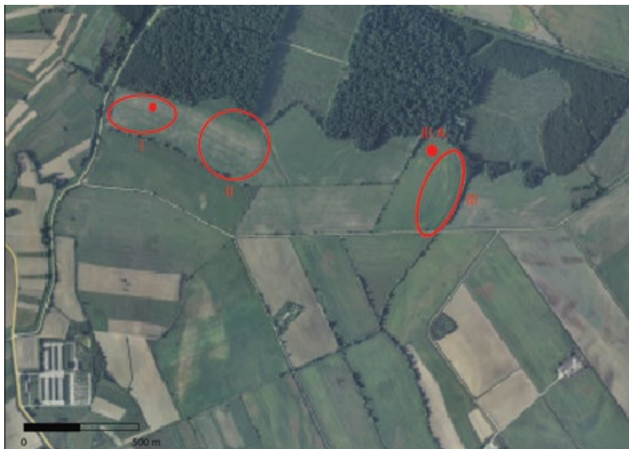
Karta 7: Položaji i areal rasprostriranja arheoloških lokaliteta Delovi - Banovice I., II., III., III.A (podloga: geoportal.dgu.hr, izradio: I. Valent)

Drugoj skupini materijala pripadaju 2 ulomka trbuha posuda izrađeni na kolu od kojih su jednom stjenke i presjek narančaste, a drugom sive boje. Izrađeni su od pročišćene gline s primjesom pijeska. Ova se 2 ulomka okvirno mogu datirati u antičko razdoblje.