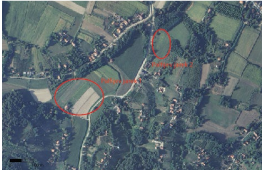
Karta 8: Položaji i areal rasprostriranja arheoloških lokaliteta Glogovac - Palfijev jarek 1 i 2 (podloga: geoportal.dgu.hr, izradio: I. Valent)

Drugoj skupini pripadaju ulomci izrađeni na brzom lončarskom kolu iz pročišćene gline s većim udjelom pijeska i pokojim sitnim kamenčićem. Boja stjenki im je pretežno siva, svjetlo ili tamno smeđa ili narančasto-siva. Presjek im je najčešće iste boje, no na pojedinima je sivi. Uz iznimku 1 ulomka dna, prikupljeni su ulomci dijelovi trbuha posuda. Okvirno ih se može smjestiti u kasnosrednjovjekovno razdoblje i povezati s materijalom prikupljenim na nedalekom položaju Palfijev jarek I.