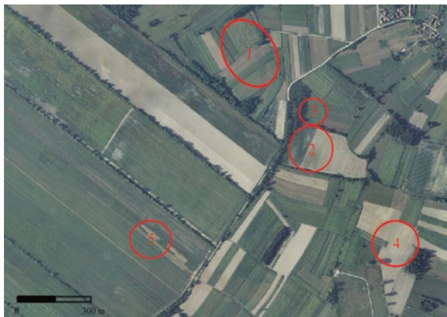
Karta 1: Položaji i areal rasprostriranja arheoloških lokaliteta Jeduševac - Stari Jeduševci 1 (1), Delovi - Podkućnice (2), Delovi - Podkućnice-iza groblja (3), Delovi - Staro Selo (4), Jeduševac - Staro Selo 2 (5) (podloga: geoportal.dgu.hr, izradio: I. Valent)

toga 3 ulomka fine fature, sive odnosno sivo/narančaste boje stjenki i presjeka, koji se mogu datirati u antički period. Najveći broj ulomaka (16) moguće je datirati u razvijeni (možda i prijelaz na kasni) srednji vijek. Svi ulomci pripadaju tijelima posuda te su uglavnom sive boje stjenki i presjeka. Tek 3 ulomka su ukrašena i to snopovima vodoravnih linija i / ili tankom češljastom valovnicom. Pronađen je i dio ručke te 2 ulomka tijela posude narančaste boje od kojih 1 ima tragove glazure. Ova 3 ulomka mogu se datirati u novi vijek. Osim keramike, na lokalitetu je prikupljen i 1 komad kovačke zgure.