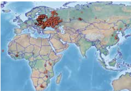
Slika 2. Pojavnost ASK u Europi tijekom 2018. godine (prema podatcima Međunarodnog ureda za zdravlje životinja, OIE, World Animal Health Information Database (WAHIS Interface), kolovoz 2018.

S obzirom na iznimnu otpornost virusa u vanjskom okolišu, inficirana divlja svinja tijekom inkubacije (do 4 dana od infekcije), trajanja infekcije te rekonvalescencije, svježim ili sasušanim sekretima i ekskretima omogućuje daljnje širenje virusa. Premda pojava kanibalizma u divlje svinje nije u cijelosti istražena, postoji i mogućnost prijenosa virusa lešinama uginulih divljih svinja. Smatra se da ulogu u širenju infekcije mogu imati i predatori te ptice koje raznose lešine uginulih divljih svinja. U posušenoj krvi pri sobnoj temperaturi virus ASK je infektivan do 15 tjedana, mjesecima pri 4 °C, 60 do 100 dana u fecesu, a i duže u urinu (de Carvalho Ferreira i sur., 2014.). U svinjcu opstaje i do mjesec dana, dok u sušenim proizvodima svinjskog podrijetla do 400 dana (šunka), a u