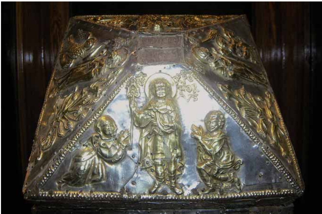
19. Prikaz sv. Kristofora s donatorima na škrinjici-relikvijaru sv. Kristofora, Rab, Riznica katedrale Depiction of St Christopher with the donors, Reliquary casket of St Christopher, Rab, Cathedral treasury

i vrijednim zlatarskim radom daruje zadarske franjevce. 25 Na dataciju križa u doba anžuvinske vlasti upućuje i »viteški tip« prikaza sv. Krševana, koji u to vrijeme odmjenjuje »monaški tip« uobičajen u vrijeme mletačke vlasti tijekom prve polovine 14. stoljeća. 26 Koliko mi je poznato, osim na Škrinji sv. Šimuna u Zadru (sl. 9), prikaze darovatelja na radovima našega srednjovjekovnog zlatarstva nalazimo još samo na škrinjici-relikvijaru sv. Kvirina iz zadarske Crkve sv. Marije, 27 na pastoralu zadarskog nadbiskupa Valaressa (nadbiskup pred sv. Stošijom), 28 te na poklopcu relikvijara sv.