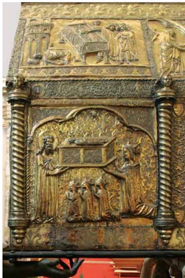
9. Donatorska scena s poledine Škrinje sv. Šimuna, Zadar, Crkva sv. Šimuna A scene with the donor on the back of St Simeon's reliquary shrine, Zadar, St Simeon church

Križ je privukao pažnju istraživača tek u drugoj polovici 20. stoljeća kada je izložen na izložbi Zlato i srebro Zadra . 5 Već tada ga je G. Oštrić datirao u 14. stoljeće, s čime će se kasnije složiti većina autora. M. Grgić ga dvadesetak godina kasnije datira u prvu polovinu 14. stoljeća na temelju tobožnje izrazite sličnosti u stilu emajliranih prikaza na križu s onima na škrinjici-relikvijaru sv. Krševana, 6 što je posve neprihvatljivo. 7 I. Petricioli ocjenjuje da je riječ o najvrjednijem od svih zadarskih ophodnih križeva, a zbog srodnih graviranih likova uspoređuje ga s ophodnim križem opatice Pave, 8 kojeg je datirao oko 1370. godine. 9 Najcjelovitiju komparativnu analizu križa donosi N. Jakšić, utvrdivši da srodne