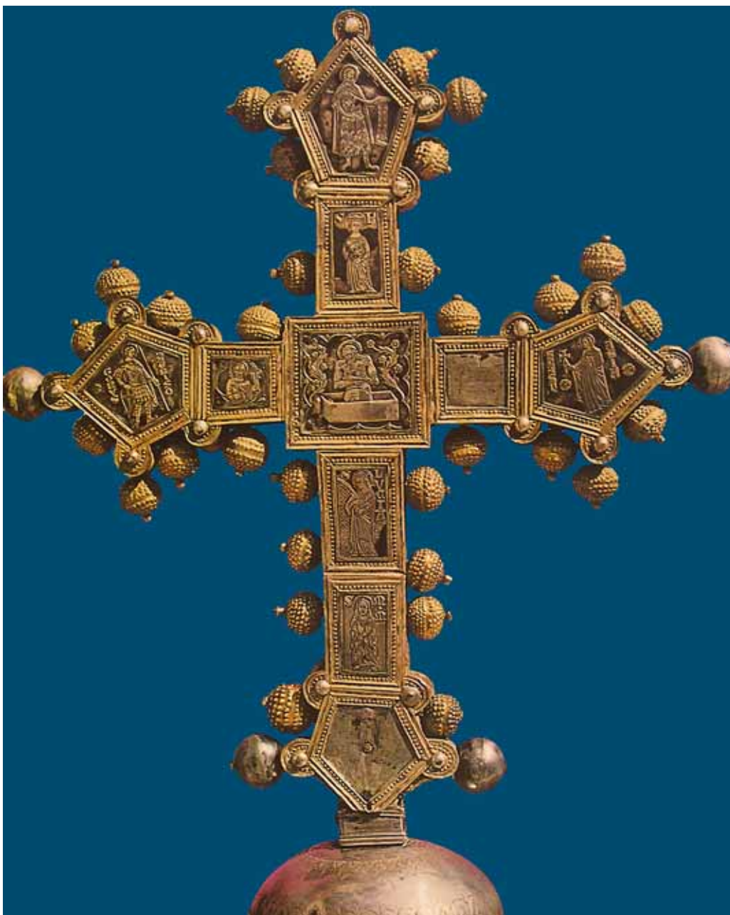
4. Ophodni križ iz Samostana sv. Frane u Zadru – revers

Processional cross from the monastery of St. Francis in Zadar – reverse