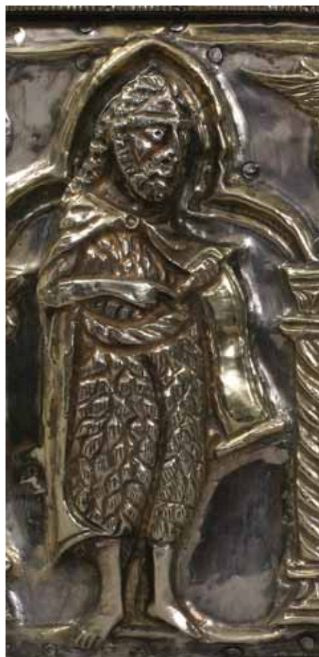
13, 14 Prikazi sv. Marije Magdalene sv. Ivana Krstitelja na škrinjici-relikvijaru sv. Marcele, Nin, riznica župne crkve

Depictions of St Mary Magdalene and St John the Baptist, Reliquary casket of St Marcella, Nin, Parish church treasury