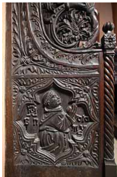
18. Prikaz donatora fra Benedikta na korskim klupama, Zadar, crkva sv. Frane

Depiction of St Louis of Toulouse on the choir stalls, Zadar, St Francis church