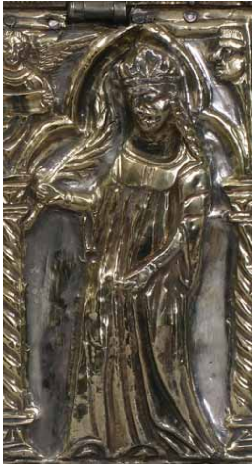
15, 16 Prikazi svetica na škrinjici-relikvijaru sv. Marcele, Nin, riznica župne crkve Depictions of female saints, Reliquary casket of St Marcella, Nin, Parish church treasury

autorstva spomenutog križa osobito važan prikaz kraljice kao donatorice škrinje (sl. 9). Kvalitativni odmak križa u odnosu na većinu gotičkih ophodnih križeva u Dalmaciji također bi našao logično objašnjenje u autorstvu toga vještog Milanca. Osim toga, Franjo slovi kao prvi donositelj Giottovih inovacija u Zadar, kako to zorno pokazuje i sama srebrna svečeva arka. Stigmatizacija sv. Franje prikazana u dnu aversa križa upravo je giotteskna u svom oblikovanju, a figura sv. Marije Magdalene na reversu križa prikazana je u inačici gdje je potpuno obrasla u kosu, kao na srebrnim škrinjicama-relikvijarima za glave sv. Marcele i sv. Azela u Ninu, koje je E. Hilje pripisao upravo zlataru Franji iz Milana. 15 Naime, kako su već upozorili M. Grgić i N. Jakšić, prikaz sv. Marije Magdalene prekrivene gotovo u potpunosti vlastitom kosom na jednom od pravokutnih segmenata franjevačkog ophodnog križa nalazimo i na poleđini srebrnog ninskog relikvijara sv. Marcele (sl. 13). U tom je smislu indikativno da sličan ikonografski tip sv. Marije Magdalene, osim na ova dva zlatarska rada podrijetlom sa šireg zadarskog područja, u našoj srednjovjekovnoj umjetnosti nalazimo još samo na luneti Dominikanske crkve u Trogiru, djelu venecijanskoga kipara Nikole Dente zvanoga Ceruo, koje je C. Fisković