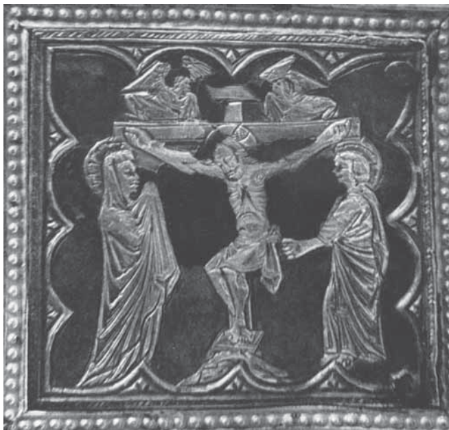
2. Raspeće , središnje polje aversa ophodnog križa (reprodukcija prema fotografiji T. Dapca u knjizi I. Petriciolija Zadarsko zlatarstvo , Beograd, 1971.)

Crucifixion, central field of the obverse of the processional cross