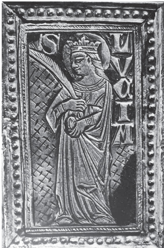
6. Sv. Lucija na reversu ophodnog križa (reprodukcija prema fotografiji M. Grčevića u knjizi M. Grgića Zlato i srebro Zadra i Nina , Zagreb, 1972.)

Imago pietatis, central field of the reverse of the processional cross