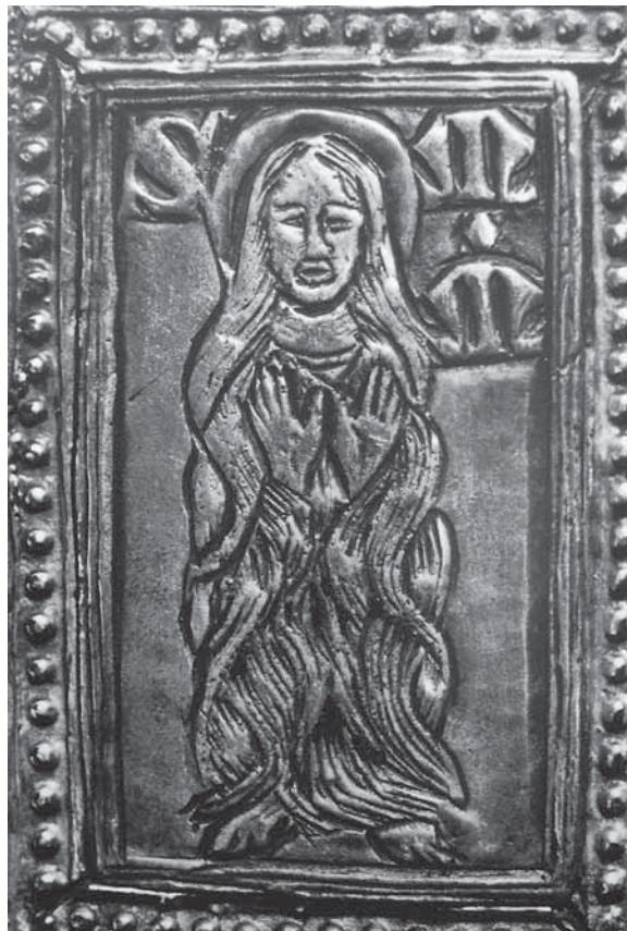
7. Sv. Marija Magdalena na reversu ophodnog križa (reprodukcija prema fotografiji M. Grčevića u knjizi M. Grgića Zlato i srebro Zadra i Nina , Zagreb, 1972.)

St Lucy on the reverse of the processional cross