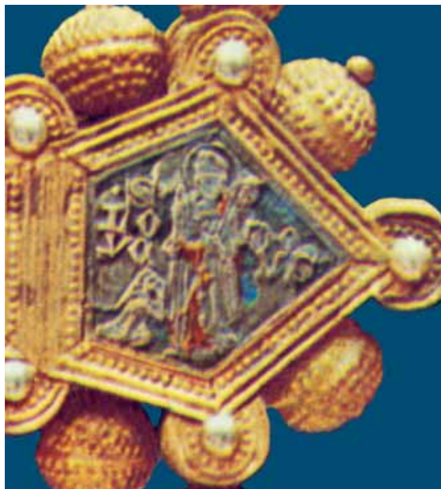
3. Desni krak aversa ophodnog križa (reprodukcija prema fotografiji T. Dapca u knjizi I. Petriciolija Zadarsko zlatarstvo , Beograd, 1971.) Right arm of the obverse of the processional cross

3a. Sv. Ludovik Tuluški i donatorica, desni krak aversa ophodnog križa (reprodukcija prema fotografiji T. Dapca u knjizi I. Petriciolija Zadarsko zlatarstvo , Beograd, 1971.)