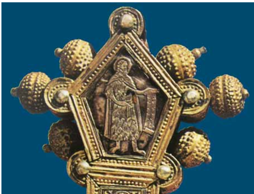
8. Sv. Ivan Krstitelj na reversu ophodnog križa (reprodukcija prema fotografiji M. Grčevića u knjizi M. Grgića Zlato i srebro Zadra i Nina , Zagreb, 1972.) St John the Baptist on the reverse of the processional cross

ECCE AGNUS DEI (sl. 8), lijevo je sv. Krševan s natpisom S. GRISOGONVS, desno sv. Stošija s legendom S: ANASTASIA, dok je pločica u dnu izgubljena. Od svih figura s križa, na aversu su gotovo u punom profilu prikazani sv. Mihovil, figure u kompoziciji Raspeća i sv. Franjo, a na reversu sv. Ivan Krstitelj, sv. Krševan, te sv. Stošija i sv. Lucija. Vjerojatno su u trima poljima u kojima danas nedostaju emajlirane pločice bili prikazani zadarski zaštitnici sv. Šimun, sv. Zoilo i sv. Donat, ukoliko uz mrtvoga Krista na reversu nije bio dopojasni lik sv. Pavla, kako je već spomenuto.