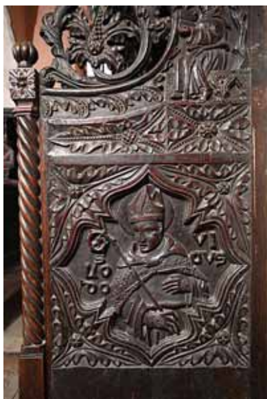
17. Prikaz sv. Ludovika Tuluškog na korskim klupama, Zadar, crkva sv. Frane

Depiction of St Louis of Toulouse on the choir stalls, Zadar, St Francis church