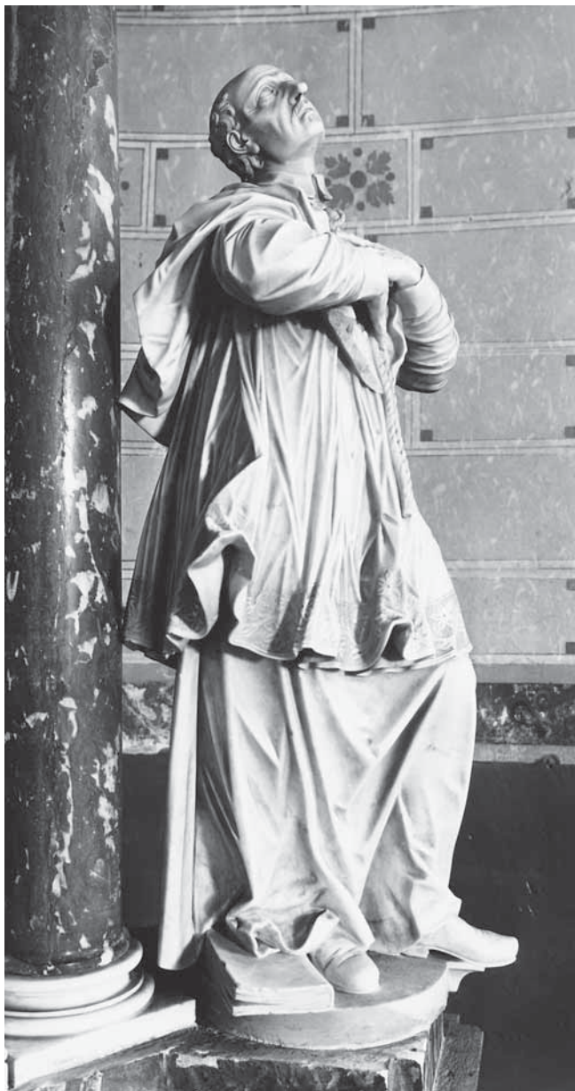
6. Antonio Michelazzi, Sv. Karlo Boromejski , mramor, 1741.–1746., Lupoglav, Župna crkva bl. Augustina Kažotića, svetište

Antonio Michelazzi, St Carlo Borromeo, marble, 1741–1746, Lupoglav, parish church of Bl. Augustin Kažotić