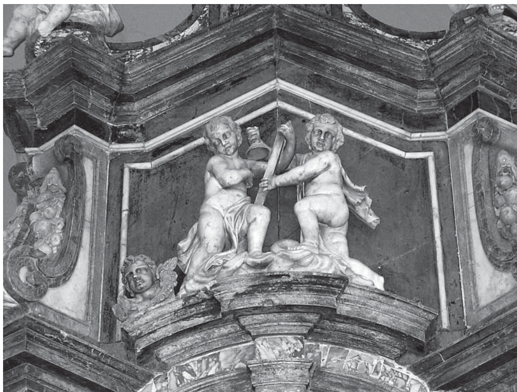
2. Antonio Michelazzi, atički zaključak oltara sv. Jurja (danas bl. Augustina Kažotića) – središnji dio, mramor, 1741.–1746., Lupoglav, Župna crkva bl. Augustina Kažotića, svetište Antonio Michelazzi, the attic ending of the Altar of St George (present-day altar of Bl. Augustin Kažotić), – centrepiece, marble, 1741–1746, Lupoglav, parish church of Bl. Augustin Kažotić

vora, na kojem Tkalčić temelji svoju tvrdnju o naknadno pridodanom atičkom katu, nema spomena nikakve oltarne arhitekture, već se navode samo skulpture, ovoga puta od kararskoga mramora, i to one – bl. Augustina Kažotića i dvaju putta koji u rukama drže mitru i pastoral.