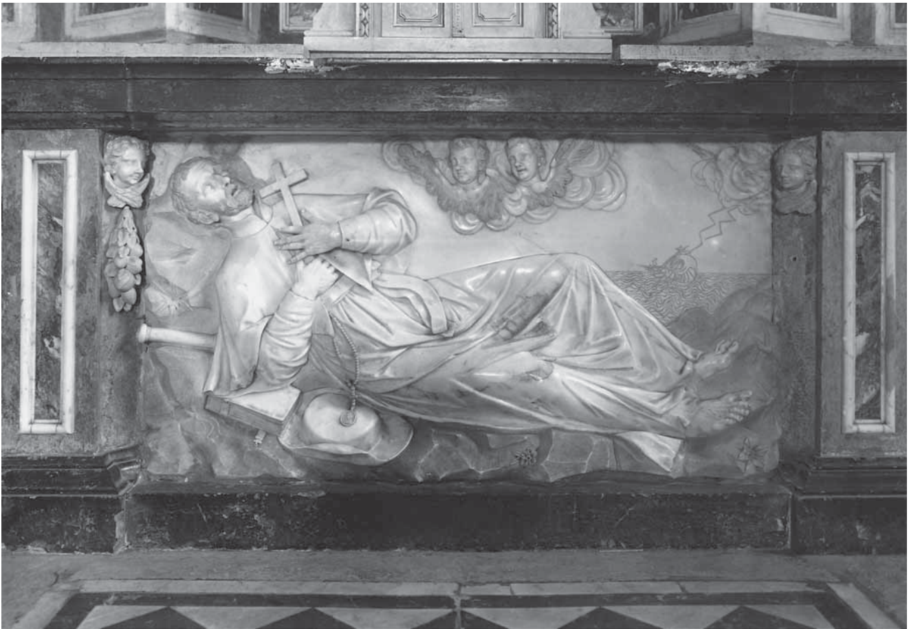
3. Antonio Michelazzi, Smrt sv. Franje Ksaverskoga , mramor, 1741.–1746., Lupoglav, Župna crkva bl. Augustina Kažotića, svetište

Antonio Michelazzi, Death of St Francis Xavier , marble, 1741–1746, Lupoglav, parish church of Bl. Augustin Kažotić