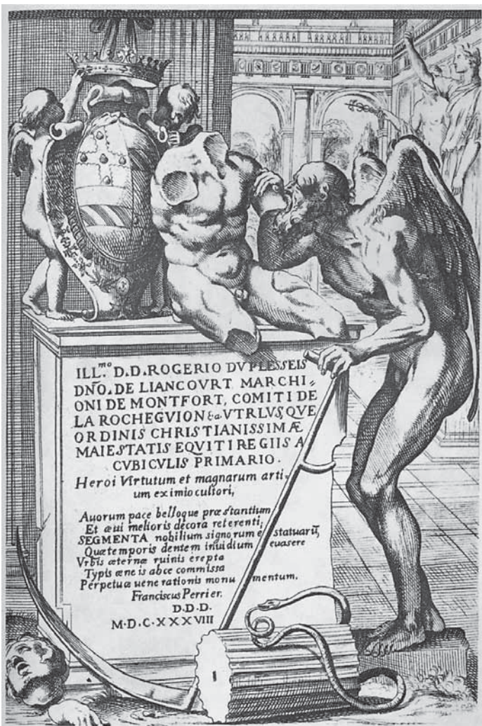
9. François Perrier, Vrijeme, 1638. François Perrier, Time, 1638