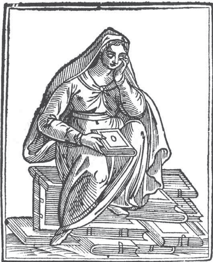
6. Meditacija (prema Tozzijevu izdanju Ripine Ikonologije, 1618.) Meditation (according to Tozzi's edition of Ripa's Iconology, 1618)