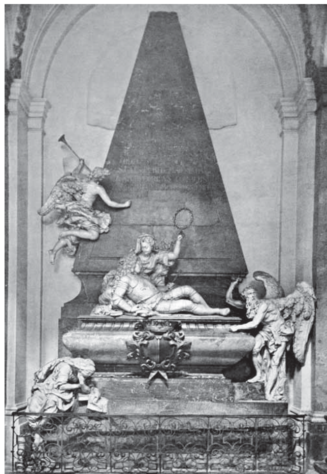
5. Spomenik grofu Wratislavu von Mitrowitzu, 1715.–1716., Prag, Crkva sv. Jakova, Ferdinand Maximilian Brokof

Design for the monument of Count Wratislav von Mitrowitz by Johann Bernhard Fischer von Erlach, 1714