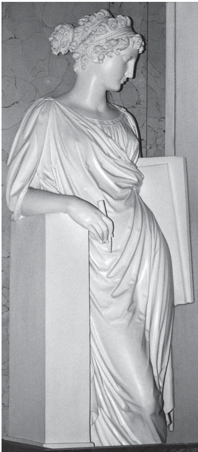
13. Muza, 1823.–1824., Beč, Albertina, Josef Klieber Muse by Josef Klieber, 1823–1824, Albertina in Vienna

se čini, izlivena i figure stražemanskog spomenika. 47 Stanoviti paralelizmi zamjećuju se i usporedbom Fischerova djela i stražemanskog spomenika: naglašeni linearizam draperije u pojedinim primjerima, uporaba plastički naglašenog motiva plamena navrh glave njegovih alegorijskih figura genija (ranije spomenute skulpture iz 1794. i 1812. godine), kao i stanovite