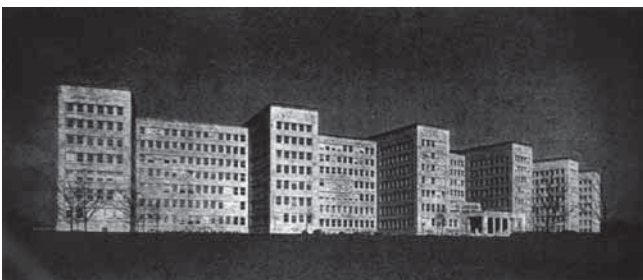
5. Paviljon Deutsche Werkbunda u Kölnu W. Gropiusa i A. Meyera i Upravni dom I. Z. Farbenindustrie H. Poelziga predstavljeni na »Izložbi njemačke suvremene likovne umjetnosti i arhitekture« (NN, Gropius Walter, Berlin – Pöltzig Hans, Berlin, u: Hrvatska revija , 8 (1931.), 435)

Deutsche Werkbund Pavilion in Cologne by W. Gropius and A. Meyer and the Administration Centre of I. Z. Farbenindustrie by H. Poelzig as presented at the »Exhibition of German Contemporary Art and Architecture« (Anon., Gropius Walter, Berlin – Pöltzig Hans, Berlin, in: Hrvatska revija 8 (1931), 435)