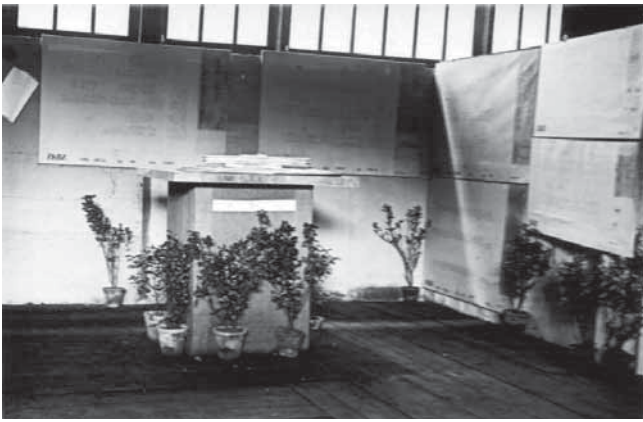
4. Izložba natječajnih radova za Zakladnu i kliničku bolnicu u Zagrebu. Nagrađeni projekt E. Weissmanna, 1931.

The exhibition of competition designs for the Foundation and Clinical Hospital in Zagreb. The awarded design by E. Weissmann, 1931