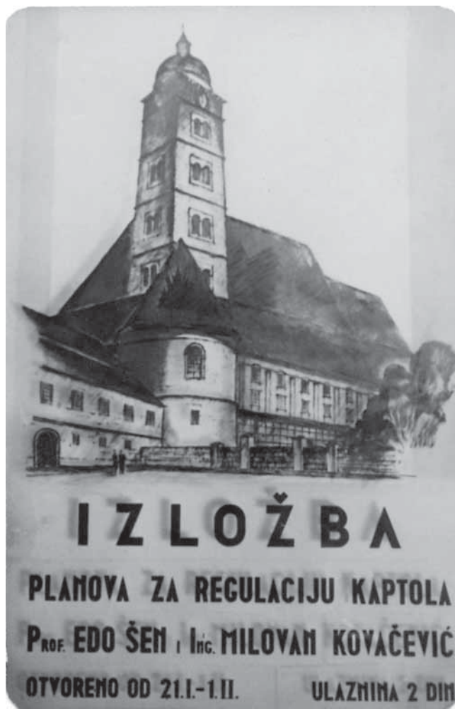
7. Plakat izložbe planova za regulaciju Kaptola E. Šena i M. Kovačevića, 1935.

Neidhardtova izložba imala je sasvim druge pobude – javnosti pokazati i protumačiti vlastitu viziju suvremene arhitekture i gradogradnje nakon dvogodišnjega intenzivnog sudjelovanja na natječajima i nijedne realizacije. 60 Uloženi naponi, gostovanje izložbe u Beogradu, Ljubljani i Sarajevu te osvrti Neidhardtovih kolega Milana Severa i Dušana Grab-