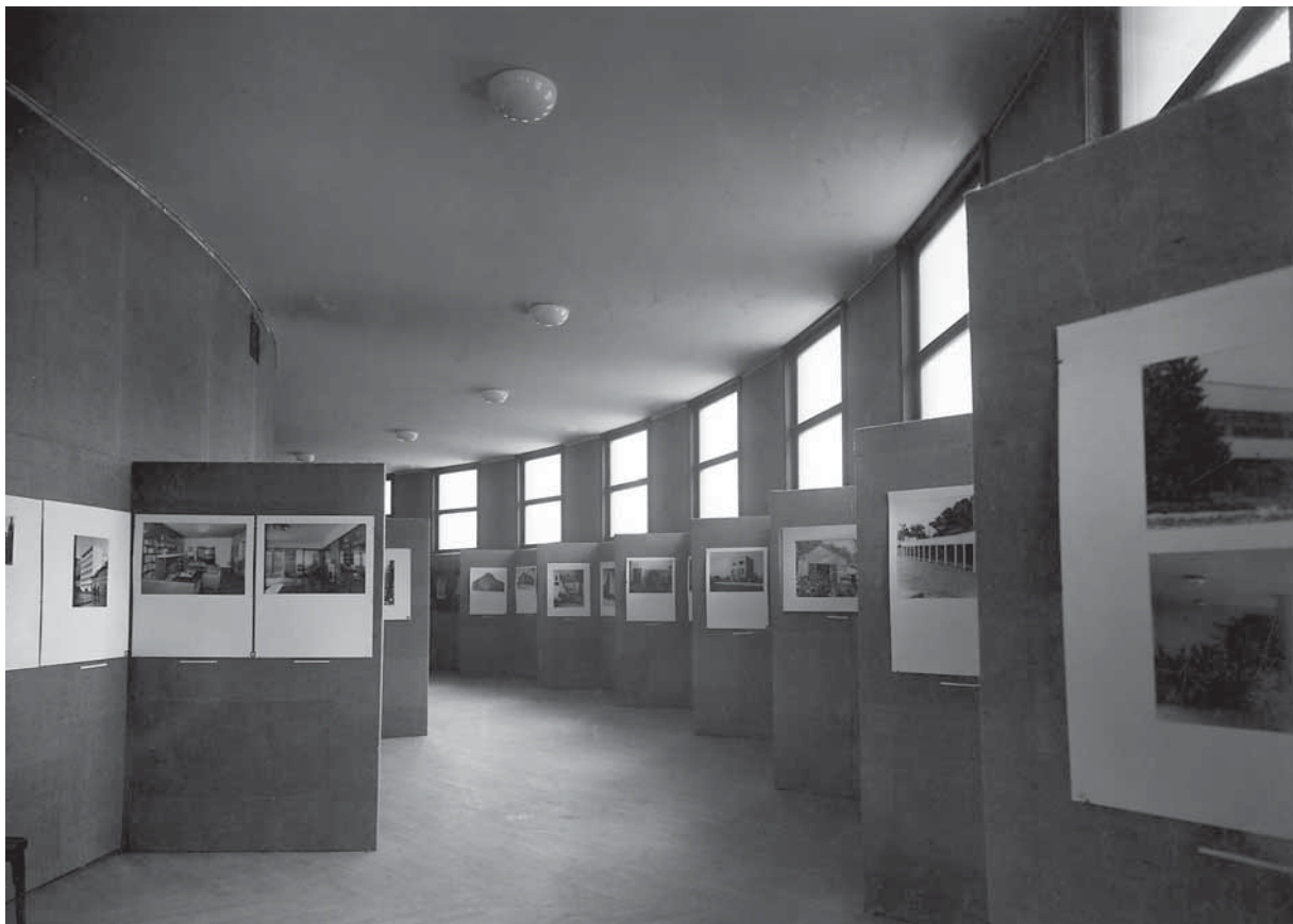
8. Arhitektonski odjel izložbe »Pola vijeka hrvatske umjetnosti« u Domu likovne umjetnosti 1938.–1939. g. (HAZU, Arhiv za likovne umjetnosti, F/62–2)

Architectural department of the exhibition on »Half a Century of Croatian Art« at the Artists' Centre, 1938–1939 (Croatian Academy of Arts and Sciences, Visual Arts Archive, F/62–2)