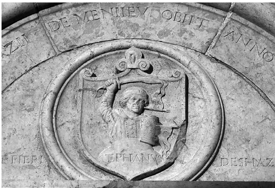
7. Johannes Fiorentinus, portal crkve u Menyöu (Mineu), grb u luneti.

Johannes Fiorentinus, portal of the church at Menyö (Mineu), 1514–1515