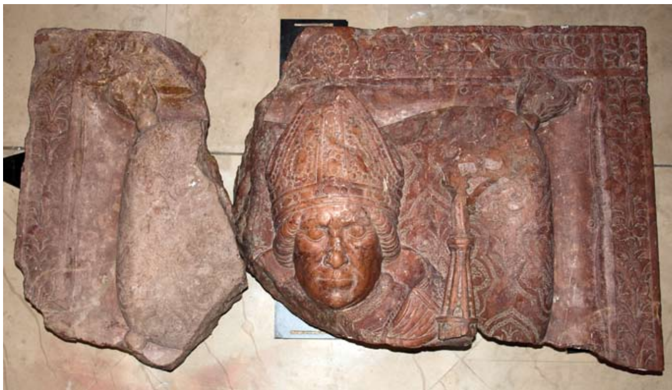
1. Johannes Fiorentinus, nadgrobna ploča biskupa Luke, dva gornja fragmenta, Zagreb, Hrvatski povijesni muzej

Johannes Fiorentinus, the tombstone of Bishop Luka, two upper fragments. Zagreb, Croatian History Museum