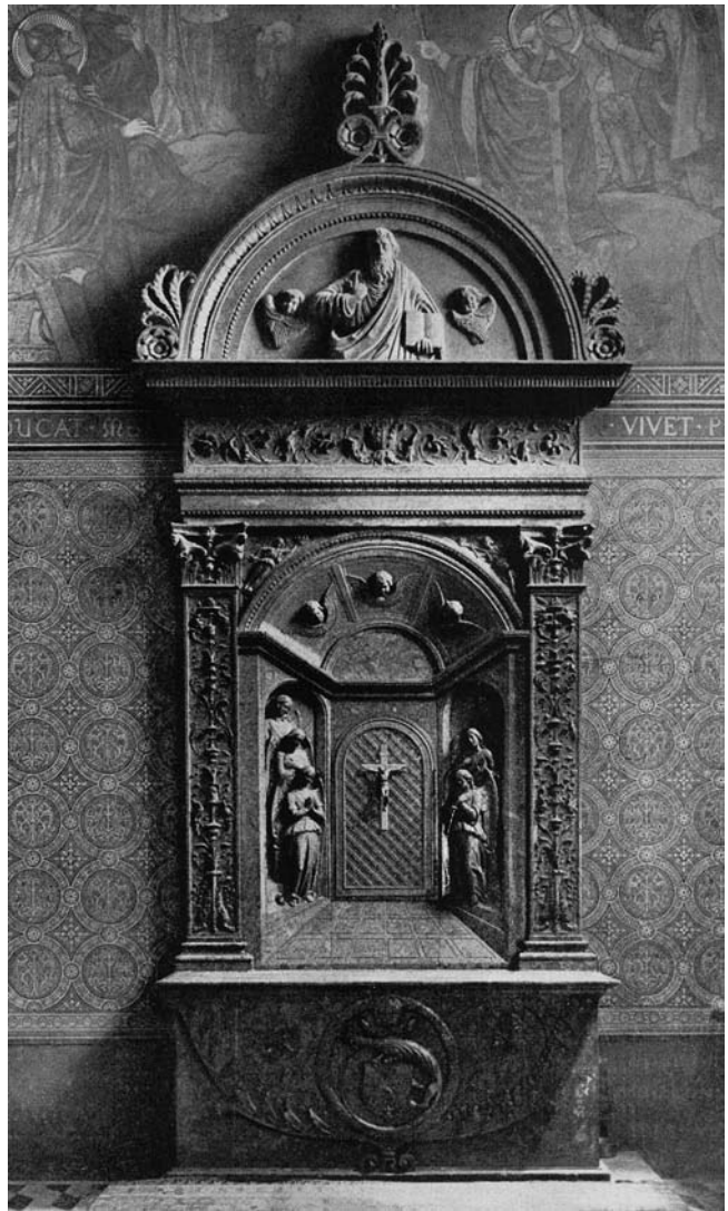
11. Pečuh, Katedrala, kustodija biskupa Szathmárijaja Pécs cathedral, tabernacle of Bishop Szatmári

klesare, koji na taj pomalo sumaran način rješavaju složenije klesarske zadatke.