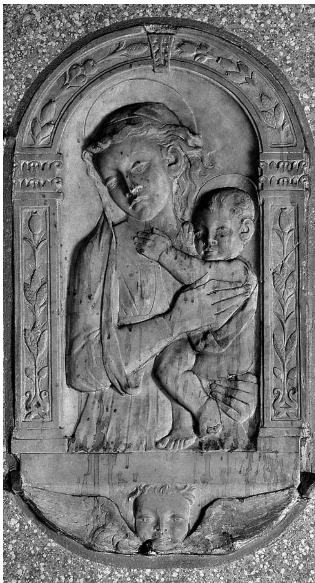
12. Vinica, Crkva sv. Marka, Bogorodica s Djetetom Vinica, church of St Mark, the Virgin with Child