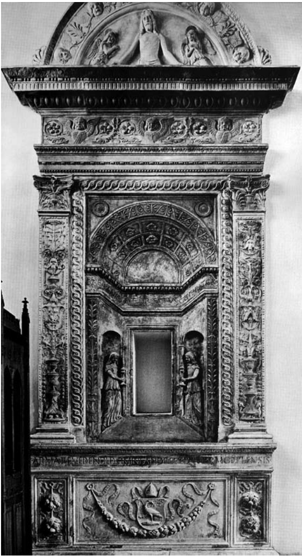
10. Budimpešta, stara Župna crkva u Pešti, kustodija, 1507. Budapest, old parish church in Pest, tabernacle, 1507