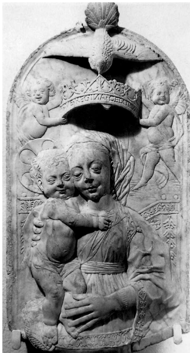
13. Majstor mramornih Madonna, Bogorodica s Djetetom, Bribir, Župna crkva Master of Marble Madonnas, the Virgin with Child, Bribir, parish church