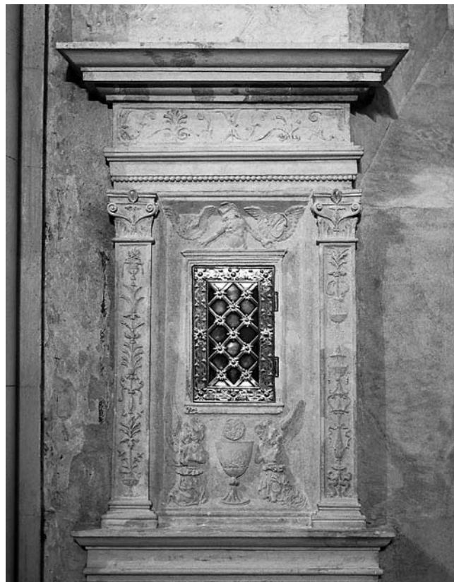
9. Požega, Crkva sv. Lovre, kustodija, srednji dio tabernakula Požega, church of St Lawrence, tabernacle, central part

četiri dijela. Na četvrtasti parapet nadovezuje se središnja kustodija nalik edikuli s ukrasnim okvirom i trabeacijom. Iznad nje se na profiliranom grednom istaku vjerojatno nalazila luneta koja je završavala akroterijem u obliku palmete. Današnji četverokutni oblici ostataka tih gornjih dijelova zbog restauratorske obrade više ne odgovaraju njihovu izvornom obrisu. Takav je raspored dijelova uvriježen kod većine ugarskih kustodija iz toga doba, od kojih se one zahtjevnije (npr. Tereske, Nyírbátor, Kövesd), kao i ova požeška, nadovezuju na firentinske uzore iz druge polovine 15. stoljeća. 17 Svi su sastavni dijelovi požeškoga svetohraništa, osim središnjega, posve otučeni, a gornje su dvije ploče vidljive tek u naznakama, te se ne može razabrati što je na njima bilo prikazano. Središnji dio cjeline pretrpio je također znatna oštećenja, a njegov sadašnji izgled odredila je restauratorska obrada 1985.–1986. pri kojoj su rekonstruirane izgubljene pojedinosti.