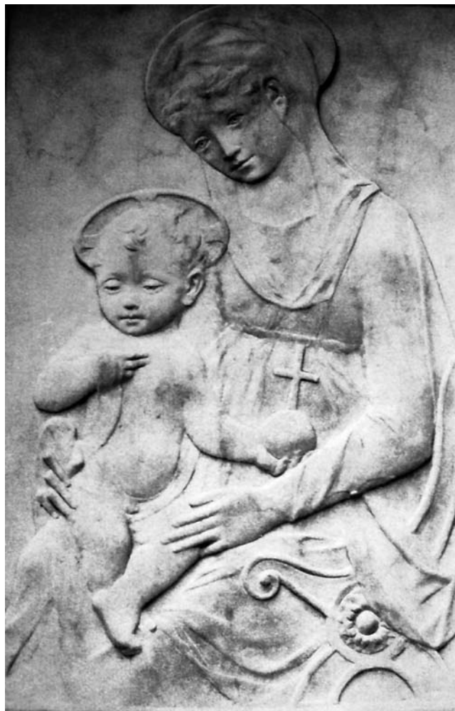
14. Mino da Fiesole, Bogorodica s Djetetom, Washington, National Gallery, Kress Collection

Vinički niski reljef od sivkastog mramora odaje ruku nekog majstora s početka 16. stoljeća koji pripada krugu panonske renesanse. U potrazi za njegovim mogućim autorom nezaobilazno je suočavanje s problematikom vezanom uz još uvijek zagonetno ime Majstora mramornih Madonna. 27 To je ime za nuždu još 1866. u literaturu uveo Wilhelm Bode, pišući o nekoliko mramornih reljefa slične izrade u Berlinskom kraljevskom muzeju. Kasniji istraživači donosili su nove prijedloge na temelju komparativne analize poznatih spomenika. Tako je 1922. taj majstor poistovječen s Tommasom Fiambertijem,