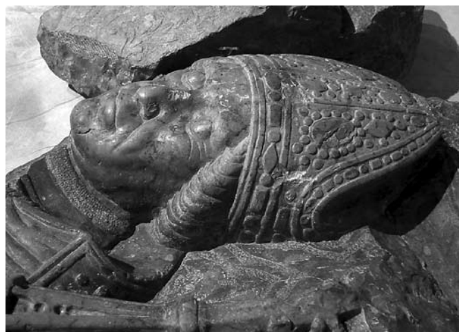
3. Johannes Fiorentinus, nadgrobna ploča biskupa Luke, detalj glave, Hrvatski povijesni muzej

Johannes Fiorentinus, the tombstone of Bishop Luka, bottom fragment, Zagreb, Croatian History Museum