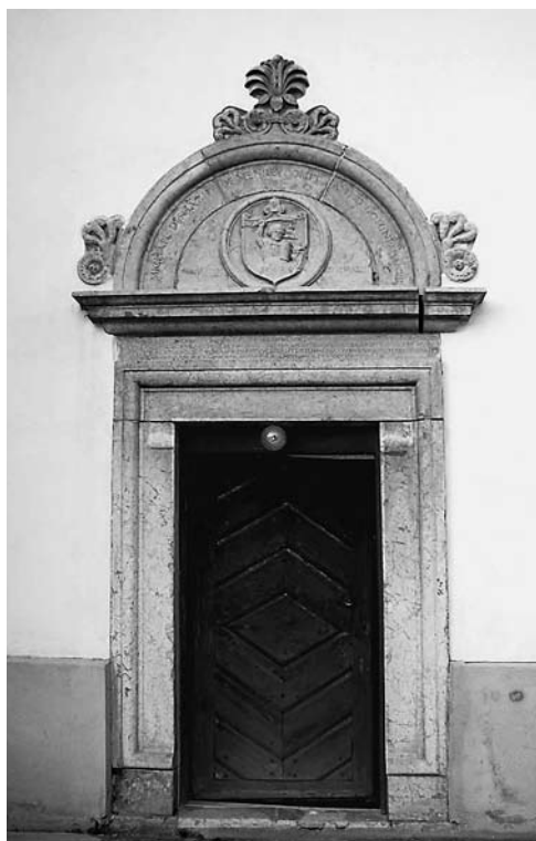
6. Johannes Fiorentinus, portal crkve u Menyöu (Mineu), 1514.–1515.

Johannes Fiorentinus, portal of the church at Menyö (Mineu), 1514–1515