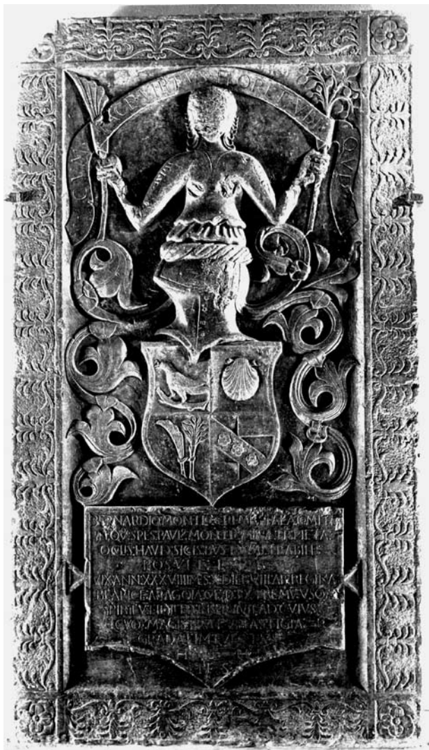
4. Johannes Fiorentinus, nadgrobnja ploča Bernarda Monellija, 1496., nekoć u Crkvi sv. Marije u Budimu, sada u Povijesnom muzeju u Budimpešti

Johannes Fiorentinus, the tombstone of Bernard Monelli, 1496, formerly in the church of St Mary at Buda, today in the History Museum, Budapest