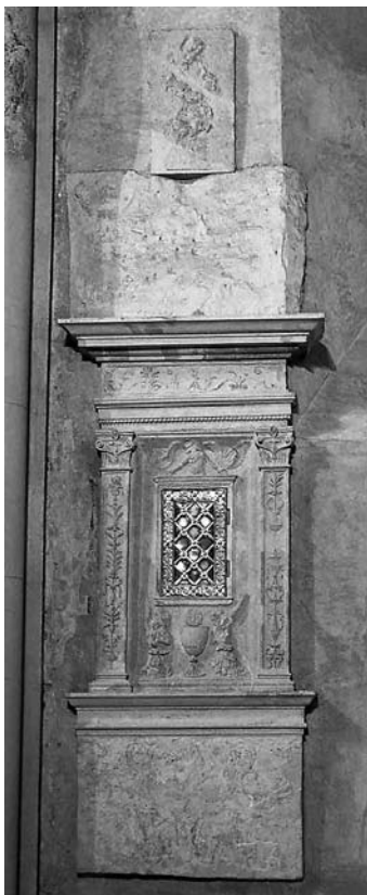
8. Požega, Crkva sv. Lovre, kustodija Požega, church of St Lawrence, tabernacle