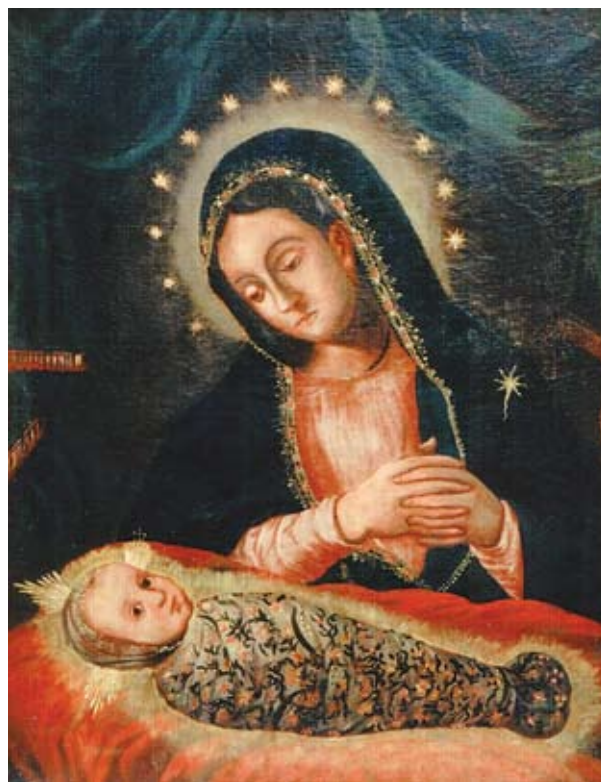
12. Filippo Naldi, Bogorodica s Djetetom , Makarska, Franjevački samostan Filippo Naldi, The Virgin with Child, Makarska, Franciscan monastery