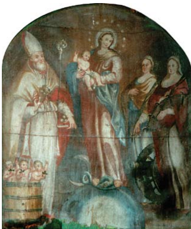
13. Filippo Naldi, Bezgrešno začeće Blažene Djevice Marije i sveci , Drašnice (Makarska), Župna crkva sv. Jurja Filippo Naldi, The Immaculate Conception with Saints, Drašnice (Makarska), parish church of St George