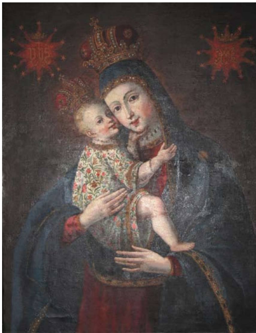
35. Bogorodica s Djetetom , Živogošće, Franjevačka crkva sv. Križa The Virgin with Child, Živogošće, Franciscan church of the Holy Cross

predaji, sliku je iz Budima donio ugledni redovnik fra Petar Karapandža (Goranci kraj Mostara, oko 1680. – Živogošće, 1765.), gdje je bio profesor teologije i filozofije na Franjevačkom učilištu, te ju je darovao samostanu u Živogošću, u kojem je proveo posljednje desetljeće svojega života (1755.–1765.). 33 Te je podatke zabilježio je 1931. godine fra Karlo Balić. Opisujući crkvu Balić navodi da je »pobočni oltar posvećen Majci Božjoj. Gospa drži u desnoj ruci Djetića. Ovu je sliku naslikao god. 1727 u Budimpešti Polikarp F. Scotus, a crkvi ju je darovao fra Petar Karapandža. To nam svjedoči natpis na zadnjem dijelu slike, koji ovako glasi: 'Donata et cordicibus commendata devotioni, et fervori religiosorum venerab: contus S. Crucis Xivogosten. Al. prov. Bosnae arg. ab ejud. Alum.= Devoto Iesu et Mrae cliente fre Petro Karapancsich SS. Th. L. Ge. Devoti mirabilem spr experientur.' Pri dnu