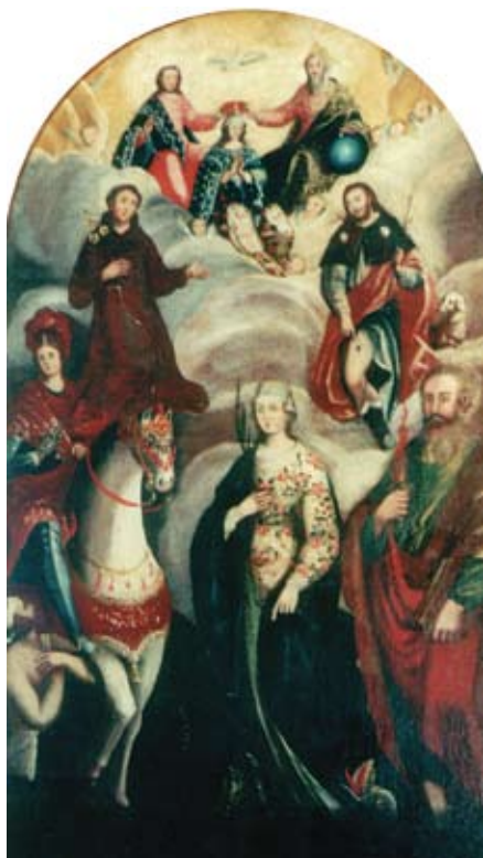
15. Filippo Naldi, Krunjenje Bogorodice sa Presvetim Trojstvom, sv. Antunom Padovanskim, sv. Rokom, sv. Martinom, sv. Margaritom i sv. Pavlom , Brist (Makarska), Župna crkva sv. Margarite Filippo Naldi, The Coronation of the Virgin with the Holy Trinity, St Anthony of Padua, St Rochus, St Martin, St Margaret, and St Paul, Brist (Makarska), parish church of St Margaret