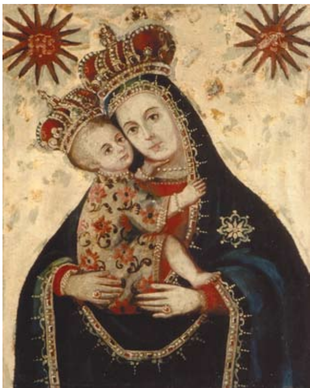
11. Filippo Naldi, Bogorodica s Djetetom , Makarska, Franjevački samostan Filippo Naldi, The Virgin with Child, Makarska, Franciscan monastery