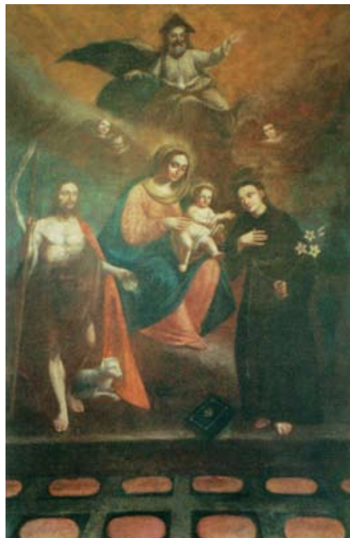
16. Filippo Naldi, Bogorodica s Djetetom, Bogom Ocem, sv. Ivanom Krstiteljem i sv. Antunom Padovanskim , Brist (Makarska), Crkva sv. Ante Padovanskoga Filippo Naldi, The Virgin with Child, God the Father, St John the Baptist, and St Anthony of Padua, Brist (Makarska), Church of St Anthony of Padua