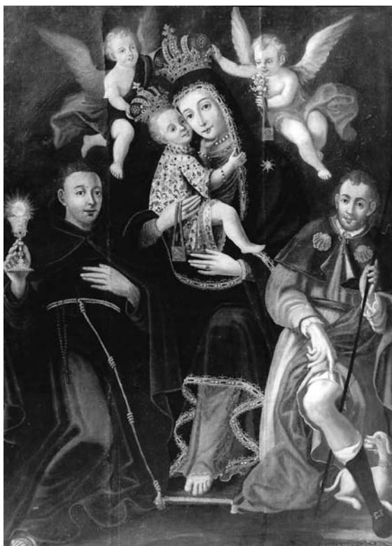
18. Filippo Naldi, Gospa od Karmela sa sv. Paskalom i Rokom , Sućurje (Hvar), Crkva sv. Antuna Padovanskog Filippo Naldi, Our Lady of Carmel with St Paschal and St Rochus , Sućurje (Hvar), Church of St Anthony of Padua