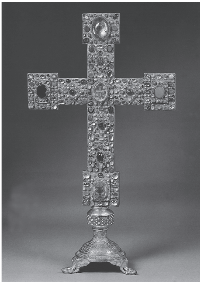
5. Tzv. Henrikov križ, prednja strana; 1. trećina 12. st., Riznica Katedrale, Fritzlar

The so-called »Henry's Cross«, front, first third of the 12 th c. Treasury of the cathedral (Fritzlar)