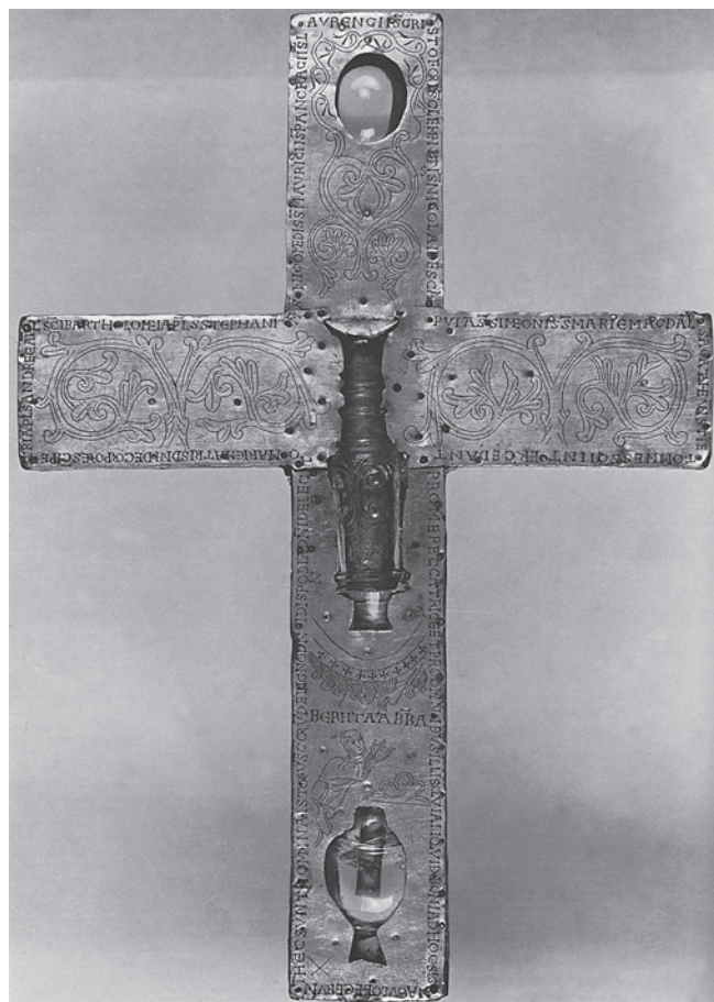
4. Relikvijar u obliku križa iz Borghorsta, prednja i stražnja strana, 1. pol. 11. st., Münster, Westfälisches Landesmuseum

Cross-shaped reliquary from Borghorst, front and reverse, early 11 th c.