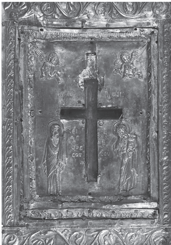
9. Stauroteka s poklopcem, unutrašnji dio, bizantska umjetnost, 11. st., Pariz, Muzej Louvre

Staurotheca with a lid, interior. Byzantine art, 11 th c., Paris, Louvre