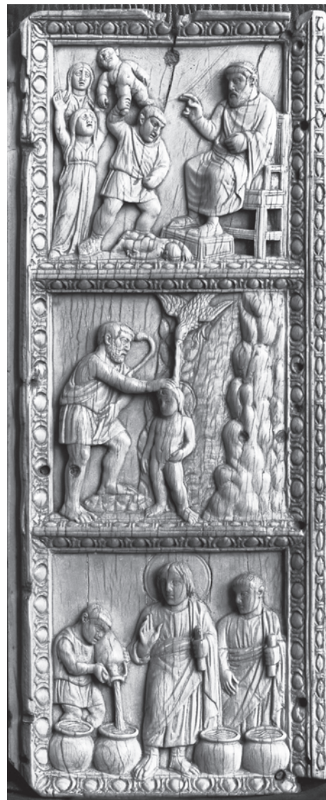
3. Ranokršćanski bjelokosni reljef, 5. st., Berlin

Carolingian ivory relief, second half of the 9 th c., Munich, Bayerische Staatsbibliothek