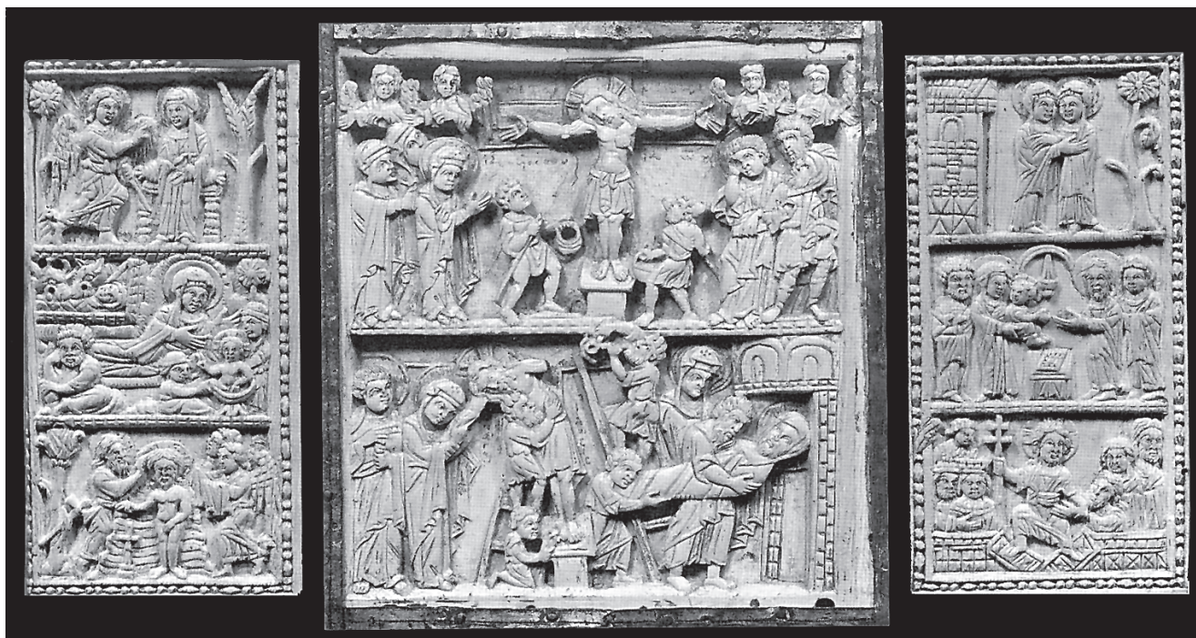
11. Triptih od bjelokosti iz Freisinga (rastavljen i naknadno umetnut u korice lektionara i evanđelijara), bizantska umjetnost, kraj 10. st. München, Bayerische Staatsbibliothek

Ivory triptych (dismantled and subsequently inserted into the covers of the lectionary and book of Gospels), Byzantine art, late 10 th c., Munich, Bayerische Staatsbibliothek (formerly Freising)