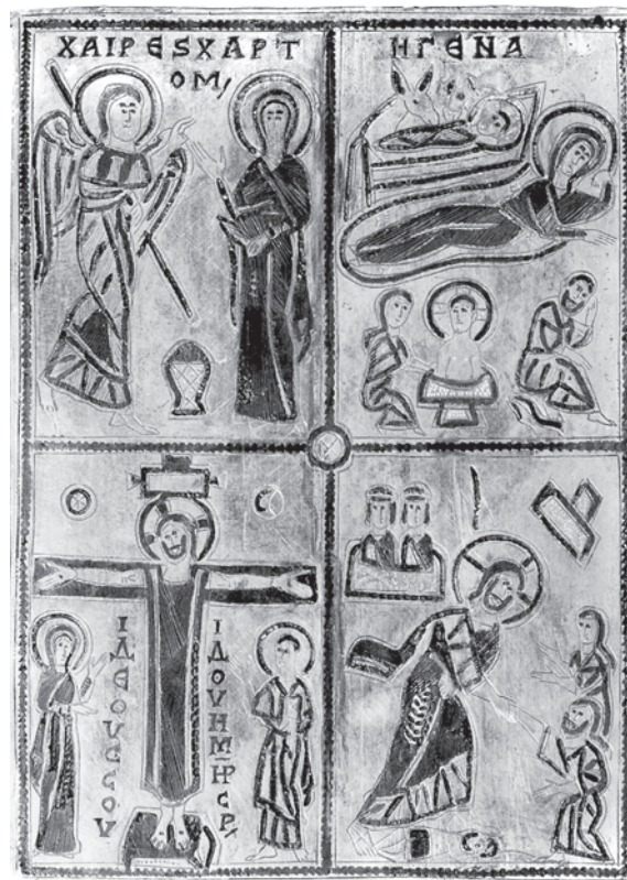
10. Stauroteka, unutrašnji dio poklopca, bizantska umjetnost, 8.–9. st., Metropolitan Museum of Art, New York

Staurotheca with a lid, interior. Byzantine art, 11 th c., Paris, Louvre