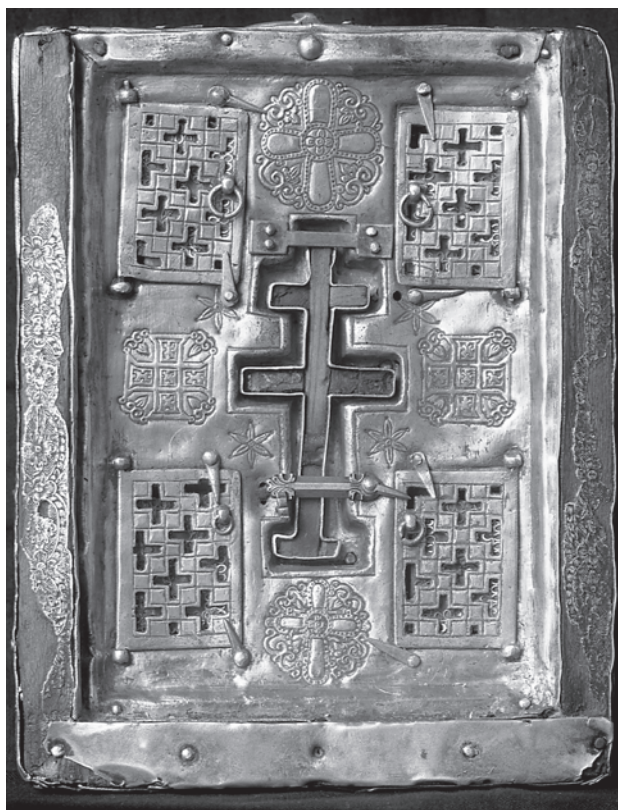
7. Stauroteka; bizantska umjetnost, kraj 11. st., Opatijska crkva sv. Križa, Donauwörth

Staurotheca, Byzantine art, late 11 th c. Church of the Holy Cross, Donauwörth