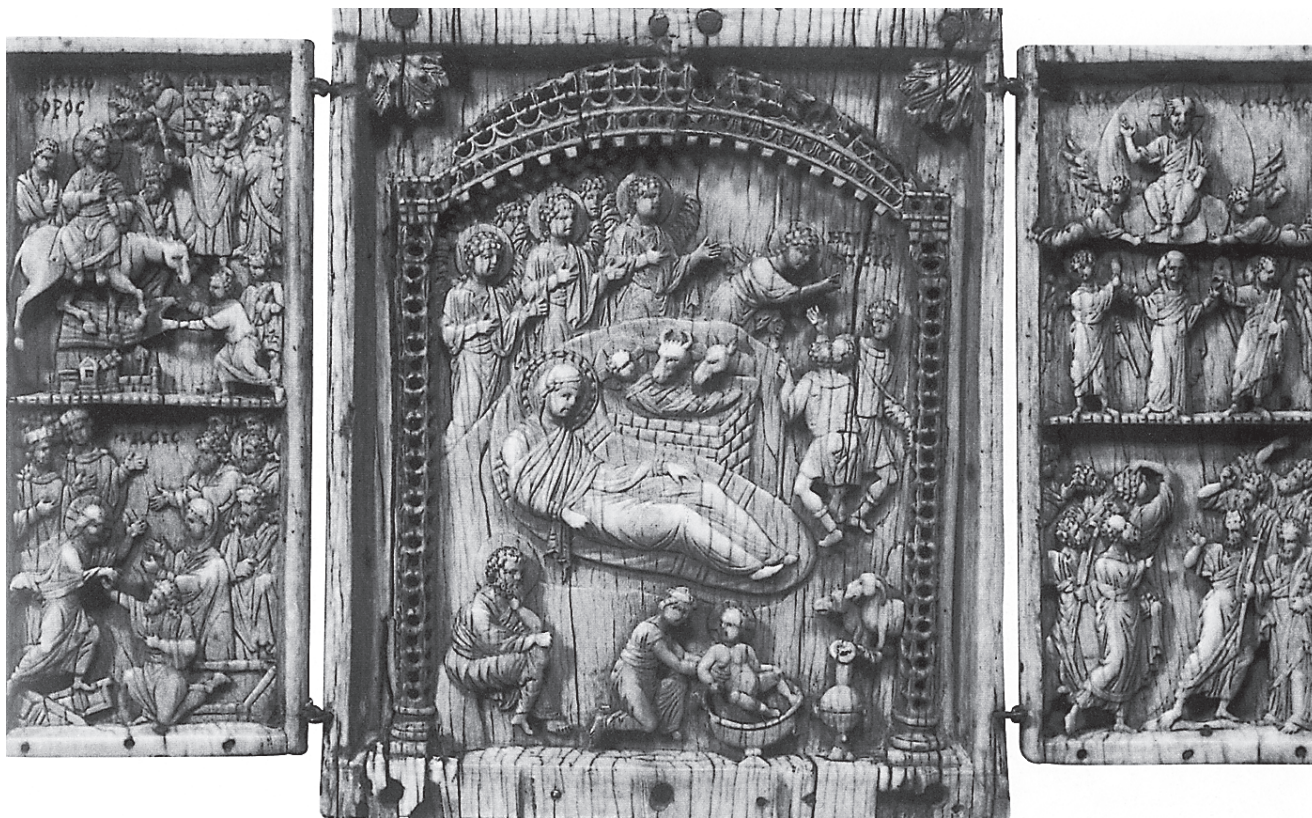
12. Triptih od bjelokosti, bizantska umjetnost, kraj 10. st., Pariz, Muzej Louvre Ivory triptych, Byzantine art, late 10 th c., Paris, Louvre

skim »injekcijama« u prevladavajuće zapadnoj ikonografiji reljefa zagrebačkoga plenarija. Slično je s poznatim triptihom u Louvreu (sl. 12), koji u središtu ima prikaz Rođenja, a na krilima Ulazak u Jeruzalem i Silazak u limb (lijevo) te Uzašašće (desno). 58 Kao i ikone, takvi triptisi mogli su imati status relikvijara. Nemoguće je reći što je sve u pojedinim slučajevima odlučivalo u korist takva statusa; svakako su estetska vrijednost i (pretpostavljeno) podrijetlo određenog predmeta iz krajeva koji su u mašti zapadnjaka bili sinonim za eleganciju i rafiniranost (Bizant) ili autentičnost kršćanske poruke (Palestina) pritom imali važnu ulogu. Triptih je, osim toga, uz već spomenute oblike česta forma bizantskih relikvijara-stauroteka, koji će imati velikog utjecaja na Zapadu u 12. i 13. stoljeću. 59 Karakterističan je slučaj raskošnog triptiha u crkvi Sainte-Croix (Sv. Križ) u Liègeu, kojemu je u središtu theca s malenom česticom sv. Križa in modum crucis , po obliku i veličini vrlo slična zagrebačkoj. 60 Ugradba dragocjene relikvije, koja navodno potječe s početka 11. stoljeća, u veliki triptih iz druge polovice 12. stoljeća (1160.–1170.), karakterističan je primjer novog načina prezentiranja relikvija, blizak onomu što se istovremeno dešava u zagrebačkoj crkvi, a o čemu nas (posredno) izvješćuje tekst najstarijeg imovnika.