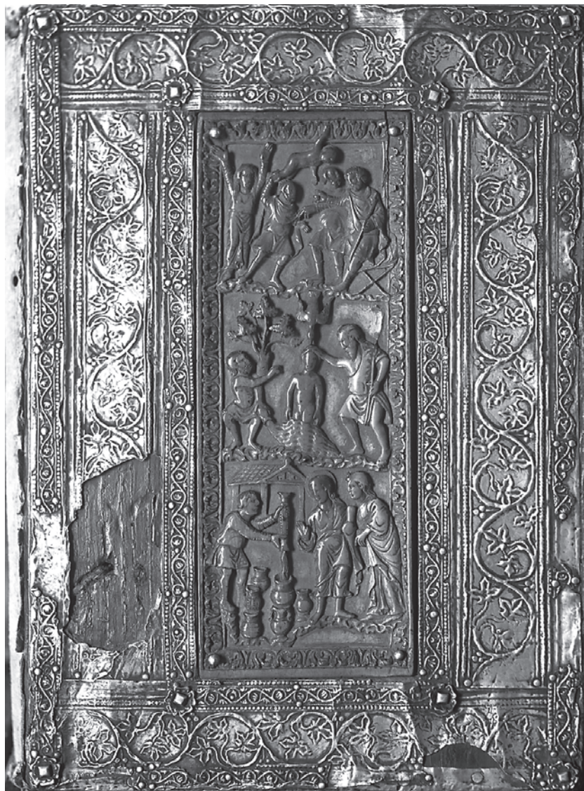
2. Karolinski bjelokosni reljef, 2. pol. 9. st., München, Bayerische Staatsbibliothek

Carolingian ivory relief, second half of the 9 th c., Munich, Bayerische Staatsbibliothek