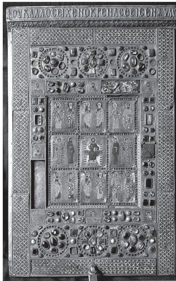
6. Stauroteka; bizantska umjetnost, 10. st., Riznica Katedrale, Limburg an der Lahn

njegova prethodnog izgleda. No, opis predmeta u imovniku ne mora biti u suprotnosti s Weissovom pretpostavkom da se u središnjoj šupljini plenarija nalazila relikvija. Već u otoskom razdoblju susrećemo, naime, primjere relikvija ugrađenih ispod prozirnog materijala, kao što je gorski kristal; na taj je način relikvija bila zaštićena i istovremeno omogućavala vizualno sagledavanje (koje je ujedno i provjera njezine autentičnosti), nagovještavajući promjene koje će do punog izražaja doći u gotičkom razdoblju. 39 Lijep primjer takva postupka je već spomenuti križ-relikvijar iz Borghorsta (sl. 4), s gorskim kristalom u sjecištu dva kraka, iza kojega je pohranjena relikvija ili tzv. Henrikov križ iz Fritzlara s početka 12. stoljeća (sl. 5). 40 Nije, dakle, nemoguće da se u otvoru posred plenarija, ispod »velikog, vrlo dragocjenog topaza«, izvorno nalazila relikvija, i to relikvija sv. Križa. Imovnik iz 1394. godine to izričito ne potvrđuje, ali spomen »maloga križa od Gospodinova drveta« na kraju opisa plenarija svakako daje povoda da se o tome razmisli. U skladu s liturgijskom praksom izlaganja svetinja u razdoblju rane gotike, u jednom se trenutku mogla pokazati potreba za izdvajanjem čestice sv. Križa iz plenarija kako bi postala dostupnija pogledima vjernika. Nije nemoguće da je upravo s tom namjerom izrađen »zlatni križ«, kao novi relikvijar, ali ne treba isključiti ni mogućnost da je Zagrebačka katedrala u najranijem razdoblju bila u posjedu dviju čestica sv. Križa,