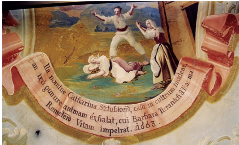
19. Ivan Krstitelj Ranger, Čudo s unesrećenom Katarinom Stubičankom iz 1663., zidna slika, Remete, 1747.

The Miracle with the Injured Katarina Stubičanka from 1663, copperplate engraving in: A. Eggerer, Pharmacopœa coelestis (1672.). Kloštar-Ivanić, Franciscan monastery