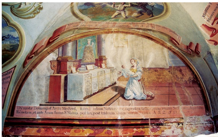
5. Ivan Krstitelj Ranger, Čudo s oživjelim sinom medvedgradskoga vladara oko 1250. , zidna slika, Remete, 1747.

Ivan Krstitelj Ranger, The Miracle with Nobleman Benedict from Vasvár from 1573, mural painting, Remete, 1747