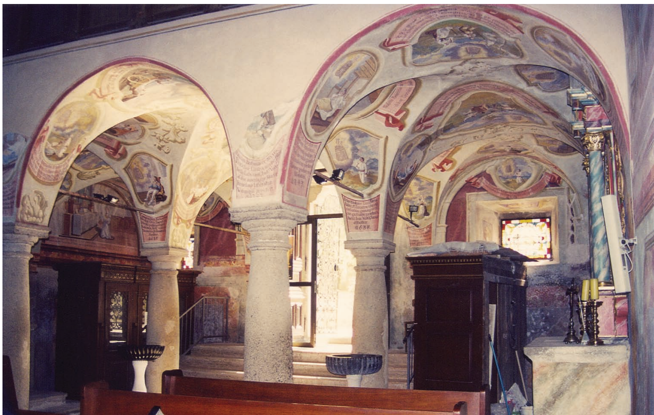
1. Remete, slikani medaljoni Ivana Krstitelja Rangera iz 1747. g. Remete, painted medallions by Ivan Krstitelj Ranger from 1747

Medaljoni su slikani na zakrivljenim ploham svoda i na ravnim zidovima, no svaka je slika »položena« na zidni plašt kao prenesena ( quadro riportato ), s vlastitim okvirom, očištem i natpisom na iluzioniranoj traci ili polju pod njim. Za svaki od njih promatrač mora u potpunosti promijeniti motrište, a njegov hod unosi u oslik dimenziju vremena. S obzirom na to da ih nije moguće sagledati u jednom trenutku, medaljoni tvore dojam da se radi o godinama nagomilanim ex-voto prizorima. Ipak, njihov značaj nije zavjetni, kako se to povremeno u literaturi navodi. Čudesni događaji oslobođenja od bolesti, napasti, ropstva ili zavjere datirani su od 1250. do 1747. godine, te sadrže odabrani historijat uslišanja po zagovoru Majke Božje Remetske i imaju propagandnu a ne zavjetnu narav. 6 O tome svjedoči njihov smještaj i funkcija kojom se na početku crkvenoga hoda remetsko proštenište vizualno deklarira kao izvor brojnih čuda. Potom, jedinstvena su koncepcija i izrada, jer su ostvareni na osnovi jedinstvene narudžbe. Nju nisu dali u zavjet uslišanici, u to vrijeme neki već stoljećima pokojni, nego red, odnosno glavari u čijoj je skrbi bilo proštenište. Pavlini su kult Majke Božje Remetske očito željeli osnažiti likovnim i tekstovnim opisom dijela zabilježenih čuda kako bi ona bila vidljiva hodočasnici. Posljednja godina navedena na medaljonu jest 1747., pa tu godinu, uzimamo kao terminus ante quem non za dovršetak remetskih medaljona. U nutrim crkve, na