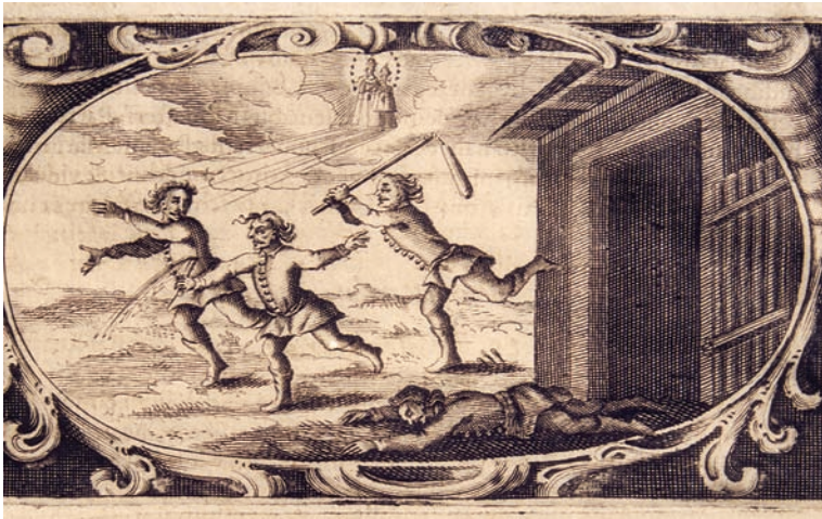
10. Čudo sa smrtno ranjenim Tomom Krajnickim iz 1659., bakrorez u: A. Eggerer, Pharmacopœa coelestis (1672.). Kloštar-Ivanić, franjevački samostan.

The Miracle with Deadly Wounded Toma Krajnicki from 1659, coppperplate engraving in: A. Eggerer, Pharmacopœa coelestis (1672). Kloštar-Ivanić, Franciscan monastery.