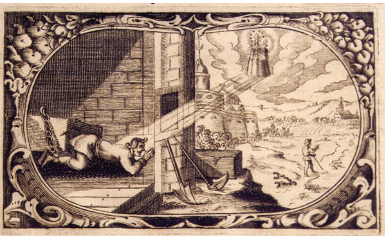
8. Čudo s kršćanskim vojnikom koji se oslobodio turskoga ropstva iz 1636., bakrorez u: A. Eggerer, Pharmacopœa coelestis (1672.). Kloštar-Ivanić, franjevački samostan.

The Miracle with a Christian Soldier who was Liberated from Turkish Captivity in 1636, copperplate engraving in: A. Eggerer, Pharmacopœa coelestis (1672). Kloštar-Ivanić, Franciscan monastery