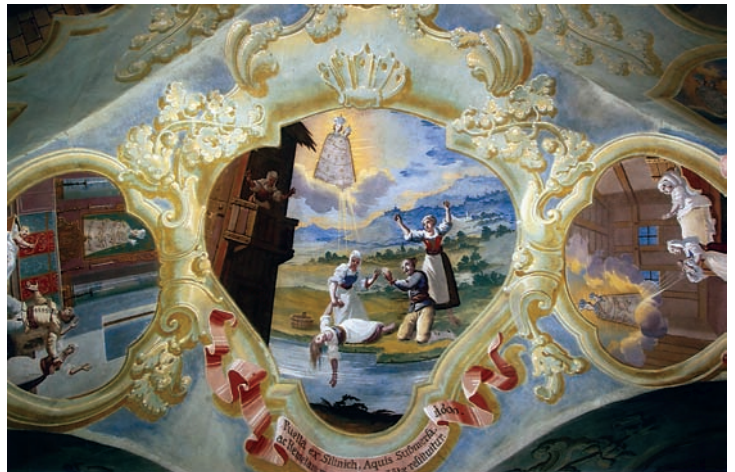
7. Ivan Krstitelj Ranger, Čudo sa spašenom utopljenicom iz 1600., zidna slika, Remete, 1747.

Ivan Krstitelj Ranger, The Miracle with a Woman Saved from Drowning from 1600, mural painting, Remete, 1747