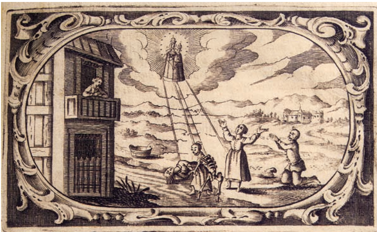
6. Čudo sa spašenom utopljenicom iz 1600., bakrorez u: A. Eggerer, Pharmacopœa coelestis (1672.). Kloštar-Ivanić, franjevački samostan

The Miracle with a Woman Saved from Drowning from 1600, copperplate engraving in: A. Eggerer, Pharmacopœa coelestis (1672.). Kloštar-Ivanić, Franciscan monastery