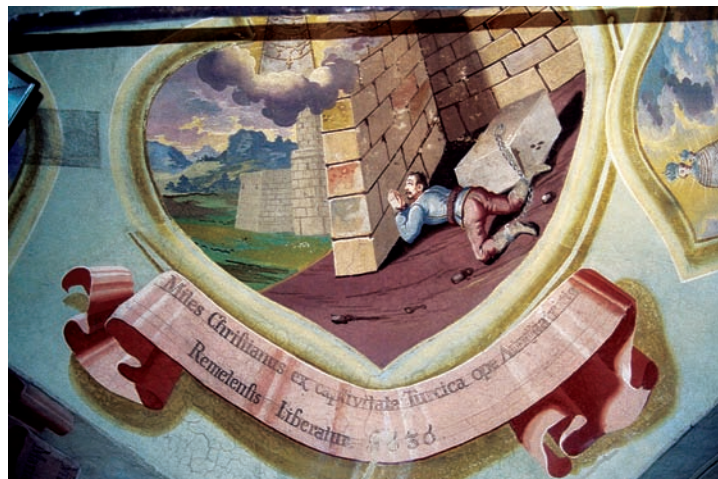
9. Ivan Krstitelj Ranger, Čudo s kršćanskim vojnikom koji se oslobodio turskoga ropstva iz 1636., zidna slika, Remete, 1747. Ivan Krstitelj Ranger, The Miracle with a Christian Soldier who was Liberated from Turkish Captivity in 1636, mural painting, Remete, 1747

The Miracle with a Christian Soldier who was Liberated from Turkish Captivity in 1636, copperplate engraving in: A. Eggerer, Pharmacopœa coelestis (1672). Kloštar-Ivanić, Franciscan monastery