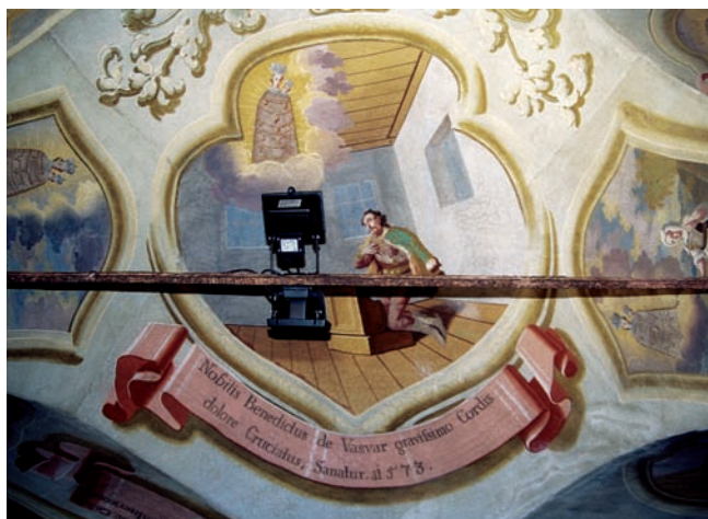
4. Ivan Krstitelj Ranger, Čudo s plemićem Benediktom iz Vasvára iz 1573. , zidna slika, Remete, 1747.

Ivan Krstitelj Ranger, The Miracle with Nobleman Benedict from Vasvár from 1573, mural painting, Remete, 1747