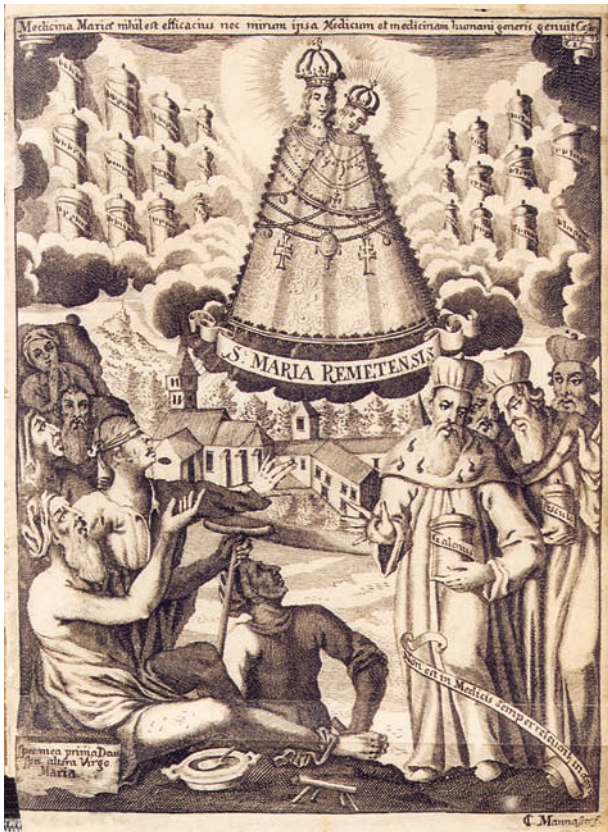
2. Johann Caspar Mannasser, Alegorijski prikaz Marijina hodočasničkoga svetišta u Remetama , naslovni bakrorez u: A. Eggerer, Pharmacopœa coelestis (1672.)

Johann Caspar Mannasser, Allegory of the pilgrimage site of Virgin Mary at Remete , title engraving in: A. Eggerer, Pharmacopœa coelestis (1672)