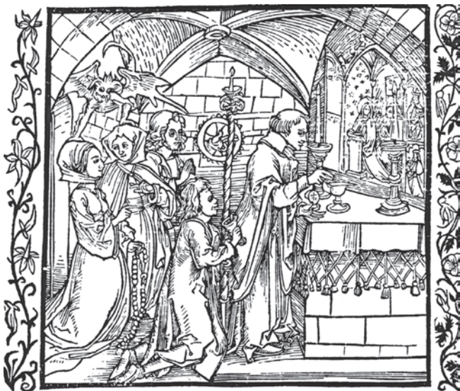
16. Albrecht Dürer, Žene koje razgovaraju pod misom napastuje zloduh, drvorez u: Der Ritter von Turn, 1493.

Albrecht Dürer, Women Talking during the Mass are Assaulted by an Evil Spirit, woodcut in: Der Ritter von Turn, 1493