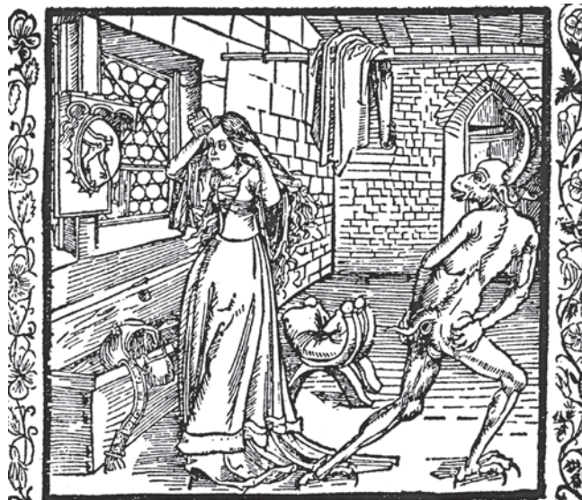
17. Albrecht Dürer, Tašta žena, drvorez u: Der Ritter von Turn, 1493.

Albrecht Dürer, Women Talking during the Mass are Assaulted by an Evil Spirit, woodcut in: Der Ritter von Turn, 1493