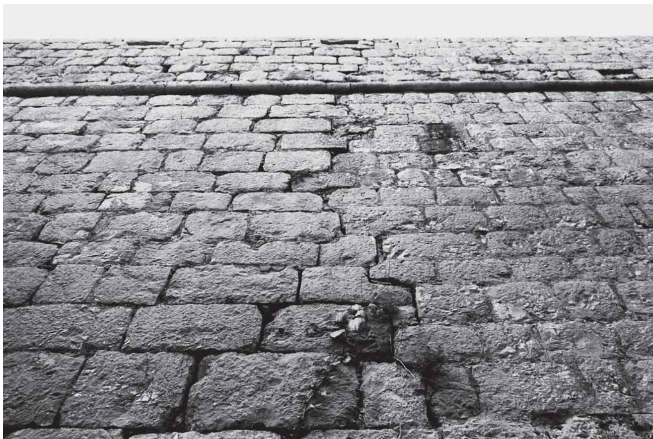
9. Spoj novije kurtine (lijevo) i prvotnog bastiona 9. Join between new curtain wall (left) and the original bastion

nastojale nadoknaditi slabosti proizašle iz temeljnih konceptijskih odluka. Mislimo primjerice na izoliranje prvotnog bastiona povišenim ulazom, a kasnije na vrlo skromnu visinu koju je dosegla sjeverozapadna kurtina. Ona je bila logična i nužna kako bi topovima s istočnog bastiona bio otvoren prostor za nadzor u tom smjeru, prema moru odnosno Lopudskim vratima. I u cjelini uzevši, manja visina onih dijelova utvrde koji su unutar ograđenoga vrtnog prostora, a izgrađivanje viših »vanjskih« poteza, posve izloženih neprijatelju, također je racionalan postupak kojim graditelji utvrde reagiraju na zatečene okolnosti i donekle im se prilagođavaju. Spomenimo usput i mnogobrojne sićušne strijelnice na prvotnom, istočnom bastionu, o kojima je gore već bilo govora; takvim strijelnicama, što se inače susreću tek na skromnim utvrđenim građevinama ruralnog prostora, Lopudani su ovdje posve neortodoksno opremili bastion, na stranama s kojih su se pribojavali neprijateljskog približavanja. Naša utvrda, prema tome, snažno pokazuje pripadnost vremenu svoga nastanka, a istodobno je izvedena u skladu s potrebama i mogućnostima lokalne sredine.