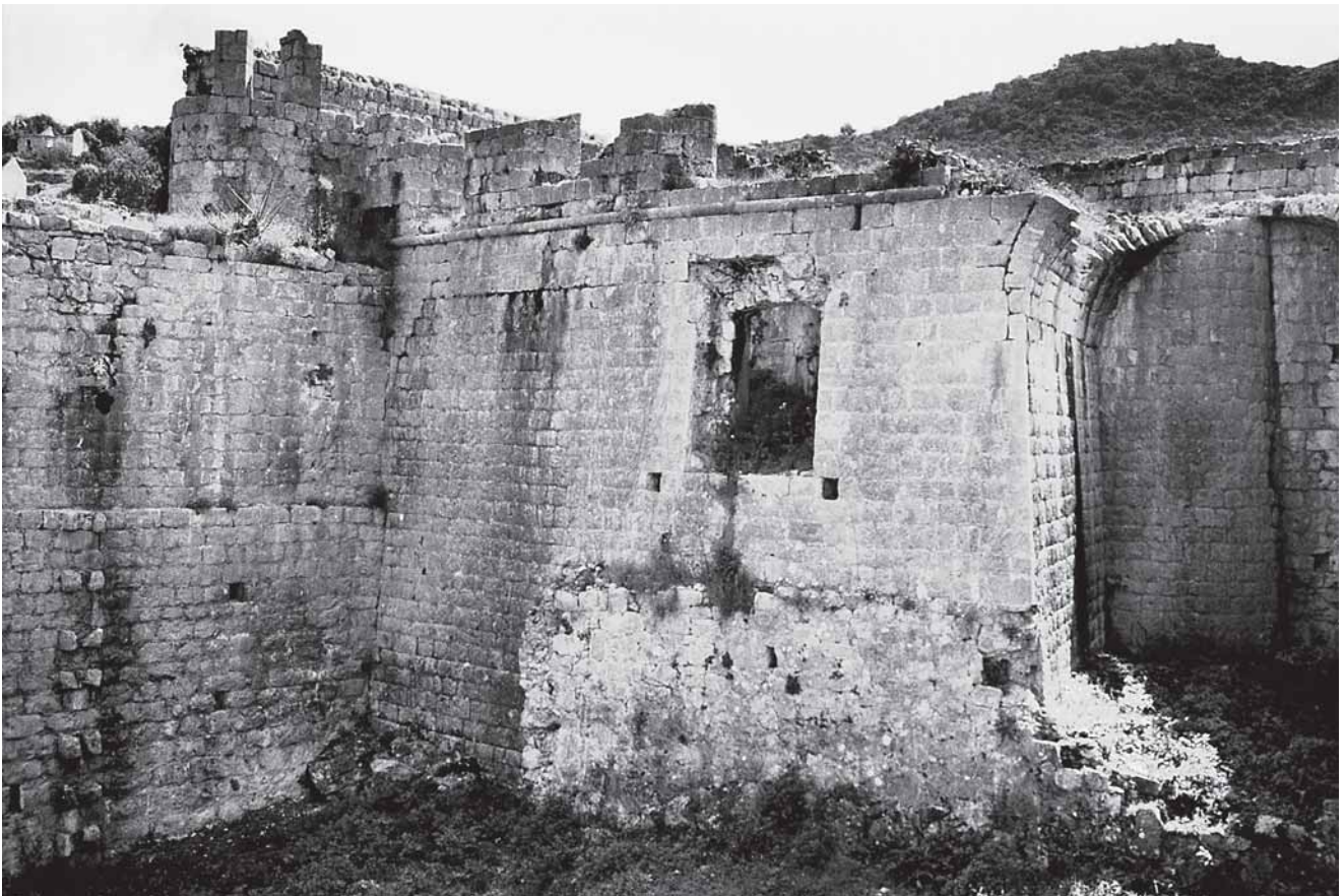
10. Prvotni bastion, pogled sa zapada 10. The original bastion, view from the west