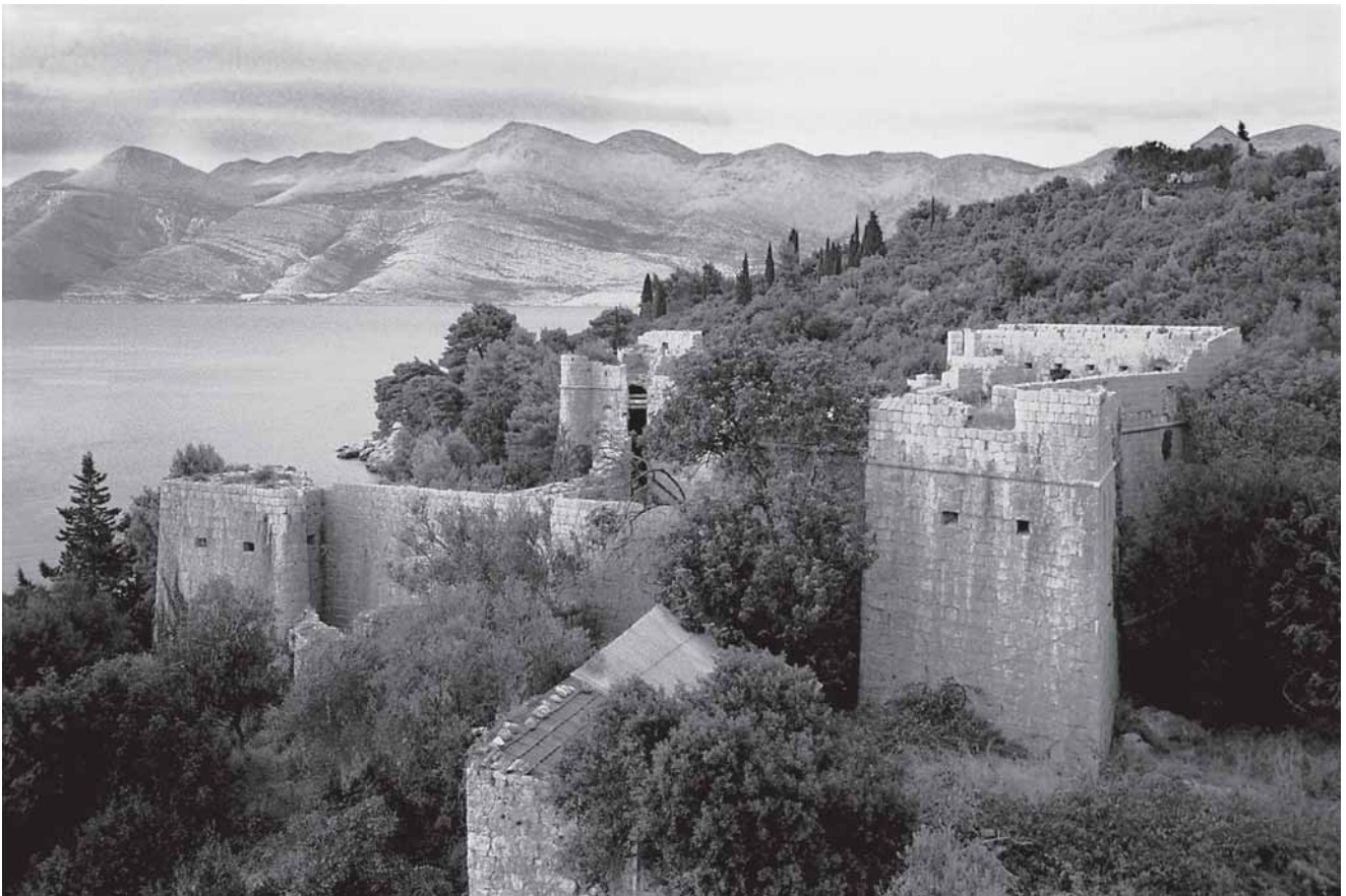
3. Utvrda, pogled sa zvonika (2001.)