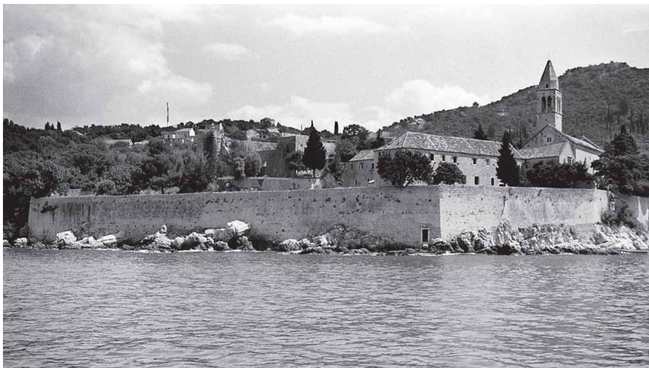
1. Lopud, kompleks franjevačkog samostana

1. Lopud, the Franciscan monastic complex