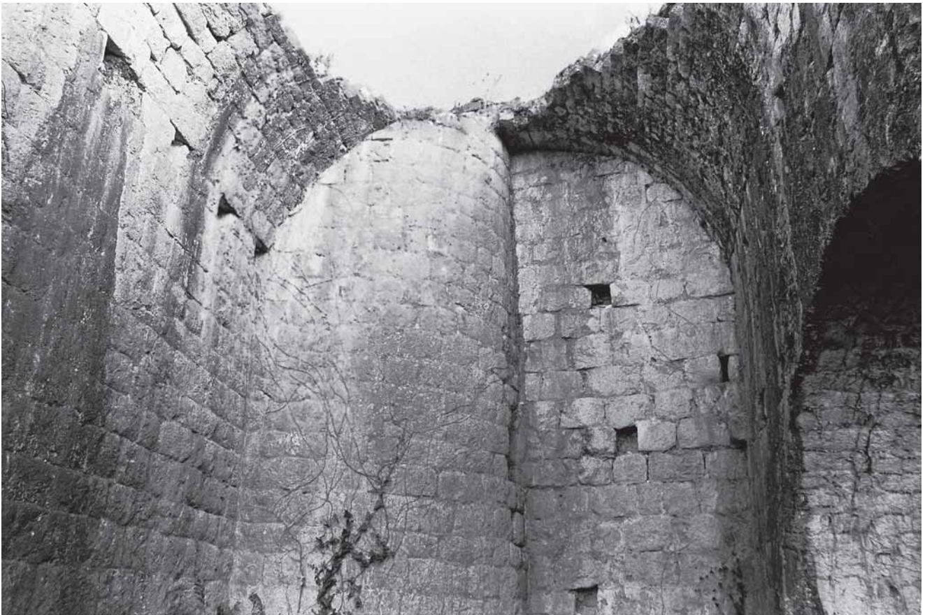
8. Južno uho prvotnog bastiona (2001.) 8. Southern orillon of the original bastion

»Pješčane nasipe« nesumnjivo valja shvatiti kao zasipavanje šupljega, praznog prostora (terrapieno), kao mjeru da se zidna struktura učini otpornijom na udarce projektila. 22 Čini se, prema tome, da je Matej Martini na Lopudu predlagao onakav zahvat kakav će uskoro, vidjeli smo, provesti i u Dubrovniku. Teško je, međutim, identificirati koje je mjesto u lopudskoj utvrdi imalo dobiti takav nasip; posve je moguće da se opisani zahvat ticao prvotnog, istočnog bastiona i reorganizacije njegove unutrašnjosti.