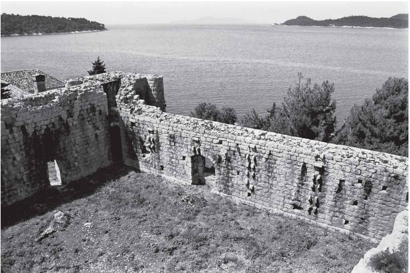
4. Zapadni bastion, jugozapadna i sjeverozapadna kurtina 4. Western bastion, SW and NW curtain wall

ogradnog zida koji je novi bastion iskoristio integrirajući ga u svoje zide. Dalje prema jugozapadu nekadašnji je ogradni zid uglavnom razgrađen, no moguće ga je ipak pratiti u njegovoj donjoj zoni. Nailazeći na jugozapadnu kurtinu naznačuje mjesto odakle se, ponovno u svojoj punoj visini i funkciji, nastavlja južno od današnje utvrde i spušta prema samostanu.