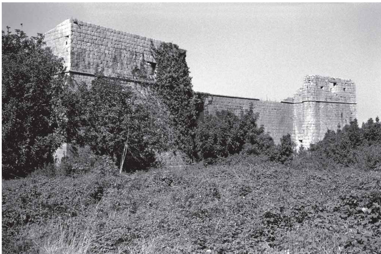
5. Sjeveroistočna strana utvrde