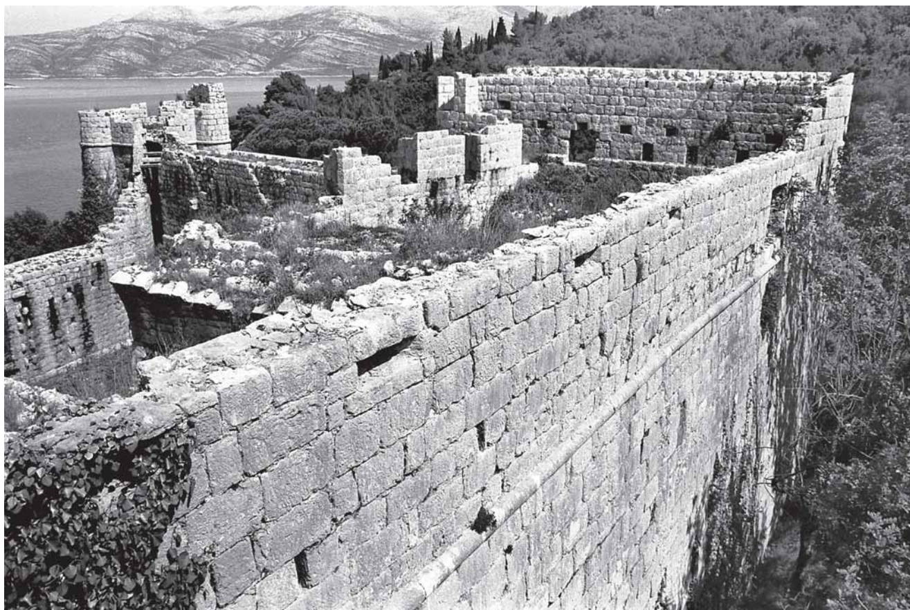
7. Jugoistočna strana utvrde 7. SE side of the fort

deno neobično precizno. Naime, kako bi bilo postignuto što bolje vezanje, dio je uha demontiran, a novi zid integriran u strukturu bastiona. Stoga je, posebice s unutarnje, dvorišne strane, teško razlučiti koji je zid stariji, a koji noviji. Gotovo još pažljivije izveden je spoj s vanjske strane; granicu dviju struktura na prvi je pogled teško zamijetiti jer je zid dobro povezan, a kordonski vijenac besprijekorno nastavljen. No u cjelini je novije zide ipak manje pomno zidano i fugirano, te redovi kvadara visinom ne odgovaraju starijim redovima. Nad vijencem pak zbilja se također znakovita promjena: bastion u toj zoni ima već spomenute malene strijelnice što se prema van sužavaju, dok je noviji zid opremljen drukčijim tipom strijelnica s proširenjem s vanjske strane. 17 Tako postaje posve jasan način nadovezivanja i povezivanja nove kurtine s uhom bastiona. Na dvorišnoj je strani pak pomno izvedeno i oslanjanje prvoga svoda na bastion: potrebni su dijelovi bastiona odnosno redovi kvadara demontirani kako bi peta svoda dobila svoje mjesto, a podjednako je tako načinjeno i ležište za luk svoda na bastionskom uhu . Kvalitetno povezivanje očigledno je bilo poticano potrebom za sigurnošću i solidnošću s obzirom na namjenu građevine, a bilo je izvedivo u sredini stoljetne kamenarske tradicije. Na drugo pak uho sjeveroistočna kurtina nije morala biti u tolikoj mjeri pomno vezana jer je njihov spoj djelomice uvučen i utoliko manje izložen na vanjskoj strani.