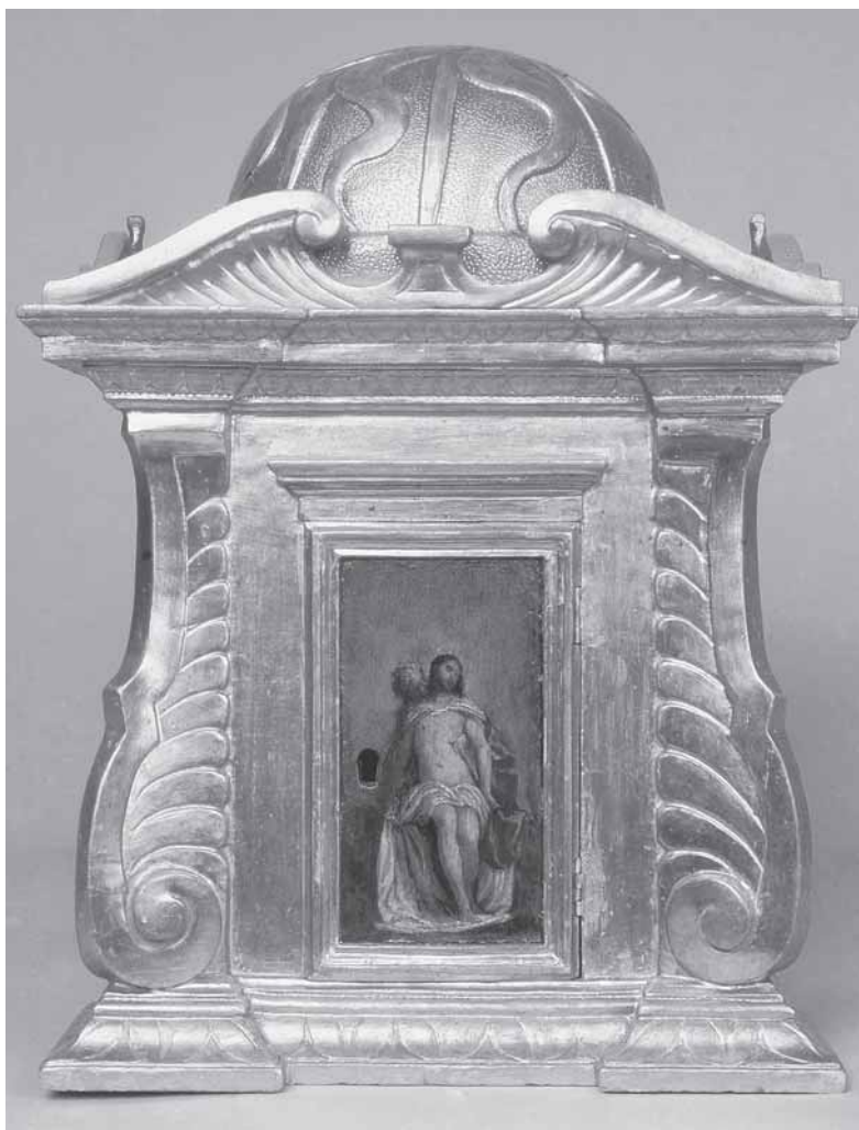
Svetohranište poliptiha P. Veronesea, pozlaćeno i obojeno drvo, 56,5 x 42 x 33 cm, Vrboska, župna crkva

Tabernacle of P. Veronese polyptych, painted and gilt wood, 56,5 x 42 x 33 cm, Vrboska, Parish Church