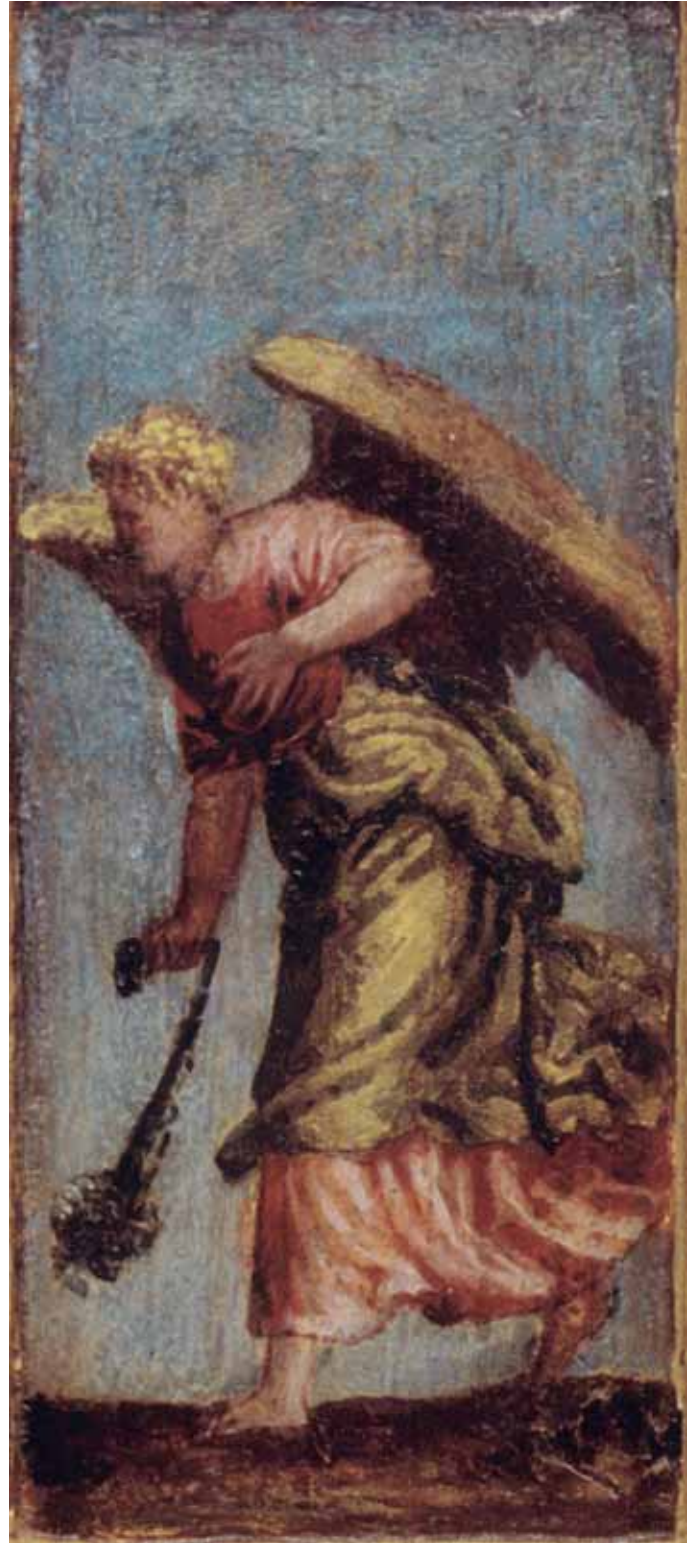
Radionica P. Veronesea, Anđeo s kandilom , ulje na dasci, 20,3 x 8,4 cm, svetohranište poliptiha, Vrboska, župna crkva Workshop of P. Veronese, Angel with Censor, oil on panel, 20,3 x 8,4 cm, tabernacle of the polyptych, Vrboska, Parish Church