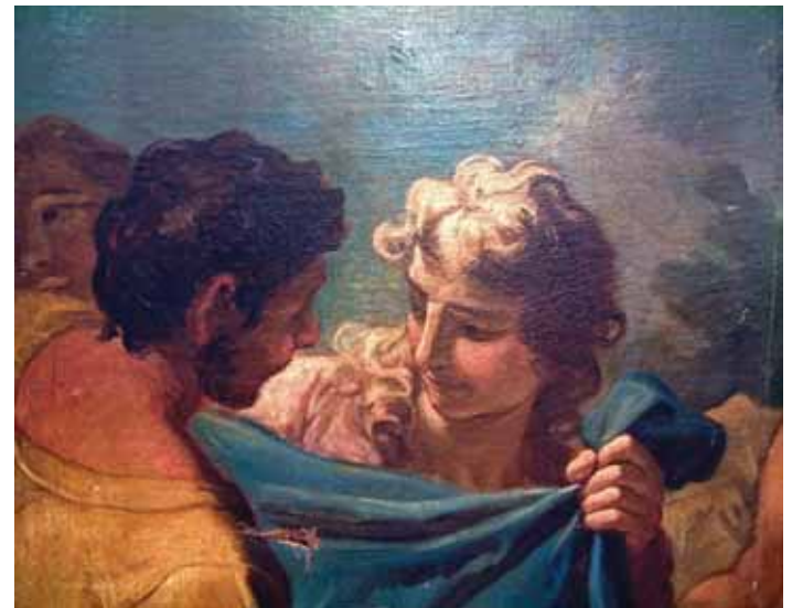
Girolamo Brusaferra, Noah's Drunkenness, detail, private collection