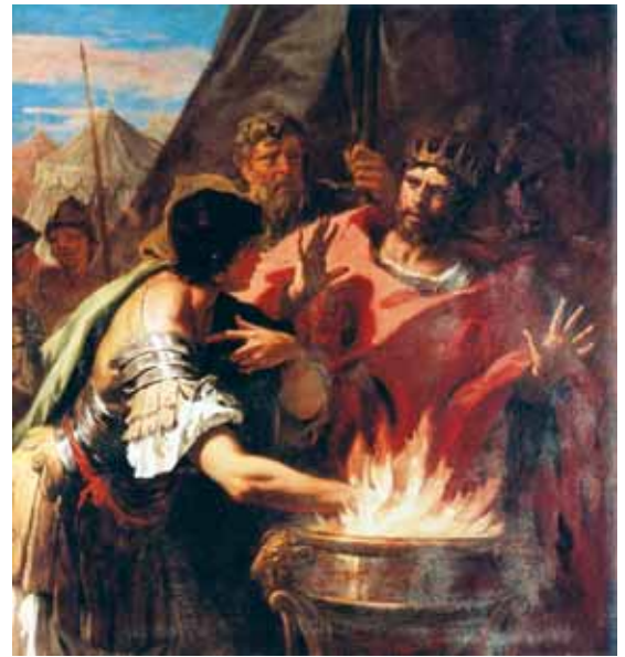
Sebastiano Ricci, Mucije Scevola , Galleria Nazionale, Parma Sebastiano Ricci, Mucius Scaevola, Galleria Nazionale, Parma

cijevih kompozicija, poput anđela koji drži evanđelje sv. Marka u prizoru Sv. Ambrozije i sv. Augustin sa sv. Markom i sv. Lukom ili anđela što okružuju Bogorodicu na Krunjenju Bogorodice iz Roncadea otvorili su put povezivanja Girolama Brusaferra s još jednom, dosad neobjavljenom slikom iz privatne zbirke u Zagrebu: Abraham žrtvuje Izaka .