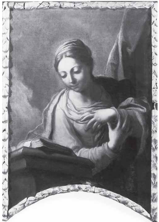
Girolamo Brusaferra, Bogorodica od Navještenja , crkva Ospedaletto, Venecija

Girolamo Brusaferra , Archangel Gabriel, Church of Ospedaletto, Venice