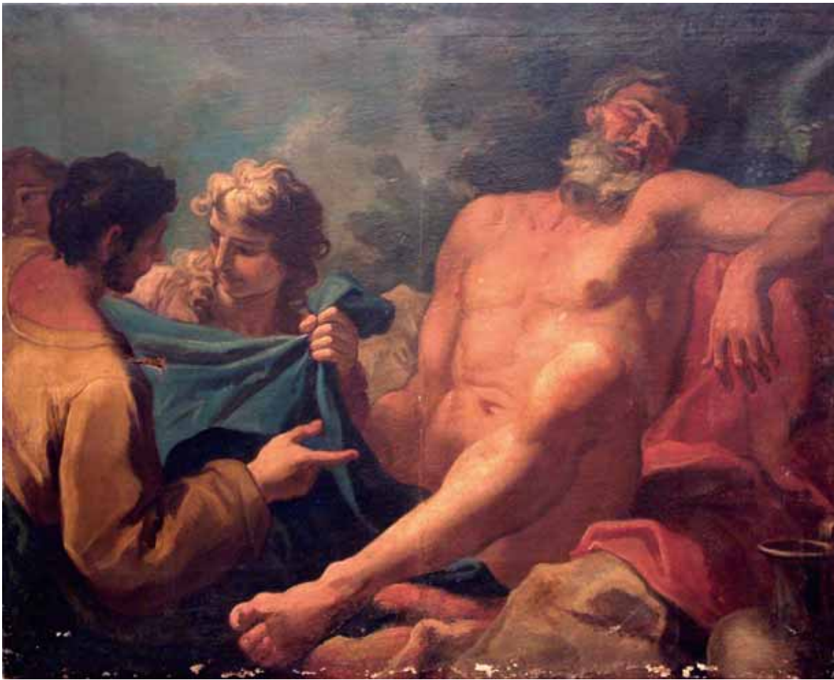
Girolamo Brusaferra, Noino pijanstvo , privatna zbirka Girolamo Brusaferra, Noah's Drunkenness, private collection

nutost, geste i izrazi lica nadovezuju se na tradiciju kasnog venecijanskog seicenta , odajući neposrednije veze s radovima Nicole Bambinija i ranog Sebastiana Riccija. 14 Patetični izraz i pokreti Eve u bijegu analogni su brojnim Bambinijevim ženskim figurama u dramatičnim prizorima poput slike Apolon i Dijana ubijaju Niobinu djecu iz privatne zbirke u Bresci, 15 ali istim govorom tijela koristi se i Ricci u Otmici Sabinjanki iz 1696. u palači Barbaro Curtis u Veneciji. 16 Likovna obilježja Izgon iz raja i Noina pijanstva odaju utjecaje obaju majstora i potvrđuju Zanettijevo zapažanje o slikarevom napuštanju Bambinijevog načina i naporu da se približi dekorativnijem jeziku Sebastiana Riccija. Oblikovanje i fizionomija pijanog Noe identični su staračkoj figuri Lota u sceni Lotova pijanstva iz privatne zbirke, 17 na kojoj Brusaferra varira istoimenu Bambinijevu kompoziciju iz palače Barbaro Curtis, datiranu prije 1699. 18 U oblikovanju Noinih sinova i Adama zamjećujemo pak neposrednije oslanjanje na tipologiju Riccijevih djela s prijelaza stoljeća i iz prvih godina settecenta . Zgrčeno Adamovo tijelo s izraženom grimasom straha inspirirano je alegorijskim figurama Noći koje se povlače pred Zorom na istoimenoj kompoziciji stropne dekoracije iz palače Querini Stampaglia (1700.–1704.). 19 Brusaferra se nizom oblikovnih detalja oslanja i na Riccijev ciklus iz Ospedale degli