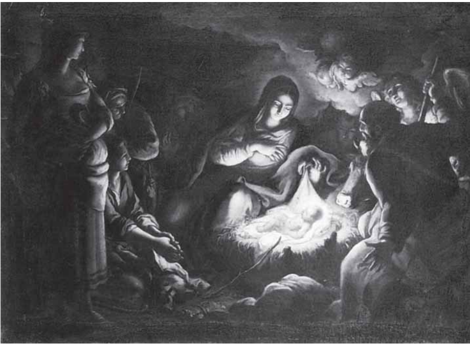
Girolamo Brusaferra, Poklonstvo pastira , Museo civico, Padova Girolamo Brusaferra, Adoration of the Shepherds, Museo civico, Padova