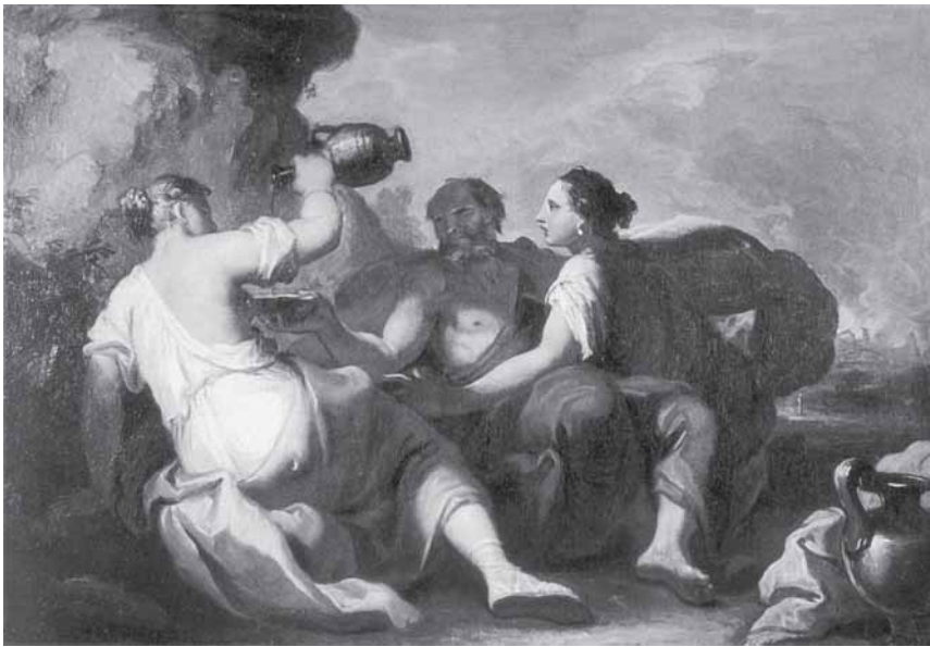
Girolamo Brusaferra, Lotovo pijanstvo , privatna zbirka Girolamo Brusaferra, Lott's Drunkenness, private collection