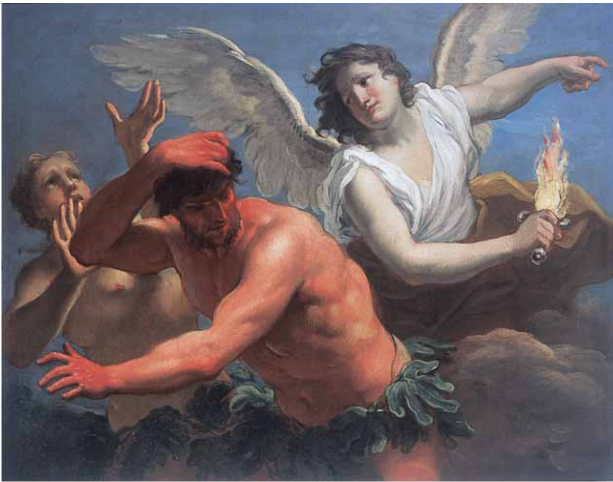
Girolamo Brusaferra, Izgon iz raja , Dubrovački muzej Knežev dvor, Dubrovnik Girolamo Brusaferra, Expulsion from Paradise , Dubrovnik Museum, Rector's Palace, Dubrovnik

naručitelje na području Padove i Trevisa. O tome svjedoči dokument upućen magistraturi Milizije da Mar, prema kojem je s nekolicinom slikara morao privremeno otići iz Venecije zbog oskudnog broja narudžbi i nemogućnosti plaćanja poreza. 7 Najočitiije je Brusaferrino ugledanje na Riccijeve radove iz prvih godina 18. stoljeća, koji označavaju prijelaz od kasnobaroknog prema rokoko likovnom izričaju, poput slika za crkvu S. Marziale ili dekoracije palače Mocenigo Robilant u Veneciji, dekoracije svoda kapele sv. Sakramenta u crkvi S. Giustina u Padovi, slika iz Ospedale degli Esposti u Parmi ili dekoracije palače Marucelli Fenzi u Firenci. 8 Posežući za novim slikarskim rješenjima, Brusaferra nastoji usvojiti novu ulogu svjetla i boje, oponašajući pritom i Riccijevu tipologiju figura naglašene pokrenutosti i izražajnosti. Zbog toga neki autori pretpostavljaju Brusaferrin boravak i suradnju u majstorovoj radionici u prvim godinama settecenta , svakako prije Riccijevog odlaska u Englesku 1712. godine. 9 Ana Pietropolli drži, međutim, da je Brusaferra Riccijevim sljedbenikom u pravom smislu riječi postao tek nakon odlaska iz Venecije 1713. godine. Autorica nalazi da se najbliže veze među dvojicom slikara mogu iščitati u Brusaferrinim radovima iz Padove, odnosno na zidnim dekoracijama za vilu Valier Loredan i vilu Maffetti na području Trevisa. 10 Ipak, još je uvijek premalo