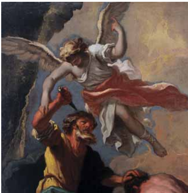
Girolamo Brusaferra – Antonio Marini, Abraham žrtvuje Izaka , detalj, privatna zbirka, Zagreb

Girolamo Brusaferra – Antonio Marini, Abraham Sacrificing Isaac, detail, private collection, Zagreb