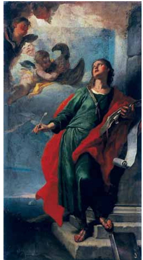
Girolamo Brusaferra, sv. Ivan Evanđelist, crkva sv. Križa, Čiovo Girolamo Brusaferra, St John the Evangelist, Holy Cross Church, Čiovo

delle opere pubbliche dei Veneziani maestri, Libri V, 2. izdanje, Venezia, 1792., 562.