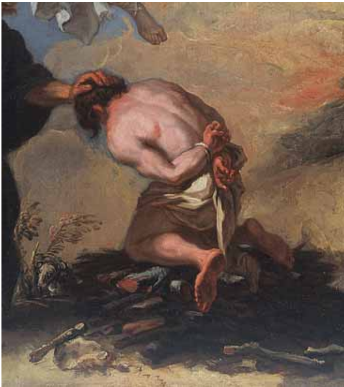
Girolamo Brusaferra – Antonio Marini, Abraham žrtvuje Izaka , detalj, privatna zbirka, Zagreb Girolamo Brusaferra – Antonio Marini, Abraham Sacrificing Isaac , detail, private collection, Zagreb