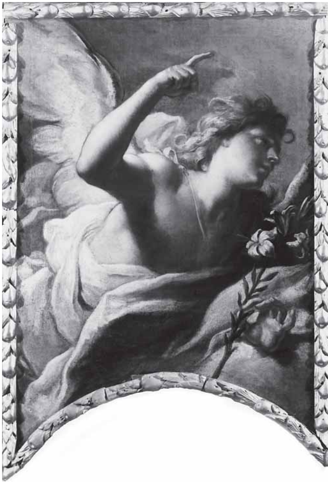
Girolamo Brusaferra, Andeo Gabrijel , crkva Ospedaletto, Venecija

Girolamo Brusaferra , Archangel Gabriel, Church of Ospedaletto, Venice