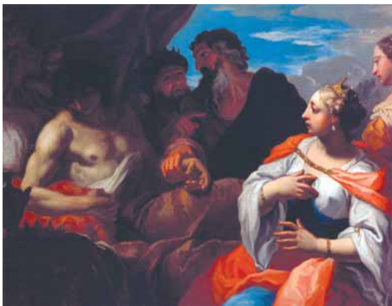
Girolamo Brusaferra, Antioha posjećuju liječnici , Galleria Nazionale, Parma

Girolamo Brusaferra , Physicians Visit Antiochus, Galleria Nazionale, Parma