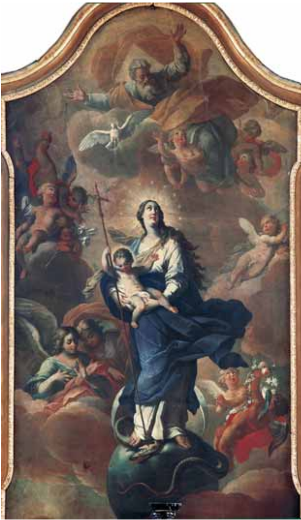
Anton Herzog, Bezgrešna Bogorodica (Marija Pobjednica) , 1737., Valpovo, župna crkva Bezgrešnoga začeća Bl. Dj. Marije, glavni oltar

Anton Herzog, Immaculate Conception (Mary Triumphant) , 1737, Valpovo, high altar