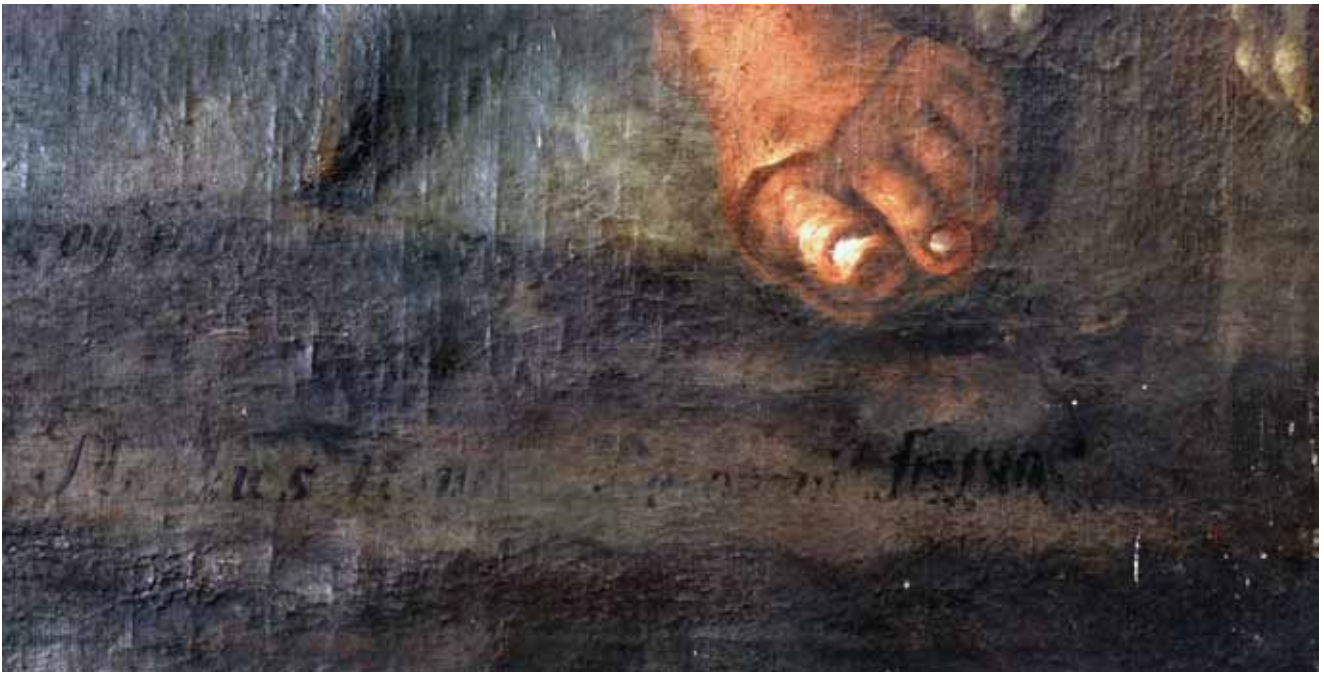
Sveci zaštitnici od kuge , Vukovar, kapela sv. Roka, detalj s potpisom Saints Protectors against the Plague, Vukovar, Chapel of St Rochus, detail, with signature

nutih svjetlijim rubovima. Okruglasti oblaci omekšani su drhturavom strukturom površine slikane u tonovima sive boje na način blizak Zanussijevu (1679.–1742.), 23 dok je dojm-ljiva svjetlosna dinamika cjelokupnog prizora, istaknutija negoli je to slučaj na ostalim Herzegovim slikama, bliska Trogerovoj izražajnosti, što vukovarsku sliku svrstava među Herzogova najkvalitetnija djela.