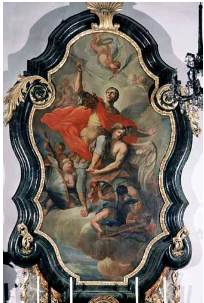
Anton Herzog, Sv. Sebastijan , 1739., Großstelzendorf, župna crkva sv. Andrije, desni bočni oltar Anton Herzog, St Sebastian , 1739., Großstelzendorf, Parish Church of St Andrew, right side altar

»komentiraju« pogibiju zmiје, dok su skupine i samostalne figure bucmastih putta izvedene rutinski i oslanjaju se na znanje stečeno za vrijeme autorova školovanja na Bečkoj likovnoj akademiji. Kolorit je prigušen slojem patine i u odnosu na izvornu gamu tonova donekle izmijenjen. Odčitavaju se ipak njegove temeljne kromatske vrijednosti: topli zlatni oker u širokome rasponu tonova, sivoplave nijanse, koje kulminiraju u plavilu Marijina plašta, te sporadični naglasci cinoberno-crvene boje na draperiji kojom su obavijena punašna tijela anđela i obasjani dijelovi njihova blijedog inkarnata.