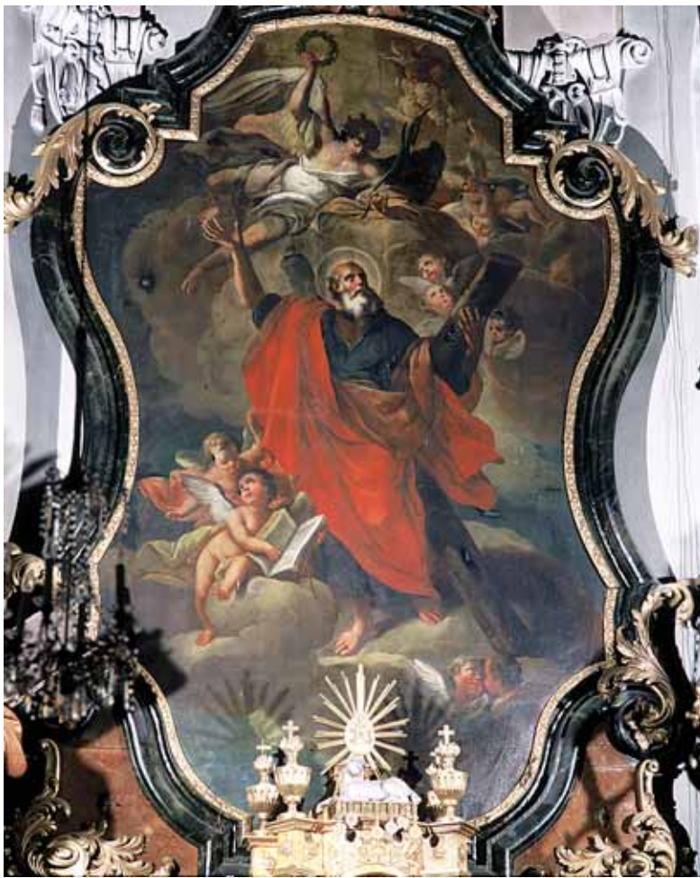
Anton Herzog, Sv. Andrija u nebeskoj slavi , 1737.–1739., Großstelzendorf, župna crkva sv. Andrije, glavni oltar, (foto: M. Braun) Anton Herzog, St Andrew in Heavenly Glory , 1737–1739., Großstelzendorf, Parish Church of St Andrew, high altar