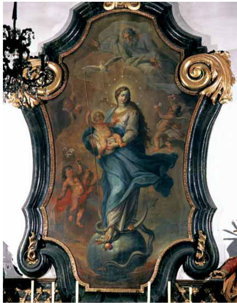
Anton Herzog, Marija pobjednica , 1739., NÖ, Großstelzendorf kod Göllersdorfa, župna crkva sv. Andrije, lijevi bočni oltar

Anton Herzog, Immaculate Conception (Mary Triumphant) , 1737, Valpovo, high altar