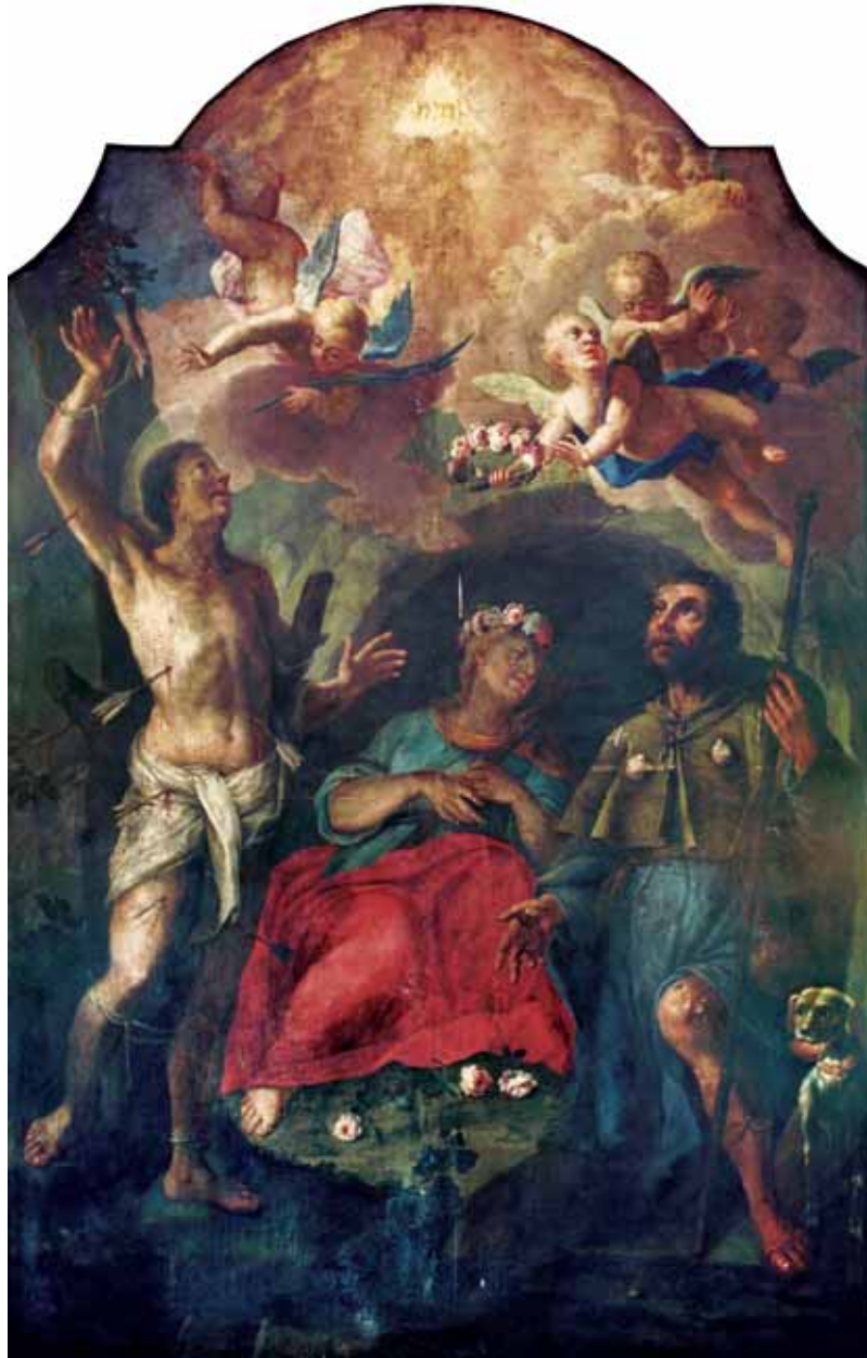
Anton Herzog, Sveci zaštitnici od kuge , 1735., Vukovar, kapela sv. Roka

Anton Herzog, Saints Protectors against the Plague, 1735, Vukovar, Chapel of St Rochus