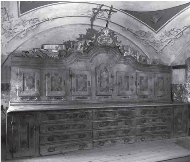
Trški Vrh, crkva Majke Božje Jeruzalemske. Ormar u sakristiji, 1756. Trški Vrh, Holy Virgin of Jerusalem, the sacristy closet, 1756