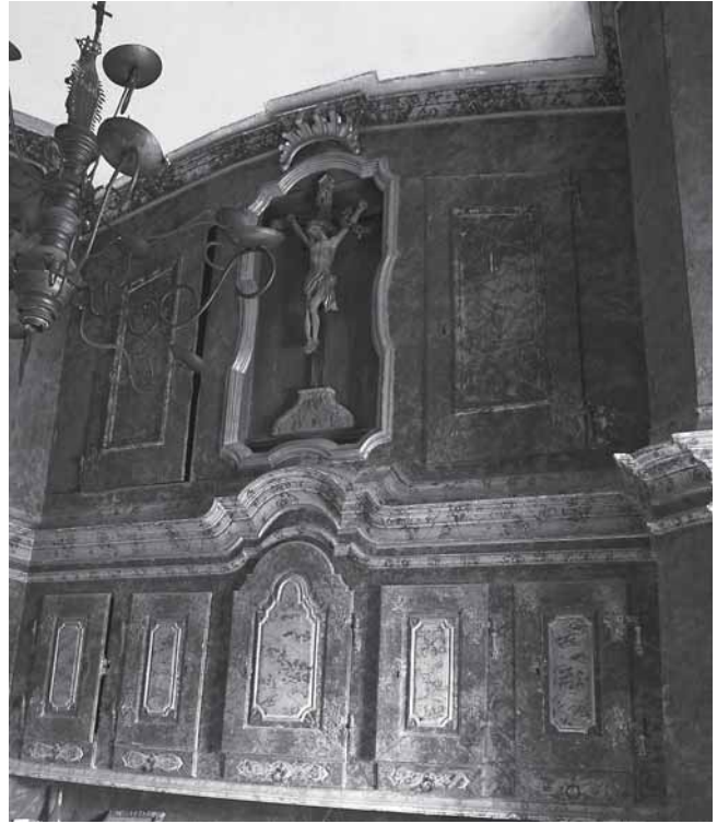
Trški Vrh, crkva Majke Božje Jeruzalemske. Detalj ormara na oratoriju

Kod crkvenih kao i kod profanih ormara istog podneblja u osnovi se iz tehničkih razloga pristupilo polikromiji, marmorizaciji i oslikavanju. Naime, u tim zemljama namještaj se izrađivao od mekog jelova drva, koje nije bilo pogodno za rafiniraniju stolarsku obradu, te se oslikom prikivala jednostavnija obrada drveta. S vremenom se sve više pažnje