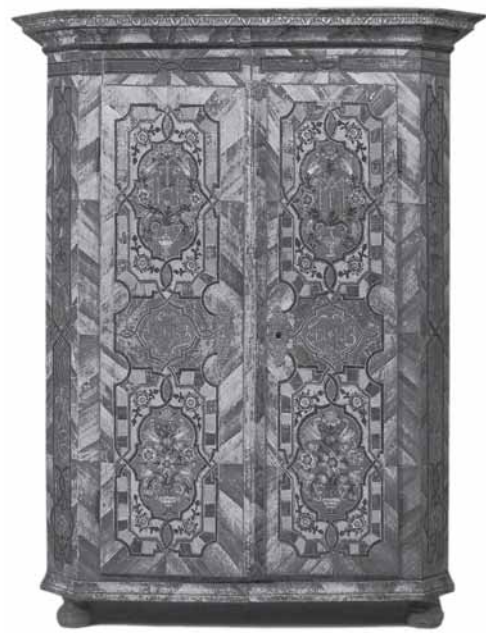
Ormar, oko 1800. (H. Nemeč, Alpenlandische Bauernkunst) Wardrobe, around 1800 (H. Nemeč, Alpenlandische Bauernkunst)

golemi korpus ugrađen je u zidnu plohu oratorija, koju prati gornjom i donjom obrisnom linijom. Konceptija gradbenog sklopa vrlo je zanimljiva. Središnji dio sastoji se od dvodijelnog ormara s visokom nadgradnjom do linije svoda. Flankiraju ga dva bočna u prostor istaknuta vertikalna korpusa, čija visina također dopire do svoda. Međusobno su svi spomenuti dijelovi spojeni u jednu cjelinu. Naglašena arhitektonika raščlambe oplošja ormara primjenom njezinih elemenata na osobito istaknut način ukazuje na tip ormara blizak tzv. fasadnom ormaru.