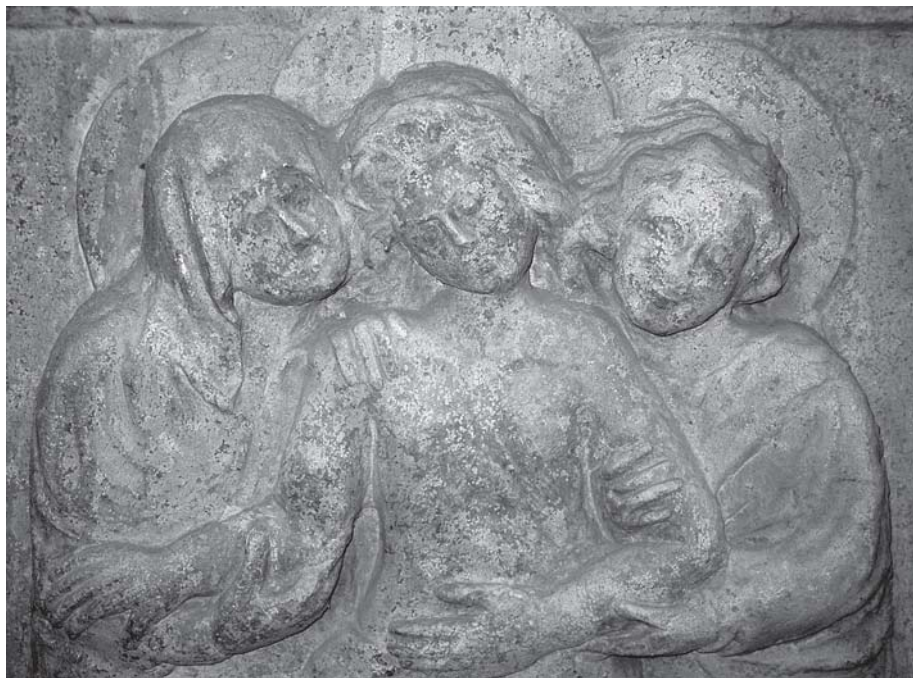
Pavao iz Sulmone, grobni spomenik biskupa de Cardinalibus, detalj (Senj, katedrala) Paolo da Sulmona, Tomb of bishop de Cardinalibus, detail, Senj, cathedral