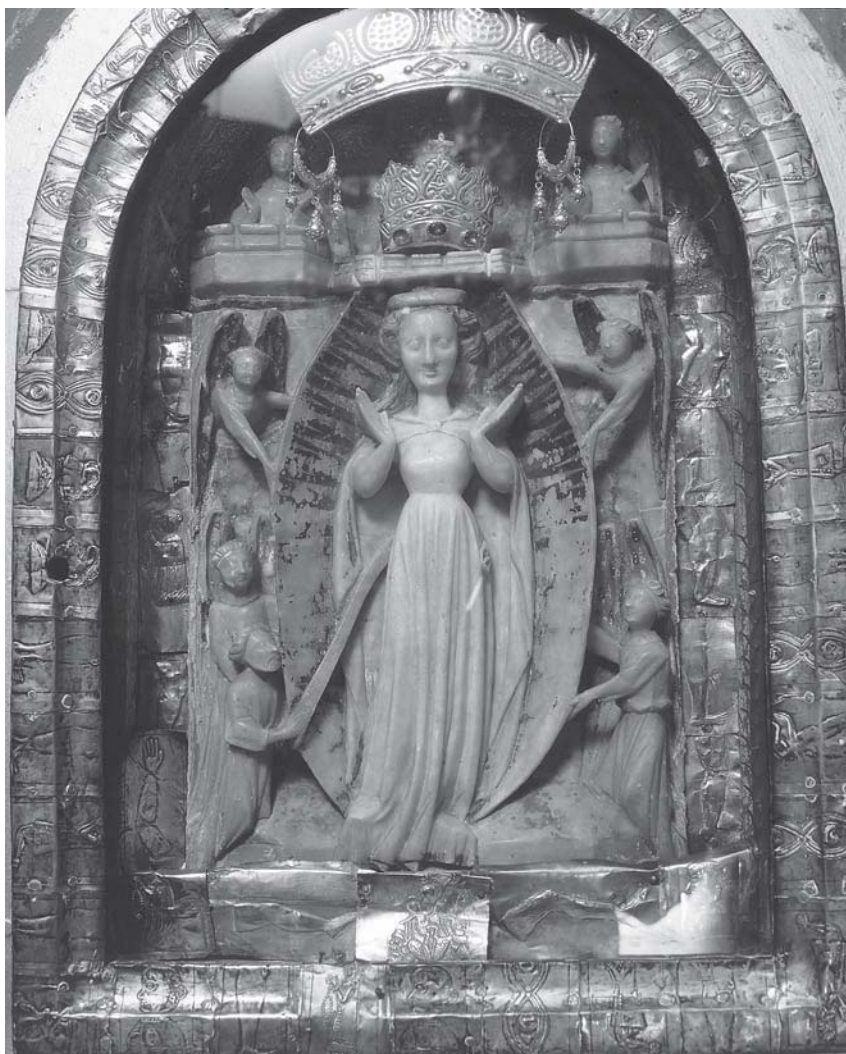
Čara, Crkva Gospe od Polja, središnji prikaz na oltaru Čara, church of Lady of the Field, central scene

sjevera u hrvatskim zemljama. 6 Spram mnogobrojnih tipološki posve srodnih u pogledu oblikovnih i tehničkih pojedinosti, nedvojbeno potvrđuje visoku razinu doradenosti, te mu je u danim standardima možda zanimljivije očitati ikonografske osobitosti. O tim se pitanjima inače pri obradi istovrsnih djela malo govorilo, budući da ona najbrojnija u Engleskoj razumljivo proizlaze iz tamošnjih vjerskih učenja i gledišta, pa sadržajno ne odskaču od uobičajenih normi, kao što su u nas izuzetna s obzirom na sve kakvoće koje nose. Njih pak prožima ista ona lirska poetika, gotovo idealističko ushićenje ili pročišćena ljepota što izvan mediteranskih stvaralačkih krugova općenito jače obilježava umijeće kasnosrednjovjekovnih kipara, koji u svojim traženjima navedenoga nadilaze realističke forme, te plastičke slike privode u gotovo natprirodne sfere. 7 U tom smislu i ovo ostvarenje sadrži iskustva s našim krajevima slabo srasle tzv. dvorske umjetnosti, podajući svemu prikazanome osobitu otmjenost i plemenitu istančanost, koje nisu samo prosječna manira budući da nalaze potporu pa i opravdanja u neposrednim tumačenjima prikladno izabranih sadržaja.