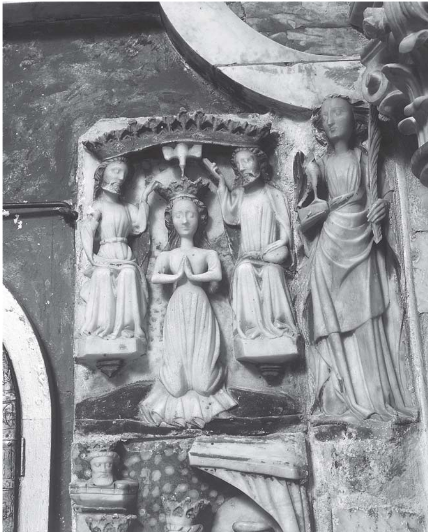
Čara, Crkva Gospe od Polja, Krunjenje Marijino i evanđelist Ivan Čara, church of Lady of the Field, the Crowning of Mary and St. John the Evangelist

dodjeliteljice milosti s uzdignutim rukama, raskrivši plašt unutar eliptoidne mandorle prema općepoznatoj shemi koja majku Spasitelja čini zaštitnicom svih kršćana. To je pak pučka imaginacija Čarana protumačila uzdizanjem Gospe iz lađice u Čavića luci, 23 ali prošaranost rečenog okvira vitke Gospe sa sunčevim zrakama jamči tematsku dosljednost prikazbe iz srednjega vijeka. U tom je smislu istoznačan i mali lik koji, kleknuvši zdesna i gledajući uvis, zateže Gospin pojas: točno kao što prema Zlatnoj legendi sv. Toma, pojavivši se među ostalim apostolima tek nakon Marijina pogreba, na sebi urođen način nije povjerovao u njezinu smrt prije negoli mu se Djevici na zemlji neodvojivi pojas našao u rukama padom iz nebeske visine. 24 Na reljefu, sukladno izvorniku kao i trajnom dogmatskom učenju, Gospu uznose četiri anđelka prihvaćajući mandorlu u parovima sa strana dok zalazi u nebo, predloženo poput čvrste kule, gdje je u osi kompozicije dočekuje Stvoritelj s dva anđela pobočnika, svi prikazani u poprsjima. Dapače je mandorla u dnu odignuta od tla a gore zalazi u poprsje okrunjenoga Boga Oca, koji okomitom osi spuštenim pogledom i raširenim rukama osna-