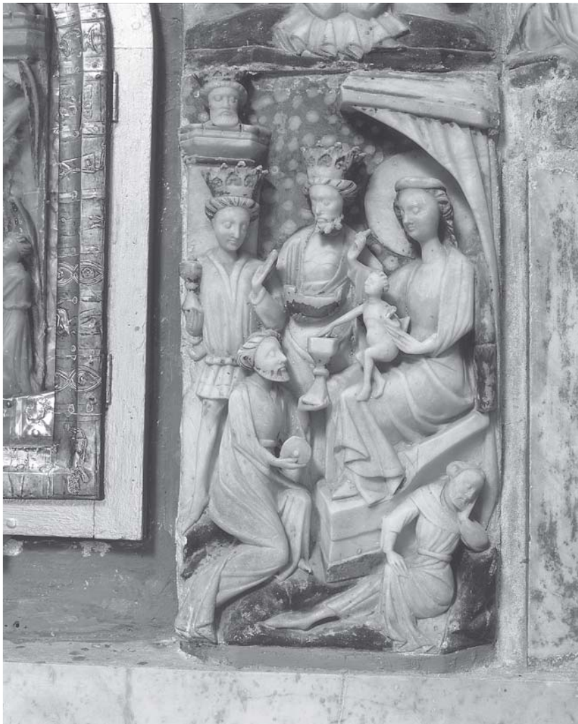
Čara, Crkva Gospe od Polja, Poklonstvo kraljeva Čara, church of Lady of the Field, Epiphany

oltaru pak uspostavljenom sredinom 18. stoljeća, 15 prizoru Uznesenja dano je središnje mjesto u skladu s činjenicom da se u Čari slavi Velika Gospa. Međutim, nije sigurno da izvorno to bijaše glavni prikaz budući da je Blažena Djevica dostigla punu slavu tek krunidbom na nebu, zgodimice praćenom Sv. Trojstvom, koje mu daje izvornu ideološku prednost. Obvezatni je pak prikaz krunjenja bočnom postavom ovdje zanemaren na račun predodžbe čuda kojim je glavna ličnost uznesena na nebeske prostore. Taj bi se poredak mogao objasniti isticanjem samog čuda pojave njezine slike na otoku iz navodno postradale lađe, 16 te je u baroknom poretku pojačana zaštitnička Gospina uloga nad izabranom sredinom dolaska. Nadasve u tom kontekstu središnji položaj slike Uznesenja otkriva naročite oblike lokalnog slavljenja jednog ikonografski davno zadanoga niza, koji se slijedom novouspostavljenog podređivanja osobitom unutrašnjem sadržaju čita kao knjiga izložena na oltaru.