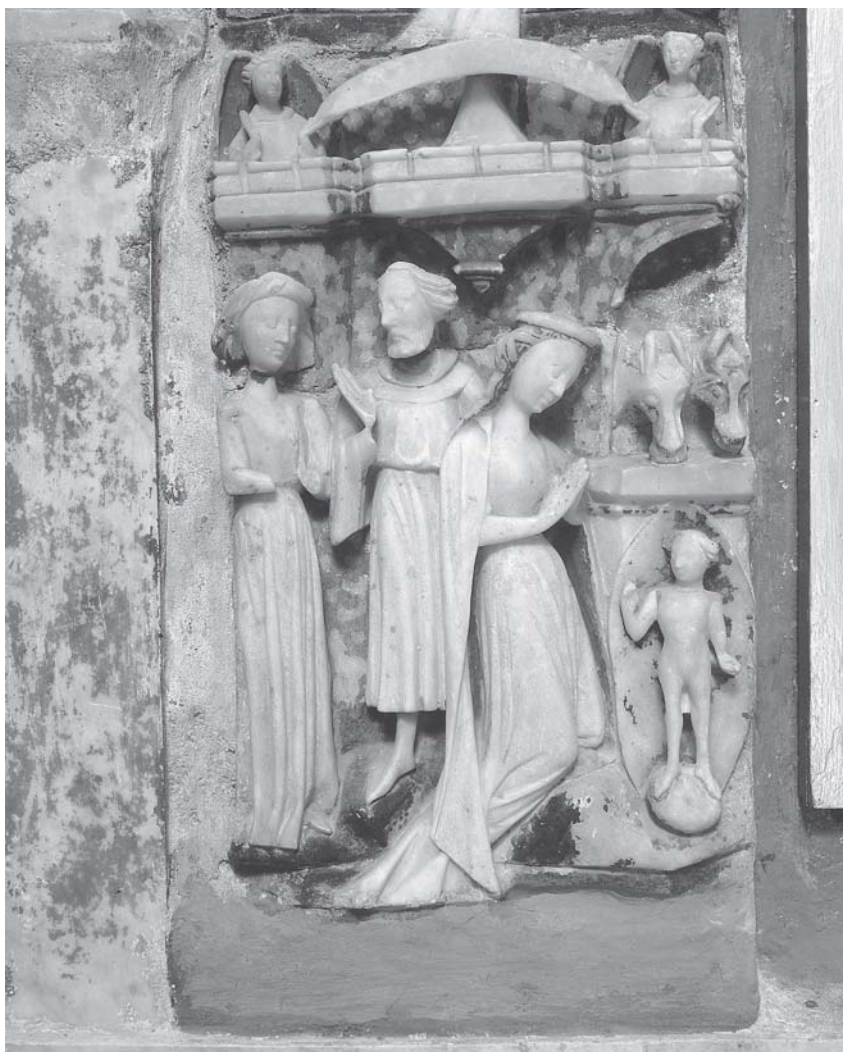
Čara, Crkva Gospe od Polja, Rođenje Kristovo Čara, church of Lady of the Field , Nativity

drugačije negoli povijesnim čudom. Ali je njegov vjerski sadržaj otpočetka bio lako shvatljiv, pače i više nego privlačan, pa ga valja sa svim osobitostima razložiti opširnije negoli bijaše prethodno učinjeno. 12