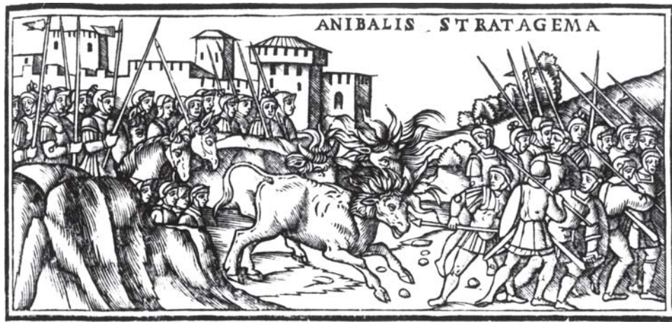
3. Zoan Andrea, Hanibalova ratna varka , drvorez (T. Liuius Patauinus historicus duobus libris auctus (...) ac imaginibus res gestas experimentibus <Venecija, Melchiore Sessa & Petrus de Ravanis, 1520>. Österreichische Nationalbibliothek, Beč, sign. BE.12.K.13.) 3. Zoan Andrea, Hannibal's war skinn, woodcut

kim idealima humanizma i obnove katoličke duhovnosti, sredinom 16. stoljeća svoj ljetnikovac na Šipanu daje oslikati likovima znamenitih ljudi i prigodnim »impresama«, a to mjesto učenosti i odmora u neoplatoničkom duhu naziva »Akademijom«. 8 Dakako, između Beccadellijeve i Fortezzi- ne koncepcije postoje znatne razlike, ali su im, barem u određenoj mjeri, zajedničke pedagoške intencije humanizma i svjetovnost ikonografije. Međutim, dok Becadelli poseže za modelom illustrium imagines , povezujući ga sa simboličkim, amblematskim prikazima, Fortezza na svojim radovima ostvaruje promišljen sustav exempla virtutis , kojem dodaje medaljonske portrete znamenitih osoba, careva, povjesničara, junakinja i junaka iz antičke starine. Oba obrasca potječu iz antičke duhovne baštine, oba su oživljena u doba humanizma, a njihovi se značenjski kompleksi uvelike preklapaju.