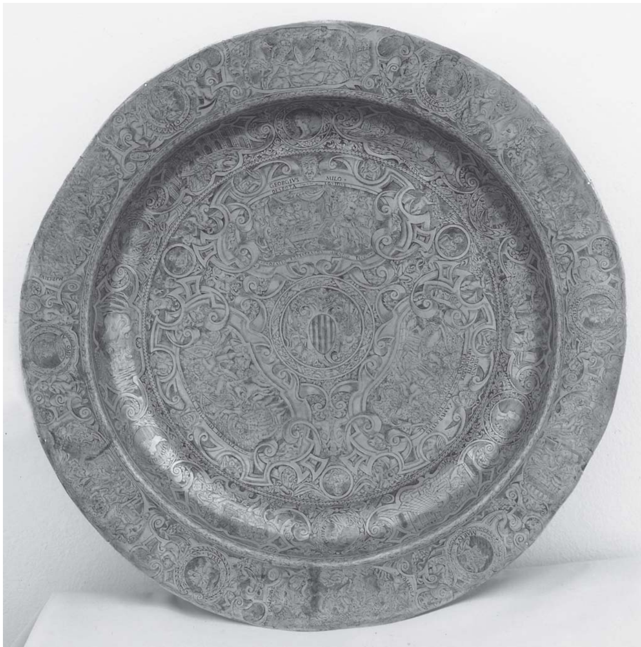
1. Horacije Fortezza, Umivaonik , mjed, promjer 475, visina 60 mm, gravure ispunjene crnom pastom (Šibenik, Županijski muzej) 1. Horatio Fortezza, basin, brass, diameter 475 mm, height 60 mm, engravings filled with black polish

četka 17. st., od kojih su dvije s temama što se uklapaju u kontekst antičkih exempla omiljenih u patricijskih naručitelja humanističkoga obrazovanja: Hortenzija drži govor i rimske žene žrtvuju dragocjenosti da bi otkupile slobodu domovine zlatom što ga zahtijeva galski vođa Breno. 7 Lik Hortenzije pojavljuje se i na jednoj od Fortezzinih posuda, a na više mjesta i šibenski majstor tematizira borbu rimskih junaka protiv Gala: primjerice Rimljanin Korvin u borbi protiv divovskoga Gala na šibenskom umivaoniku itd. Dvije sačuvane Sorkočevićeve freske predočuju virtus rimskih žena – što zacijelo ima posebnu kontekstualnu važnost, koju bi trebalo