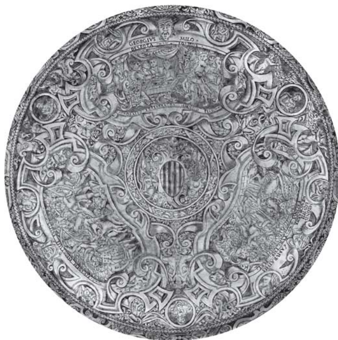
8. Horacije Fortezza (dno šibenskog umivaonika): Zdravica kneza Lazara; Miloš ubija sultana Murata; Miloševa pogibija

8. Horatio Fortezza (bottom of Šibenik basin): Prince Lazar giving a toast; Miloš killing sultan Murat; Miloš's death