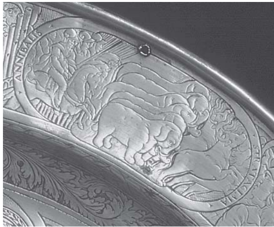
2. Horacije Fortezza, Hanibalova ratna varka (Anibalis stratagema) , detalj s umivaonika (Museo nazionale del Bargello) 2. Horatio Fortezza, Hannibal's war skinn (Anibalis stratagema), basin detail