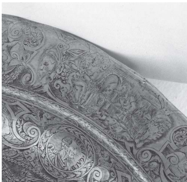
g. Aleksandar Veliki g. Alexander the Great