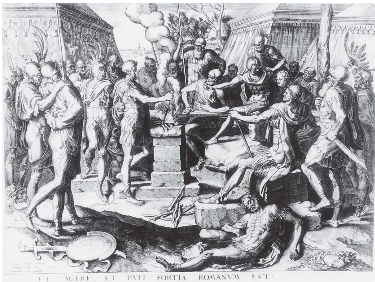
5. Philips Galle, Mucije Scevola , bakrorez, 1563. (Bruxelles, Bibliothèque Royal Albert I er , Cabinet des estampes)