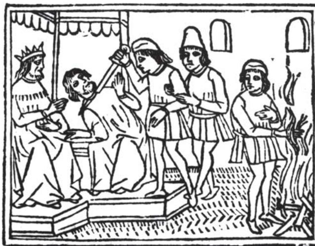
6. Mucije Scevola pred Porsenom , drvorez (Deche di Tito Livio vulgare hystoriare, Venecija 1511. Beč, sign. ÖNB 53.P.8.)

U kontekstu transkulturalne narodne epike, koja je u to doba zajednička čitavom južnoslavenskom području, Miloš Obilić je imao posebno mjesto kao miles christianus ( cavalier di Christo prema talijanskom prijevodu Dukine kronike), junak kršćanske vjere u borbi protiv najljućeg neprijatelja. Osim njega osobito je omiljen Kraljević Marko, koji je također živio u narodnoj predaji, a u hrvatsku ga književnost uvodi Petar Hektorović. Cvito Fisković citira izvještaj mletačkog upravitelja Splita iz 1574. u kojem stoji da su prigodom jed-