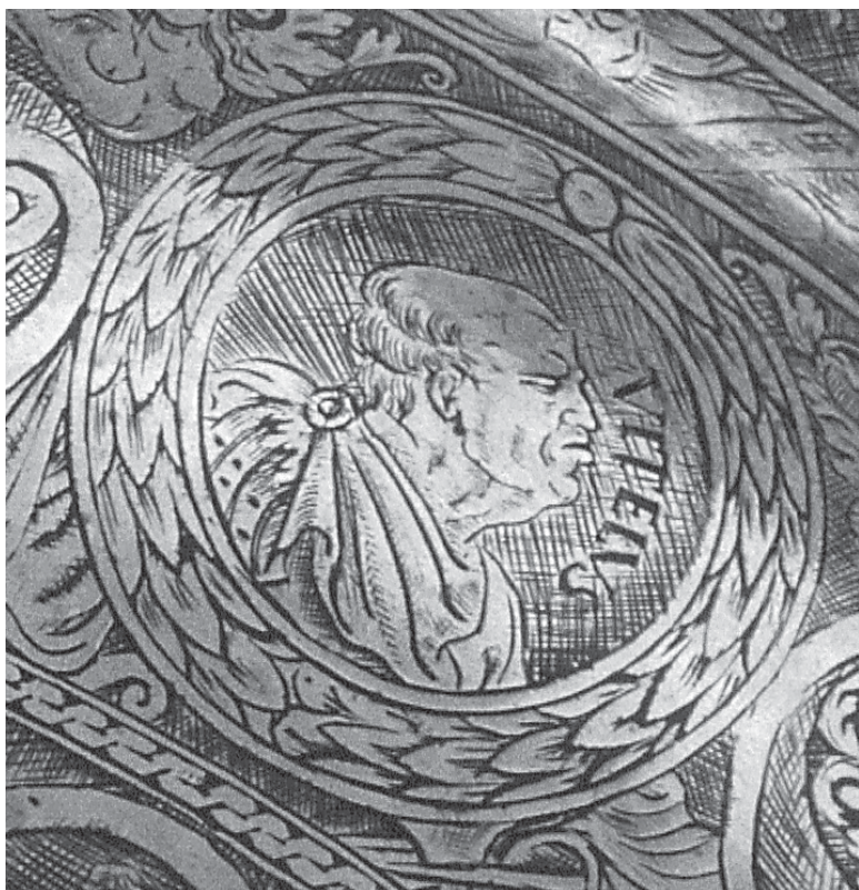
7. Portret Vitelija