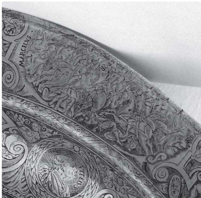
4. Horacije Fortezza, šibenski umivaonik: