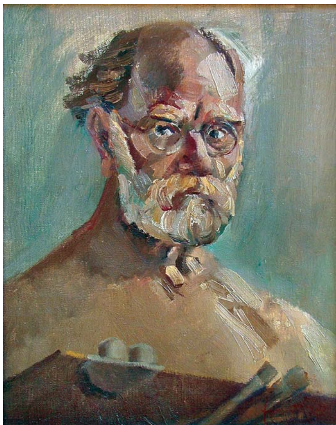
Autoportret (nedovršen), 1950., ulje na platnu, 51 x 42 cm Self-portrait (unfinished), 1950

aksiološke kolokacije), mogli smo naići i na primjere prevladavajuće magičnosti, i na dodire s klasičnošću, tek nešto manje na objektivno-kritički pristup. Eventualnu tendencioznost Jovanovićeva slikarstva našli bismo, međutim, na ikonografskoj razini, na području snovite evazije u svijet cirkuša i na slučaju slike Moj ručak , koja bi mogla biti manifestom siromaške ili plebejske socijalne pozicije. Nekoliko prizora s fiksiranjem etnografskih značajki zavičaja bili bi isto tako obol nekom prizemnijem realizmu.