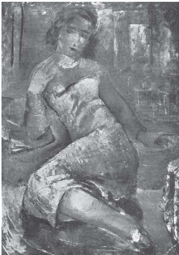
Poslije zabave , 1935., ulje na platnu (po fotografiji) After a Party, 1935