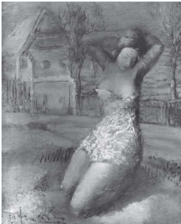
Studija , 1939., ulje na platnu (po fotografiji) A Study, 1939