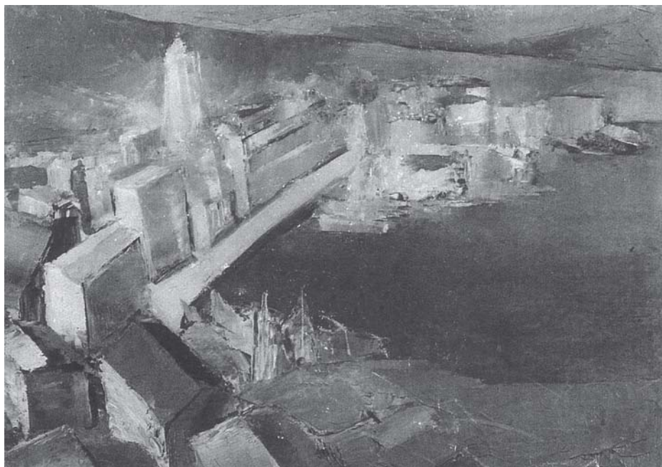
Split , 1932., ulje na platnu (po fotografiji) Split , 1932