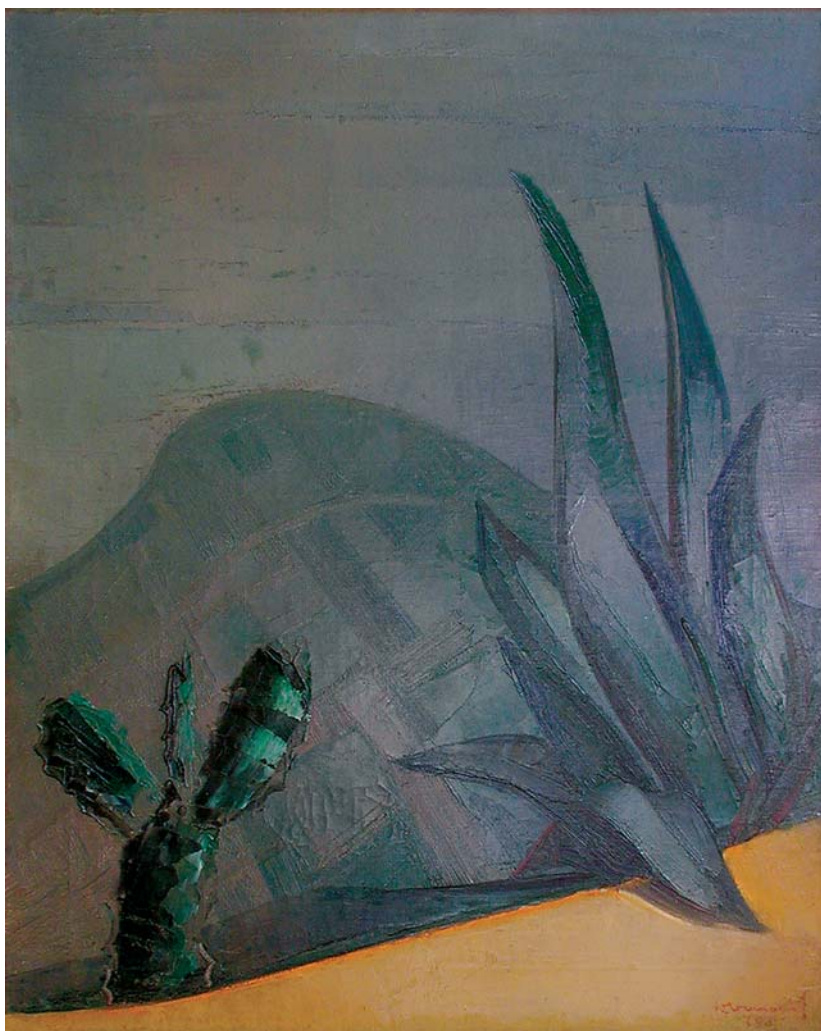
Kaktus i agava (Marjan) , 1935., ulje na platnu, 77 x 62 cm Cactus and Agave (the Marjan mountain), 1935

Kaktus i agava (Marjan, 1935., 77 x 62 cm) vrhunac je autorovih reduktivnih i simboličkih nastojanja. Dvije biljke, neslučajno bodljikave i šiljaste, u prvome planu s pozadinom obrisa brežuljka tvore znakovit dijalog rijetke apartnosti. Osim snažna kontrasta uskog žučkastog pojasa zemlje sve je drugo u variranju plavih i zelenkastih tonova (neba, obronka i biljne epiderme). Prividna smirenost i monotonost aktivirana je živim linearizmom i emotivnim nabojem predočenih oblika.