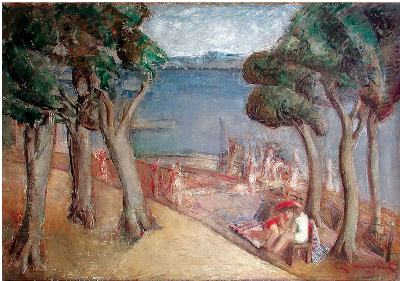
Na plaži (Crikvenica) , 1931., ulje na platnu, 71 x 101 cm On a Beach (Crikvenica), 1931