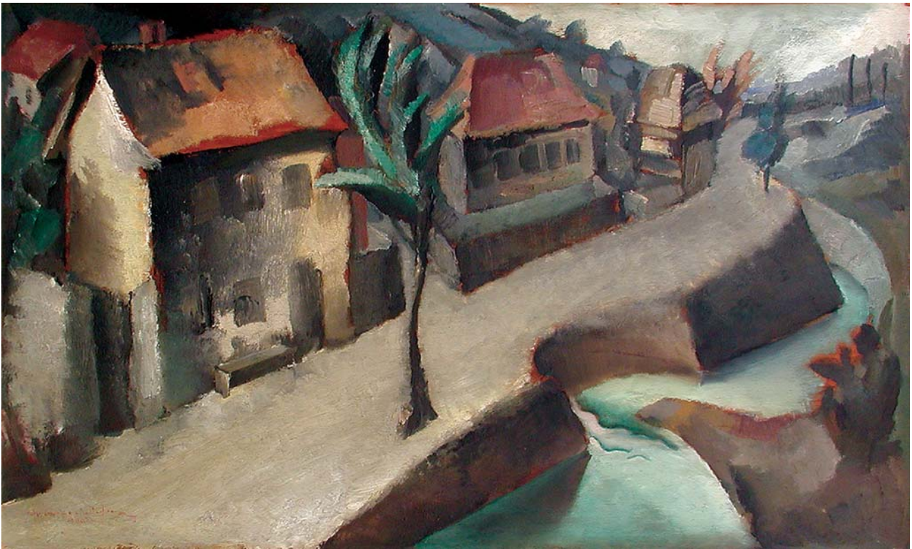
Gvozdansko , 1930., ulje na šperploči, 60 x 93 cm Gvozdansko, 1930

fotografiji) možemo smatrati korakom dalje u svjesnoj deformaciji ili pak retoričkoj stilizaciji figuralnog motiva. Sjedeći, unatraške zavaljen ženski lik dan je u cik-cak dominantni, koja ide s pregibom koljena, s nagibom glave i pomakom ruku, od kojih desna prilazi vratu, a lijeva upućuje prema podu. Za razliku od te enterijerne kompozicije, Studija (iz 1939., također znana jedino po reprodukciji) situirana je u pejzaž, dapače u prepoznatljiv slikarev zavičajni banijski krajolik s tipičnom drvenom kućom u pozadini. Žena u prvom planu kleči na koljenima s visoko podignutim rukama iznad glave. Nproporcionalna tijela, naglašeno velikih, cjelovitih i stupastih bedara, obučena je u kratku i na grudima prilično otvorenu haljinu, koja pak vibrira od nervature poteza jakih luminističkih akcenata.