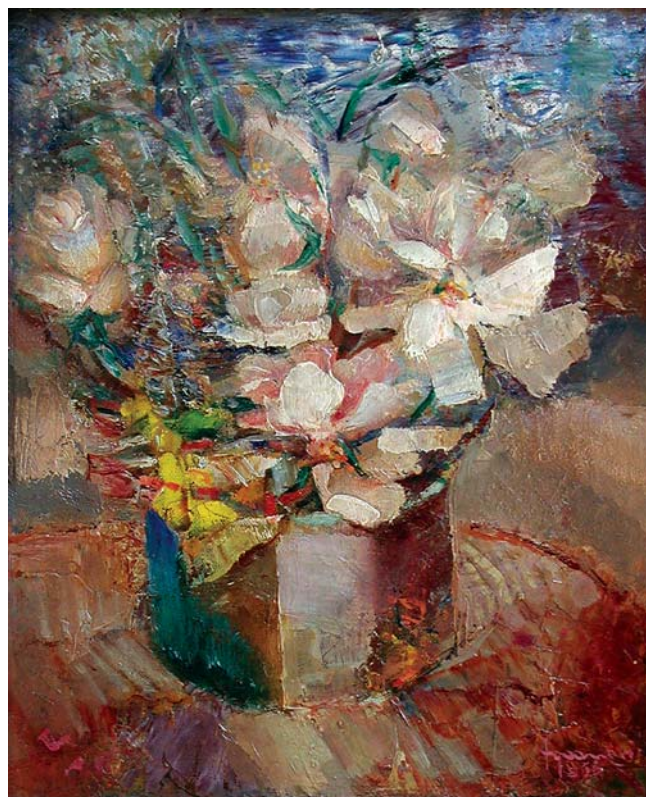
Prevalo cvijeće , 1936., ulje na platnu, 34 x 29 cm Past Blossoming, 1936

Našu interpretaciju započet ćemo od Gamulinova »šlagvorta«: »poneka sačuvana fotografija ukazuje na nesumnjivo osebniju poetiku, ne samo ikonološku ( Cirkusanti putuju , Cirkusanti vježbaju , Sajamski dan )«. Doista, tu smo na mjestu gdje se dodiruju biografija i stvaralačka preobrazba, gdje je nevolja lutalačkog životarenja i sajamskog nadničarenja urodila kompenzativnim poetskim viđenjem. Znamo da je Stanojev otac, još u slikarevu djetinjstvu, načinio vrtuljak te njime posjećivao seoske svetkovine i kirvaje (kako bi zaradivao kad mu je ozljeda onemogućila vođenje obrta). Mali ga je Stanoje počesto pratio na takvim putovanjima i zapamtio sa zanosom prizore igre i slobodnoga kretanja. Kad se morao sjetiti nečega vedrog, poticajnog ili blistavog iz vlastite tamne i škrte mladosti, kao umjetnik neizbježno se okrenuo scenama lebdjenja i nadmašivanja gravitacije, scenama čudesnog prevladavanja svakidašnjice slobodom ludičkog nagona.