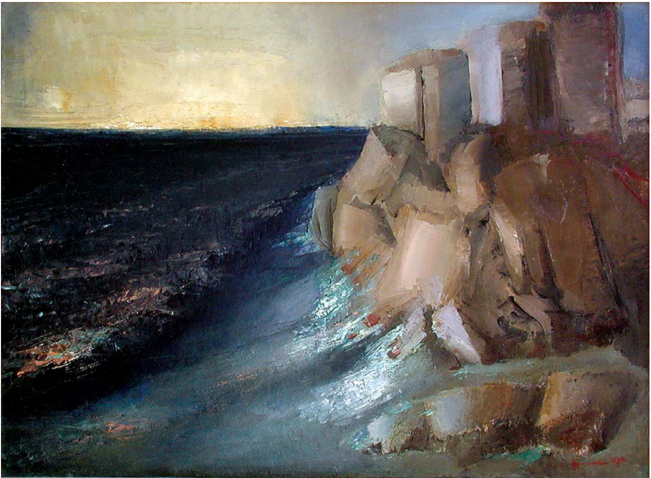
More (kraj Dubrovnika) , 1931., ulje na platnu, 70 x 95 cm Sea (near Dubrovnik), 1931

nutak ravnoteže između konstruktivističkih tendencija i kolorizma nabijenog suzdržanom snagom, a rezultat je ostvarenje magične uvjerljivosti i metafizičke pročišćenosti. Neobične, izdužene dimenzije nude panoramsku («sinemaskopsku») vizuru, a puste ispražnjene površine šetališta tvore nestvaran ugođaj. Kubusima kuća i tvrdim bridovima obala kontrastiraju usplamtjele krošnje rijetkih stabala. Kompozicija ima paralelizma s Becićevim Planinskim pejzažem s potokom , no sveukupni je dojam oporog monumentalizma i očuđujućeg verizma sasvim originalan i osoban.