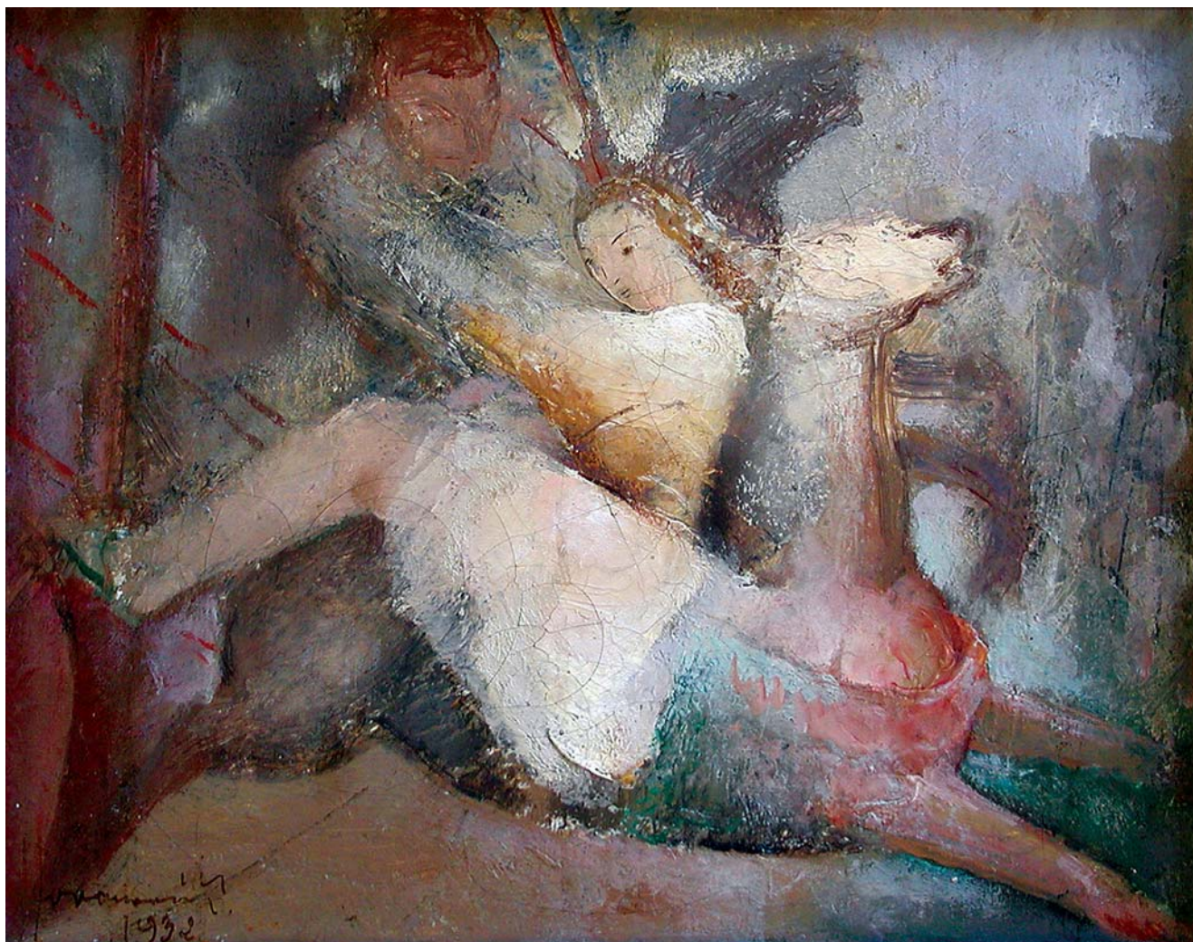
Na vrtuljku , 1932., ulje na platnu, 23 x 29 cm On a Roundabout, 1932

meritorno raspravio problematiku recepcije i s empatijom i afinitetima valorizirao stvaralački doprinos. Ali on je, svjesnom odlukom regionalnog povjesničara i skrupulama povijesnomjetničkog neprofesionalca, svoje rezultate objavljivao u teže dostupnoj, ili likovnoj publici manje namijenjenoj, periodici i publicistici. 2 Međutim, bez njegova sakupljačkog i komentatorskog uloga obrisi Jovanovićeve umjetničke pojave bili bi nam bitno nejasniji, gotovo sasvim zamagljeni i šturi.