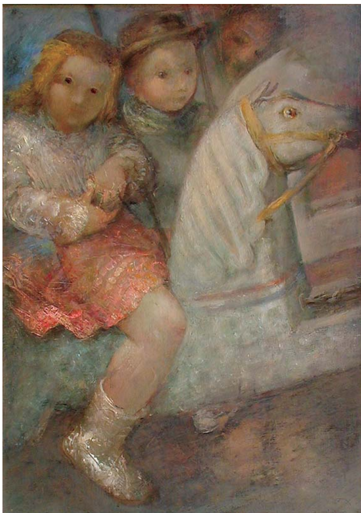
Na vrtuljku, II, 1941. , ulje na platnu, 70 x 50 cm On a Roundabout, II, 1941

kolovoza 1951.). Ali četvrto desetljeće bilo je iznimno plodno i ostavilo je traga, zbog čega zaslužuje nešto detaljnije razmatranje i analizu sačuvanih slika (a s vremenom i cjelovitiji prikaz, monografsku izložbu i/ili knjigu retrospektivnoga karaktera).