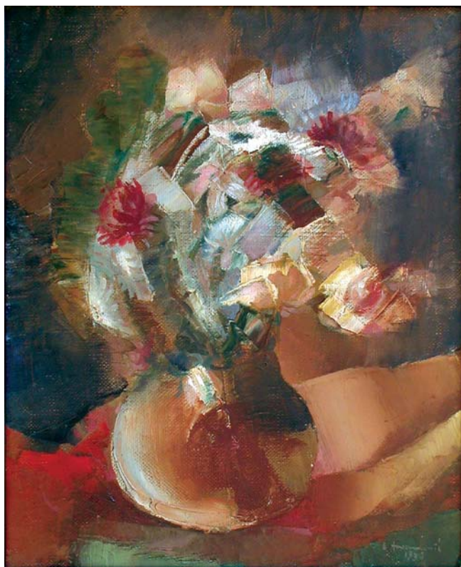
Cvijeće , 1936., ulje na platnu, 46 x 38 cm Flowers, 1936