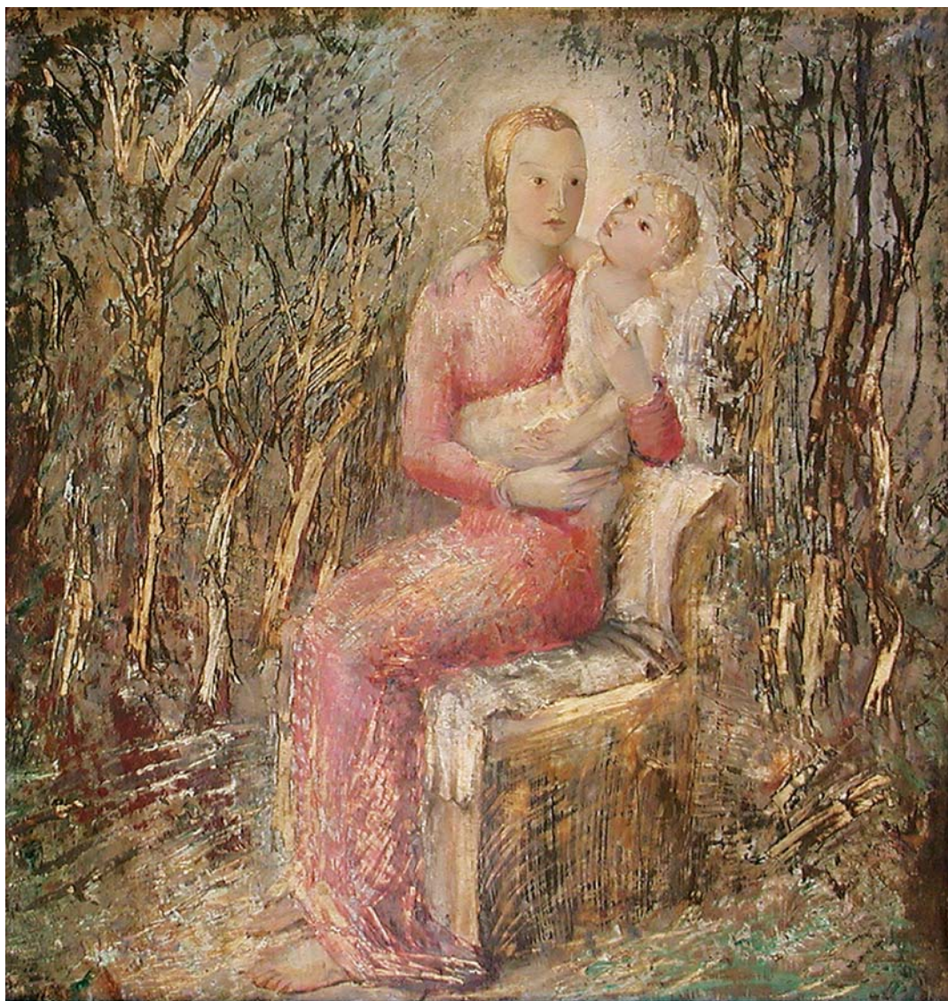
Majka s djetetom , 1932., ulje na dasci, 54 x 51 cm Mother with Child, 1932