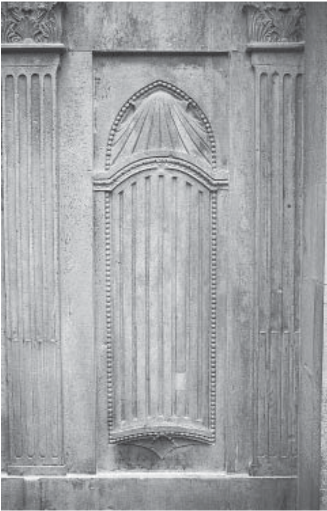
Nikola Firentinac, inverzna niša i pilastri, Šibenik, katedrala Nikola Firentinac, inversed niche and pilasters, Šibenik, the cathedral

očite veze s Donatellovim padovanskim krugom, također počiva na pretpostavci o potpunoj promjeni likovnog izričaja Jurja Dalmatinca, što je ipak malo vjerojatno.