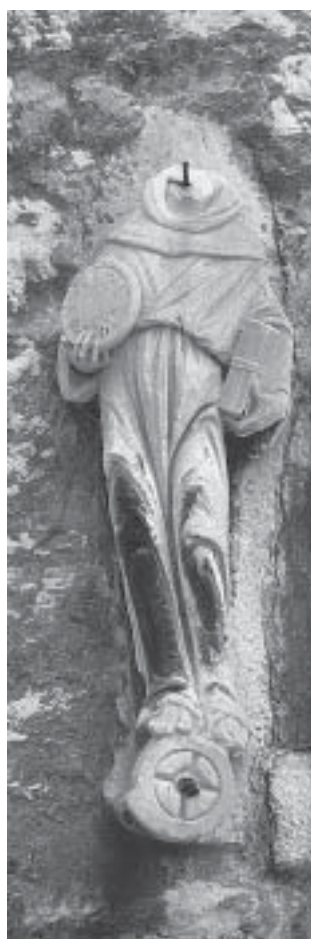
Nikola Firentinac, Sv. Bernardin , Šibenik, Samostan sv. Frane Nikola Firentinac, St Bernadine, Šibenik, St Francis Monastery