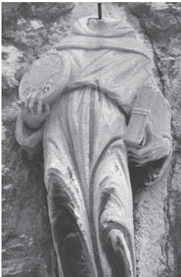
Nikola Firentinac, Sv. Bernardin , detalj Nikola Firentinac, St Bernadine, detail