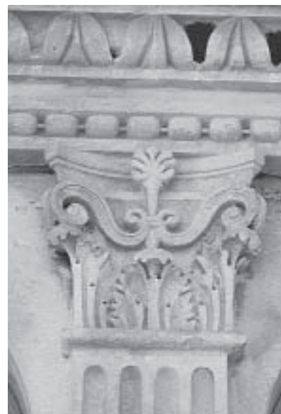
Nikola Firentinac, kupola šibenske katedrale, detalj Nikola Firentinac, dome of Šibenik cathedral, detail