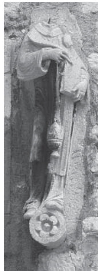
Nikola Firentinac, Sv. Stjepan , Šibe- nik, Samostan sv. Frane Nikola Firentinac, St Stephen, Šibe- nik, St Francis Monastery