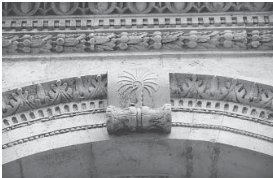
Nikola Firentinac, heraldički znak porodice Malipiero, Šibenik, katedrala Nikola Firentinac, the heraldic sign of the Malipiero family, Šibenik, the cathedral