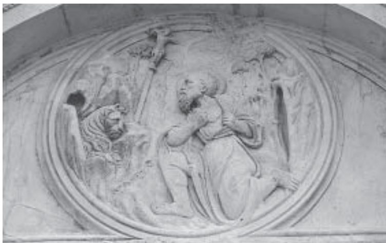
Nikola Firentinac, medaljon s likom sv. Jeronima, Šibenik, katedrala Nikola Firentinac, medallion with the image of St. Jerome, Šibenik, the cathedral