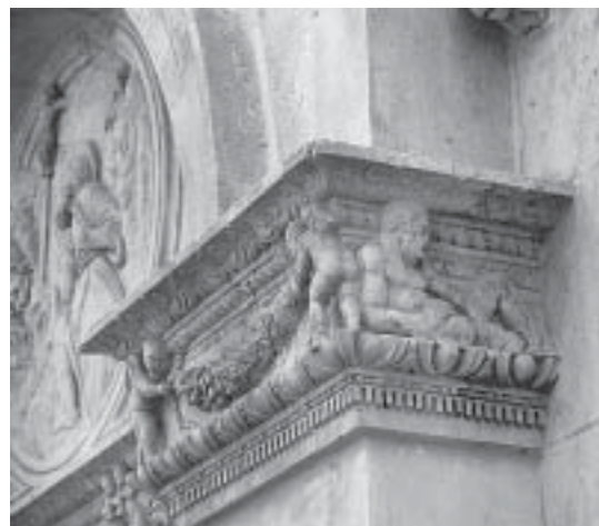
Nikola Firentinac, ukrasni vijenac, detalj Nikola Firentinac, decorated cornice, detail

torske dekoracije vanjštine crkve, no upotrijebivši bitno drukčiji repertoar ukrasa. Dakako, Nikola je pritom nužno morao usvojiti i Jurjev način građenja velikim kamenim pločama, 38 što je kasnije primjenjivao na ostalim svojim gradnjama, prvenstveno pri izradi kapele blaženog Ivana u trogirskoj katedrali. 39