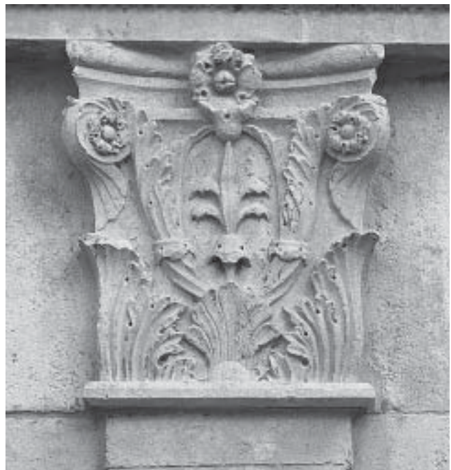
Nikola Firentinac, ukrasni vijenac i luneta, Šibenik, katedrala Nikola Firentinac, decorated cornice and lunette, Šibenik, the cathedral