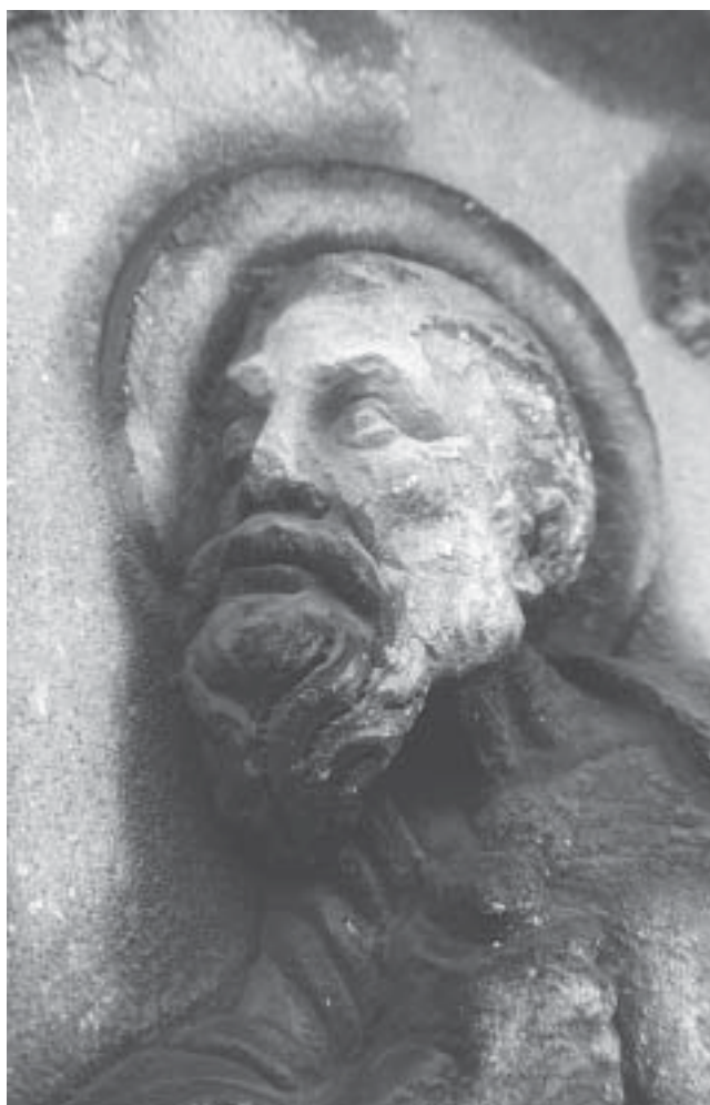
Nikola Firentinac, sv. Jeronim, detalj Nikola Firentinac, st Jerome, detail