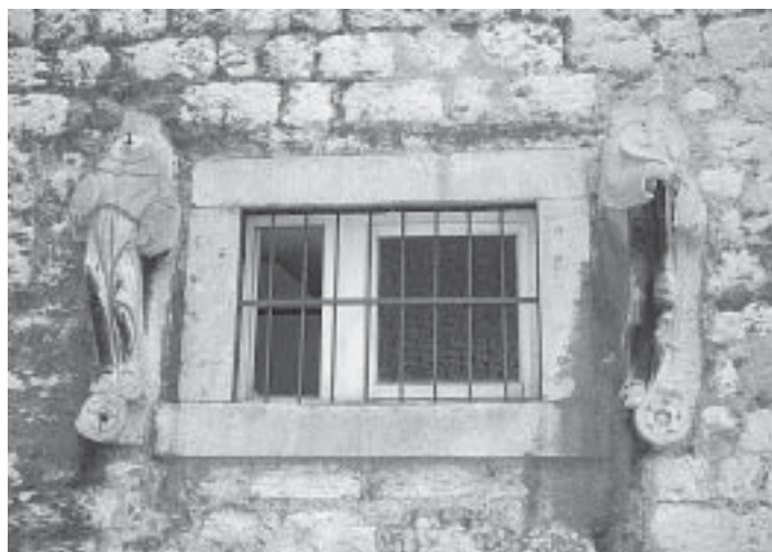
Nikola Firentinac, Sv. Bernardin i sv. Stjepan , Šibenik, Samostan sv. Frane Nikola Firentinac, St Bernadine and St Stephen, St Francis Monastery

gov životopis, biti predmetom rasprava i domišljanja, temeljenih prvenstveno na onom što se o majstoru pouzdano zna.