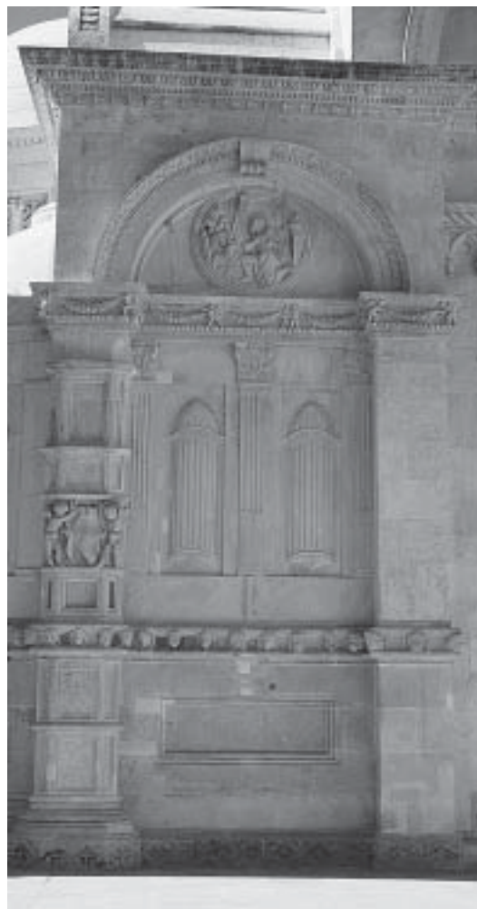
Šibenik, katedrala, detalj Šibenik, the cathedral, detail

da je radio na šibenskoj katedrali, a čiji kasniji radovi otkrivaju da je barem dijelom usvojio renesansni likovni rječnik. Međutim, kako je poznato da se repertoar renesansnih motiva kod Alešija javlja tek po doticaju s Nikolom Firentincem, to jest kasnije od vremena u kojem je nastao spomenuti dio katedrale, Karamanova atribucija nije naišla na širi odjek.