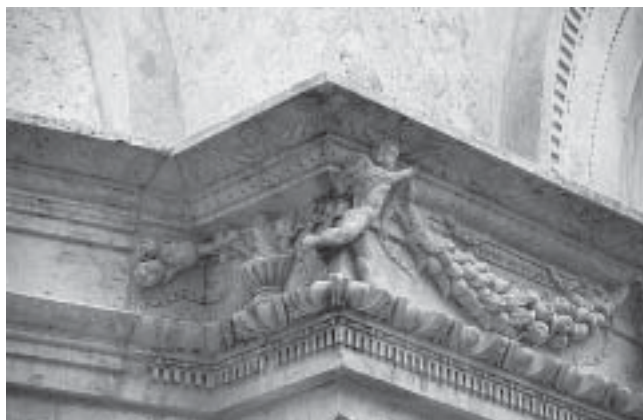
Nikola Firentinac, ukrasni vijenac, detalj Nikola Firentinac, decorated cornice, detail

koje završavaju motivom školjke. Međutim, dvije već spomenute inverzne niše na tom dijelu građevine izrađene su bitno drukčije od onih na apsidama. Iluzionistički perspektivni pristup, kojim se Dalmatinac koristio da bi izbjegao stanjivanje kamenih stijenci, ovdje je doveden do moguće krajnosti – »konveksnih niša«. U odnosu na Dalmatinčeve, one su nešto manje robusne, elegantnije i dodatno ukrašene okvirom od okruglih perlica. Sama ideja da se ispupčenim volumenom stvori iluzija niše otkriva ne samo domišljatost nego i smjelost majstora da se posluži sasvim neuobičajenim rješenjima. Niše su smještene između renesansnih kaneliranih pilastara, do trećine popunjenih. Kapiteli pilastara, potpuno renesansnog karaktera, 31 podržavaju vijenac, kojim dominira motiv teških girlanda koje nose maleni putti. Kao još jedan karakterističan Firentinčev ukrasni motiv, pojavljuju se i kantarosi. 32 Posebno zanimljiv dio ukrasa vijenca lik je nagog ležećeg muškarca na kraju friza, za kojeg je utvrđeno da prikazuje Herakla kako se odmara na koži nemejskog lava, te da je nastao na osnovi nekog predloška, sličnog crtežu što se čuva u galeriji Uffizi u Firenci. 33 U donjem dijelu vijenca je profil ukrašen zupcima, astragalom s perlicama i presječenim nizom ovulusa. Motiv ovulusa, toliko karakterističan za sve kasnije Firentinčeve radove, na ovom se dijelu šibenske katedrale pojavljuje prvi put premda u ponešto modifikiranom obliku (vodoravno presječen).