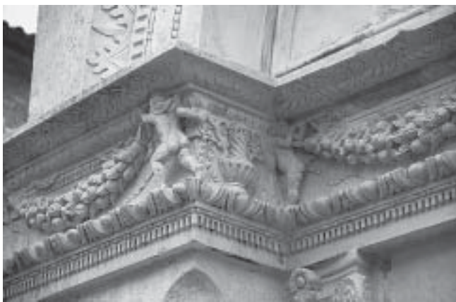
Nikola Firentinac, ukrasni vijenac, detalj Nikola Firentinac, decorated cornice, detail