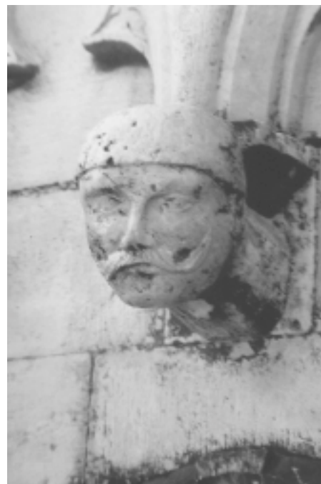
Šibenska katedrala, sjeverna fasada, konzola u obliku ljudske glave Šibenik Cathedral, north façade, console shaped as human head

je iznad završnog korniza zid povišen za sedamdesetak centimetara i dobio još jedan korniz. Uostalom i to da se praktički neposredno iznad svodova bočnih traveja postavlja novi svod, kojim završava elevacija bočnih brodova, jasno pokazuje promjenu graditeljskog koncepta.