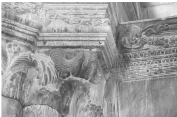
Šibenska katedrala, glavna apsida, polukapitel s likovima pijevaca Šibenik Cathedral, main apse, rooster half-capital