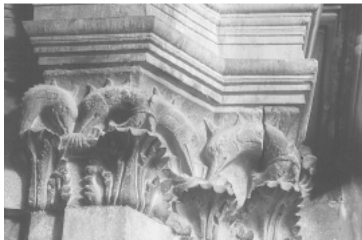
Šibenska katedrala, južna apsida, polukapitel s likovima dupina Šibenik Cathedral, south apse, dolphin half-capital

no u variranju frizura i pokrivala za glavu, čemu je kipar posvetio iznimnu pozornost, te u svojevrsnoj unifikaciji ženskih likova karakteristično šiljatih brada. Očita razlika nije toliko u likovnoj i tehničkoj kvaliteti izrade (koja kod glava na konzolama katkad i nadmašuje onu na glavama apsida), koliko u bitno različitom ikonografskom pristupu: glave na apsidama su galerija psiholoških portreta (bez obzira da li prikazuju povijesne ličnosti ili ne), a niz konzola je zapravo izveden iz grotesknosti gargouillesa . Kao jedan od specifičnih elemenata koji upućuju na Jurja kao autora ističe se groteskni smijeh glave na apsidi kod koje se vide zubi, što je zapravo ublažena varijanta onog koji nalazimo na nekoliko sličnih glava na konzolama, čak s vrlo slično izvedenim zubima. 68 No ono najvažnije što povezuje glave na apsidama s konzolama sjeverne fasade jest izrazita čvrstoća i snaga volumena, 69 te vrlo uvjerljiva psihološka profilacija, pri čemu je kod konzola naglasak na grotesknosti, a kod glava na apsidama više je izražena fina psihološka izražajnost, makar je i kod nekih od njih prilično zamjetljiv element groteske. Smatram stoga da se najveći dio konzola može smatrati Jurjevim djelom, a da su tek neke od njih, prvenstveno životinjske glave, djelo njegovih pomoćnika. 70