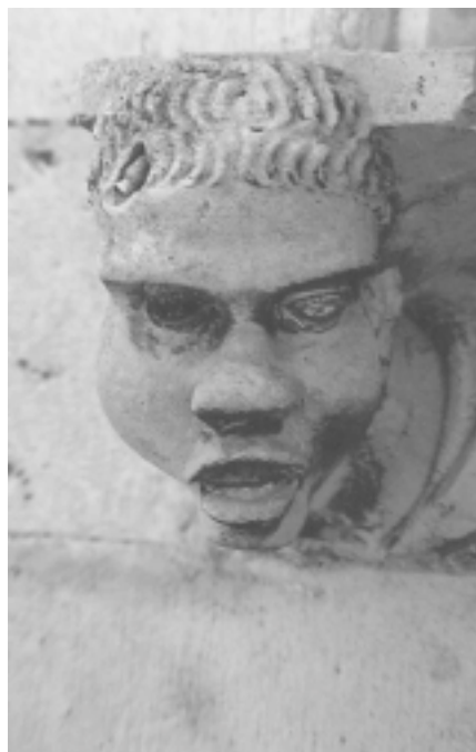
Šibenska katedrala, sjeverna fasada, konzola u obliku ljudske glave Šibenik Cathedral, north façade, console shaped as human head