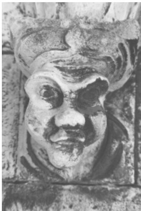
Šibenska katedrala, sjeverna fasada, konzola u obliku ljudske glave Šibenik Cathedral, north façade, console shaped as human head