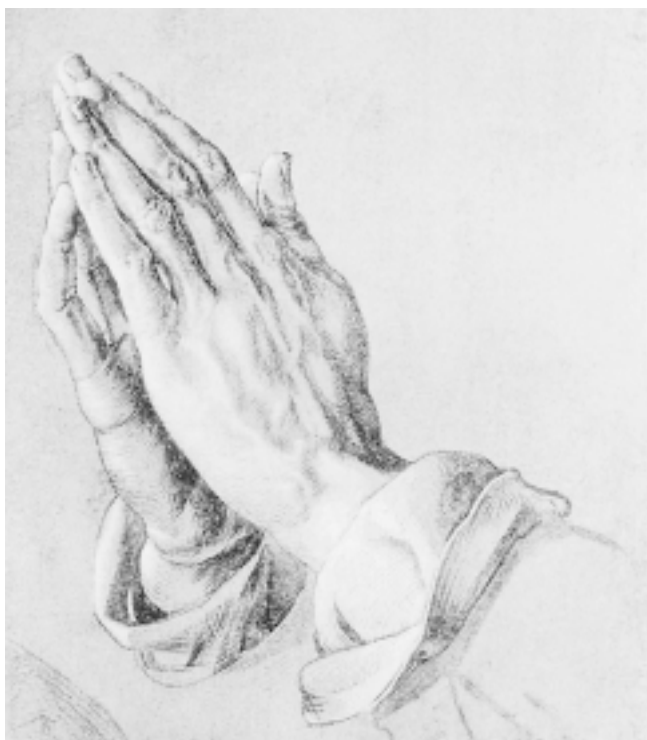
6. Detalj zagrebačke slike 6. Detail of the Zagreb painting

Hellerov oltar (1508. Beč, Albertina, sl. 7). Prvo nam postaje možda još jasnije, do koje mjere Dürer crta najfinijim kistom precizno i sigurno, »nenadmašenim virtuozištom« i drugo, kako raščlanjuje mali prst i dlan gledan s unutarnje strane djelomično prekriven drugom rukom. Na originalnoj slici Dürerov postupak kojim naglašava gornji dio dlana je očit, ali površnog promatrača može zavarati da je prst previše izdužen i anatomski je nemoguće raščlambe, što se možda dogodilo i kopistu zagrebačke slike kada je ne shvaćajući pokušao imitirati.