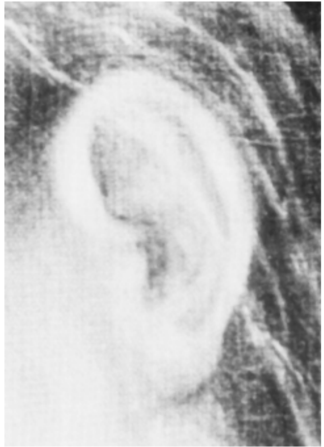
24. Detalj zagrebačke slike 24. Detail of the Zagreb painting