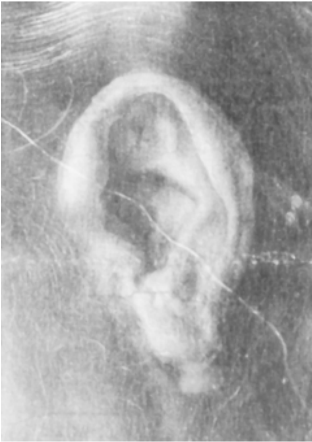
23. Detalj njujorske slike 23. Detail of the New York painting