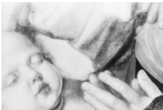
15. Detalj njujorske slike 15. Detail of the New York painting