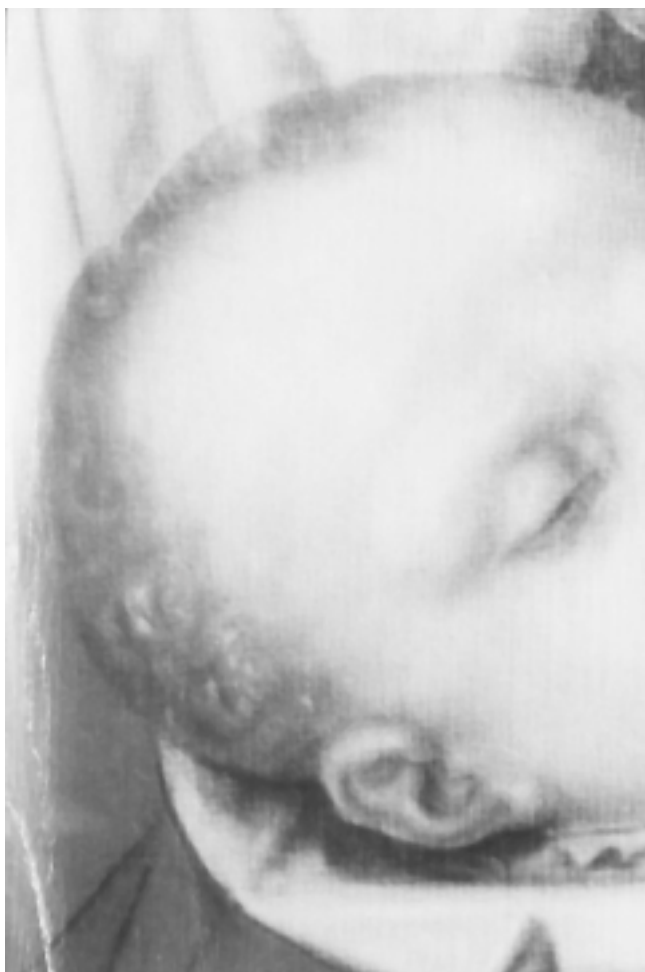
19. Detalj njujorške slike 19. Detail of the New York painting