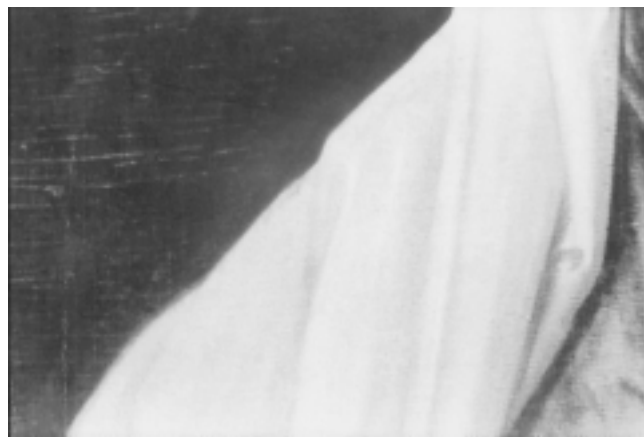
28. Rub Aninog plašta na zagrebačkoj slici (na crno-bijeloj fotografiji teško razaznatljiv) 28. Hem of St. Anne's cape on the Zagreb painting (hardly discernible on the black-and-white photograph)

Što je od toga napravio kopist? (sl. 2 i 16). Postoji interpretacija da je kič neka vrsta pometanja. Ovdje se to doslovno dogodilo. Pogled, pa tako i ruka kopista pomela je sve sitne i fine elemente, a ono što vidimo su rezultati tog metenja. Privid uskog nabora svjetlom, naspram tame koja je lomi, pa je tako čas bliska jednako krivulji, čas uglatoj, čas se izravnavava u neprekinutom toku neznatno se šireći odozgo prema dolje, izgubilo je te karakteristike: linijski dio se izravnavava, a sjene su pretvorene u izolirane tamne kratke poteze ili mrlje koje s tom suptilnom iluzijom ponašanja tvrde tkanine nemaju nikakve veze. A tek cijela »spilja«, »zaslon«, »zaštita« oko Bogorodičine glave gubi efekt dubine, pa čak ni oblik križa ne uspijeva iskočiti.