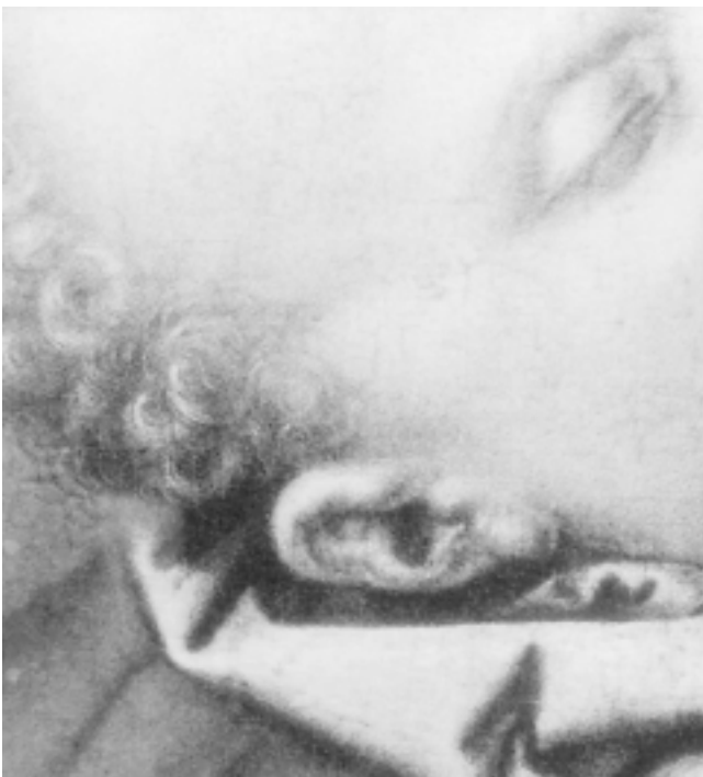
25. Detalj njujorske slike 25. Detail of the New York painting