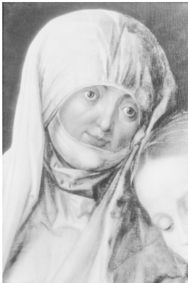
9. Detalj zagrebačke slike 9. Detail of the Zagreb painting

Da bismo doista pogledali sliku, potrebno je napustiti razinu cjeline, gdje se površni pogled zadovoljava samo registriranjem scenske kompozicije i lako može zavarati te prodrijeti u sliku, u to, kako je naslikana, što nam najbolje uspijeva ako se usredotočimo na detalje.