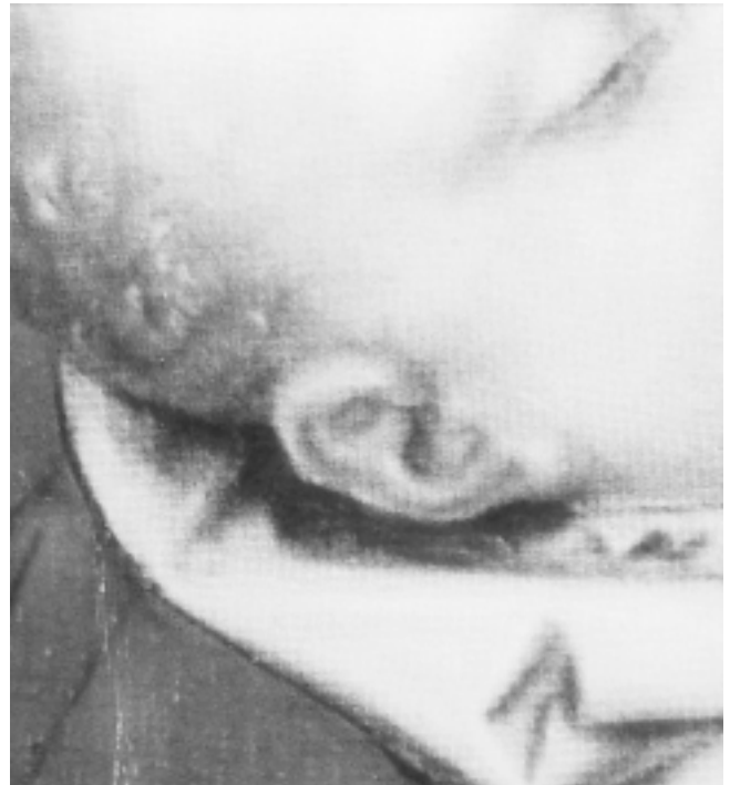
26. Detalj zagrebačke slike 26. Detail of the Zagreb painting