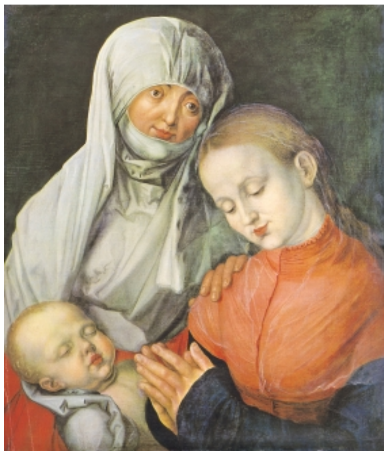
2. Pseudo-Dürer, Sv. Ana s Bogorodicom i Isusom , 1518, Strossmayerova galerija HAZU, Zagreb

U zagrebačkoj slici odstupanja od scenske kompozicije originala su minimalna i upravo to, kako smo već rekli, može zavarati površnog promatrača. Ina ih ipak utoliko što je u kopiranu sliku »više toga stalo«, »vidi se« veći dio Bogorodičina ramena, Bogorodičina rukava i u duljini i širini, veći komad crvene tkanine u lijevom kutu, Djetetovo desno rame, njegova glava u cjelini. Odstupanja, međutim – riječ je o omjerima pojedinih dijelova lica – iako su na makrorazini, teže je analizom odvojiti od načina slikanja kopiste. Najuočljivija intervencija je u slučaju Bogorodičinih usana (sl. 3, 4). Obrisi donje usne sačinjen je od jednake i nejednake krivulje različitih veličina povezanih translacijom, ali dvosmisleno, jer se u to sintaktičko pravilo upliće i drugo – modulacija – prijelaz iz jednog znaka u drugi. U obrubljivanju gornje usne primjećuje se jednaka dvosmislenost u pravili-