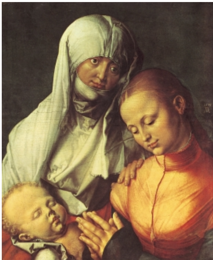
1. Albrecht Dürer, Sv. Ana s Bogorodicom i Isusom , 1519, Metropolitan Museum, New York

1. Albrecht Dürer, St. Anne With the Virgin and Child , 1519, Metropolitan Museum, New York