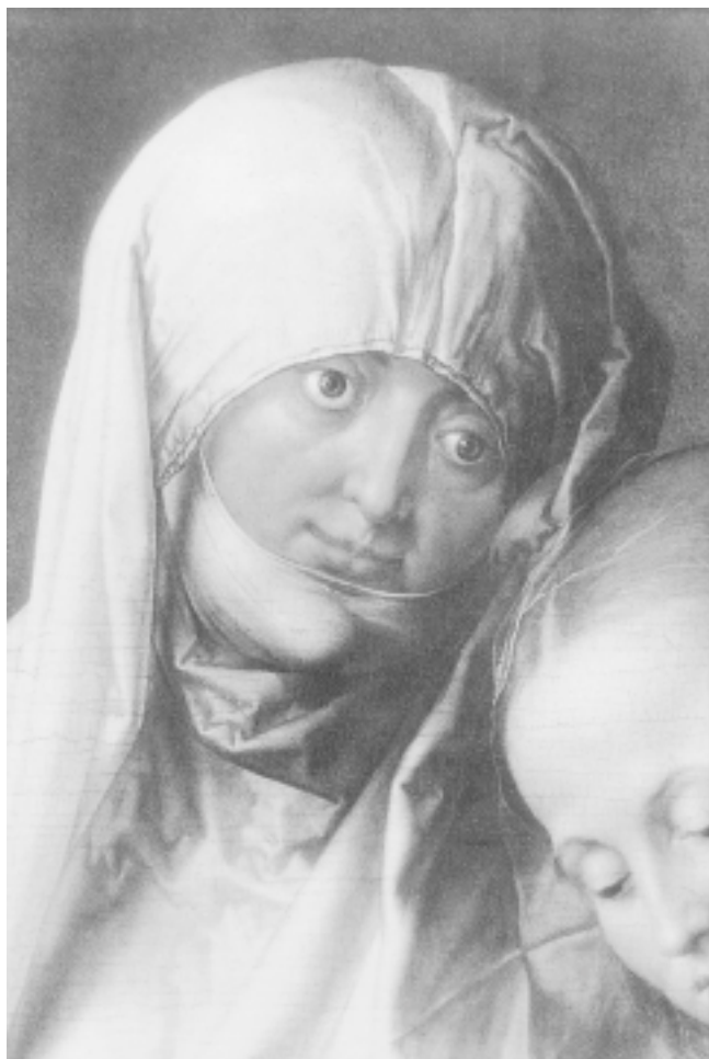
8. Detalj njujorske slike 8. Detail of the New York painting