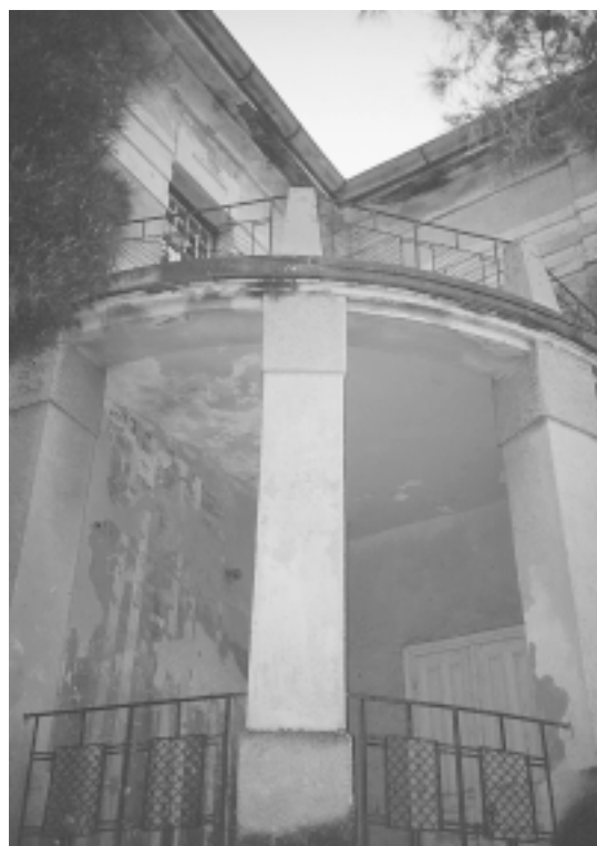
Ostaci Šizgorićeva ljetnikovca na Žirju