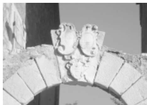
Prvić, ljetnikovac Fausta Vrančića Prvić, Faust Vrančić's villa