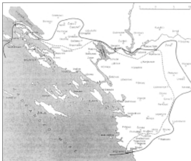
Granice šibenskog kotara u 13. i 14. st. (J. Kolanović, Šibenik u kasnom srednjem vijeku , Zagreb, 1995) Borders of the County of Šibenik in the 13 th and 14 th centuries

Na hodočasničkim putovanjima od Venecije do Palestine (1483/1484) dominikanac švicarskog podrijetla Feliks Fabri (Schmid) pomno je zapisivao svoja zapažanja o Dalmaciji. 13 I njegova putopisna ostavština ilustrira topografsku sliku šibenskog otočja viđenu optikom putnika u čijem će se fokusu ponovno naći Prvić, o kojem piše: »...Strana brda na kojoj stajah gleda prema Šibeniku, bijaše plodna, puna vinogra-