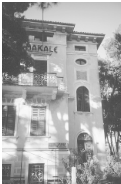
Zlarin, Vila Ester (Makale) Zlarin, Villa Ester (Makale)