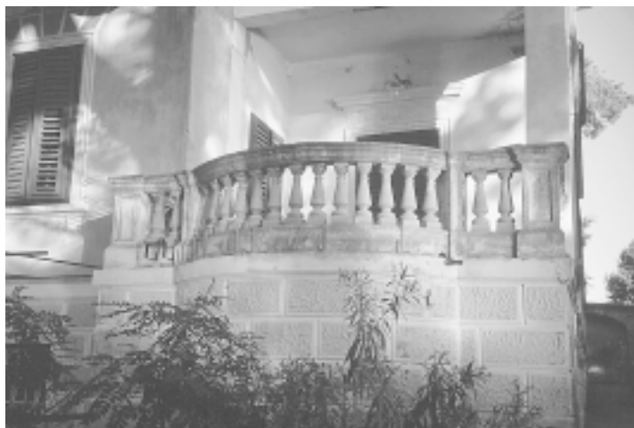
Zlarin, Vila Ester (Makale) Zlarin, Villa Ester (Makale)