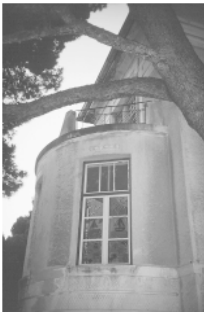
Tisno, Vila Mazzura Tisno, Villa Mazzura