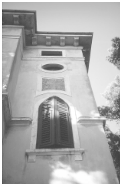
Zlarin, Vila Ester (Makale) Zlarin, Villa Ester (Makale)