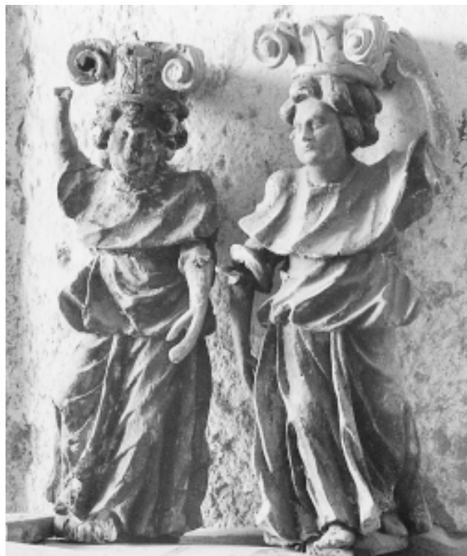
Brseč, crkva sv. Stjepana, oltar sv. Stjepana, karijatidne figure

Brseč, St. Stephen's Church, St. Stephen's altar, statue of St. Peter, detail