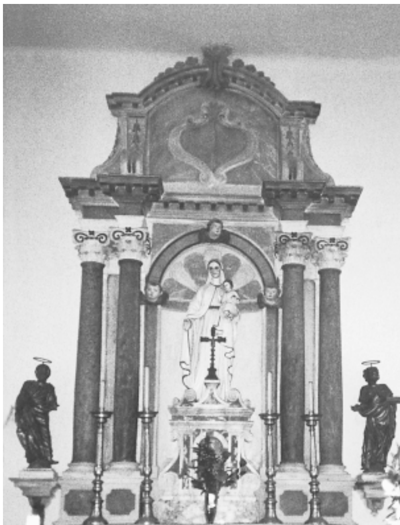
Filipana, župna crkva sv. Filipa i Jakova, glavni oltar Filipana, parish church of St. Philip and St. Jacob, main altar

ši tijekom pastoralnog pohoda 1701. godine Filipanu, biskup J. M. Bottari u svojem izvještaju bilježi da je » poduzetni župnik svojom marljivošću ukusno uljepšao crkvu i još će je ukrasiti «. 4 Nažalost, ne navodi se potanje o kakvim je zahvatima riječ. Je li možda već u to vrijeme podignut oltar ili su nabavljeni kipovi? Vitalna energija silovitog, ali ne i u punoj mjeri oslobođenog i nesputanog pokreta figura sv. Filipa i sv. Jakova dopušta prijedlog okvirne datacije kipova na kraj 17. ili prva desetljeća 18. stoljeća. Zasad nisu pronađeni konkretni primjeri oblikovno i stilski analogne datirane skulpture koji bi pomogli preciznijem datiranju kipova i profiliranju njihova majstora. Kontrolirani tijekom draperije koja obavlja figure ne prigušujući, već naprotiv naglašavajući njihovu tjelesnost, odgovara shvaćanju figure prevladavajućem u okvirima južne, mediteranske kiparske tradicije, ali srodna rješenja nisu nepoznata ni srednjoeuropskom baroknom kiparstvu. Upravo u tom, sjevernom smjeru, vode nas tipovi