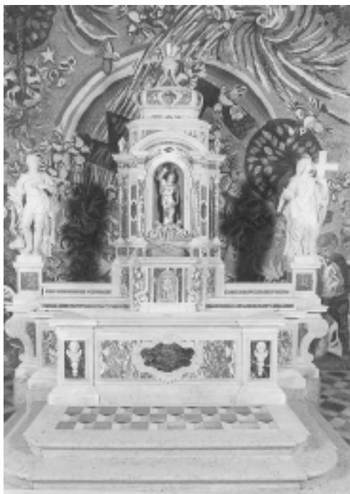
Dobrota, crkva sv. Eustahija/Stasija, glavni oltar

Dobrota, St. Eustachius' Church, main altar