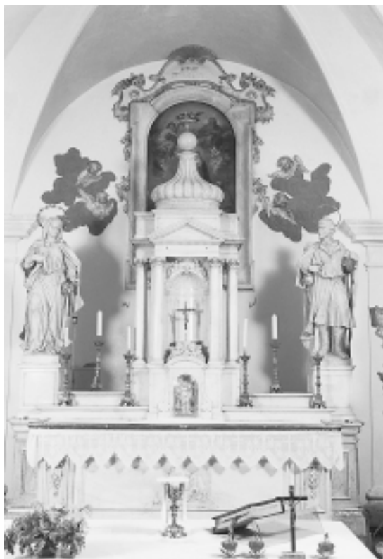
Dobrota, crkva sv. Mateja, glavni oltar Dobrota, St. Matthew's Church, main altar