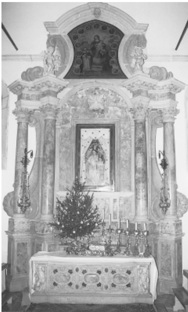
Bol, dominikanska crkva, oltar Gospe od Ružarija

Bol, Dominican church, Lady of the Rosary altar