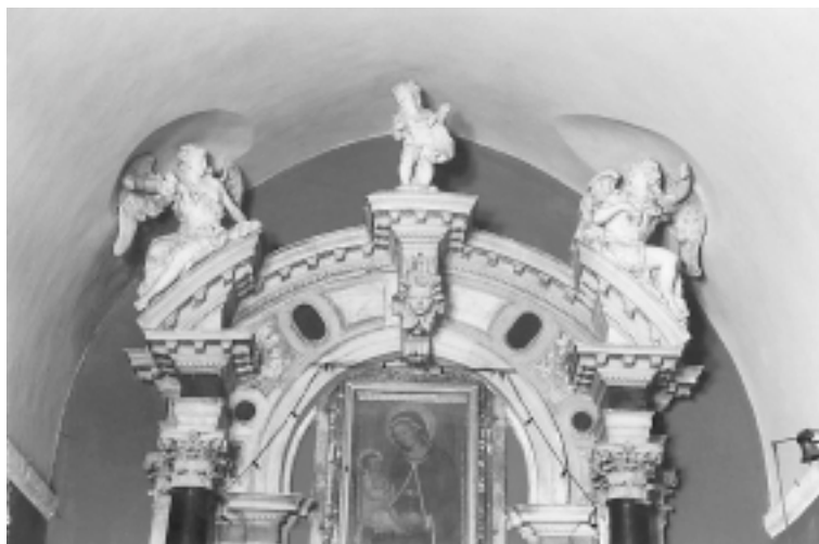
Giovanni Bonazza, Anđeli na glavnom oltaru, Perast, crkva sv. Nikole

Giovanni Bonazza, angels on the main altar, Perast, St. Nicholas's Church