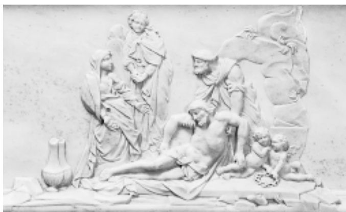
Polaganje u grob , reljef na antependiju glavnog oltara, Dobrota, crkva sv. Mateja Entombment of Christ, relief on main altar antependium, Dobrota, St. Matthew's Church