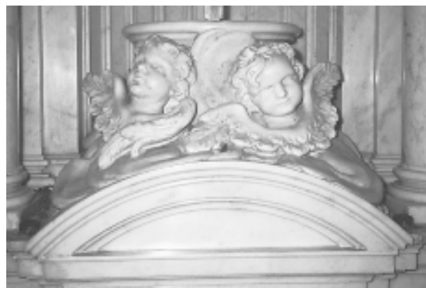
Giuseppe Bernardi, anđeli na svetohraništu glavnog oltara, Dobrota, crkva sv. Mateja Giuseppe Bernardi, angels on main altar tabernacle, Dobrota, St. Matthew's Church