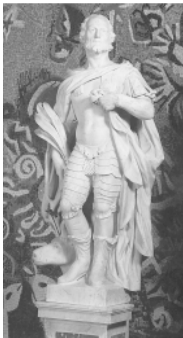
Giuseppe Bernardi, Sv. Eustahije, Dobrota, crkva sv. Eustahija/Stasija

Dobrota, St. Eustachius' Church, main altar