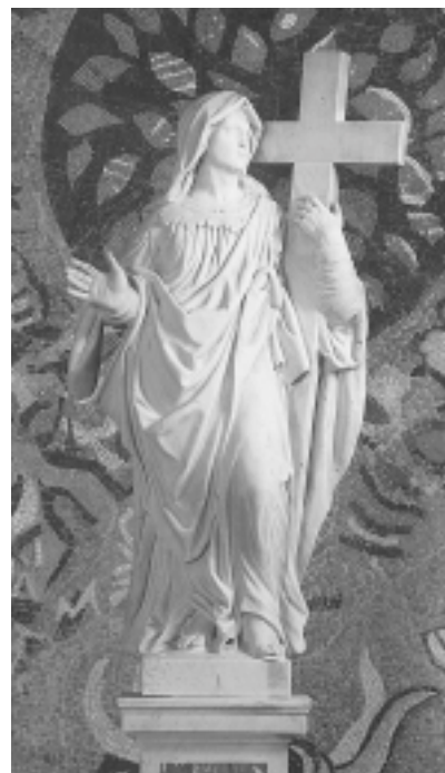
Giuseppe Bernardi, Sv. Jelena, Dobrota, crkva sv. Eustahija/Stasija

Giuseppe Bernardi, St. Eustachius, Dobrota, St. Eustachius' Church