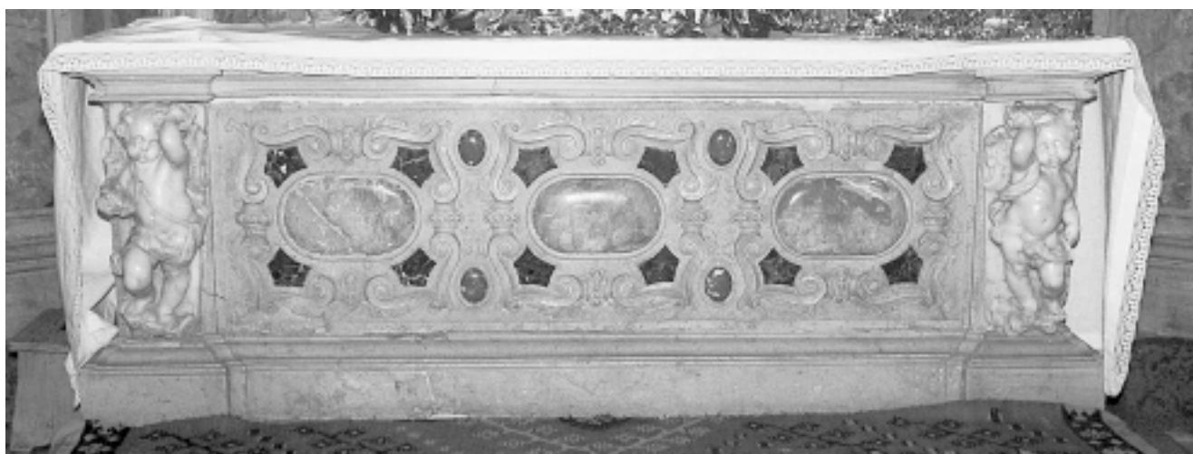
Bol, dominikanska crkva, antependij oltara Gospe od Ružarija

Bol, Dominican church, Lady of the Rosary altar