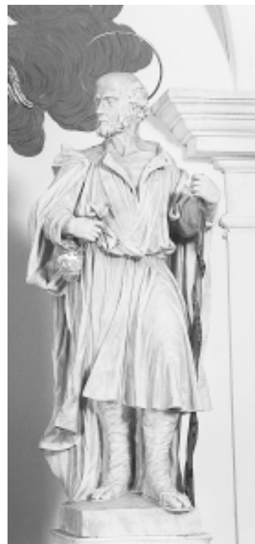
Giuseppe Bernardi, Sv. Josip, Dobrota, crkva sv. Mateja Giuseppe Bernardi, St. Joseph, Dobrota, St. Matthew's Church