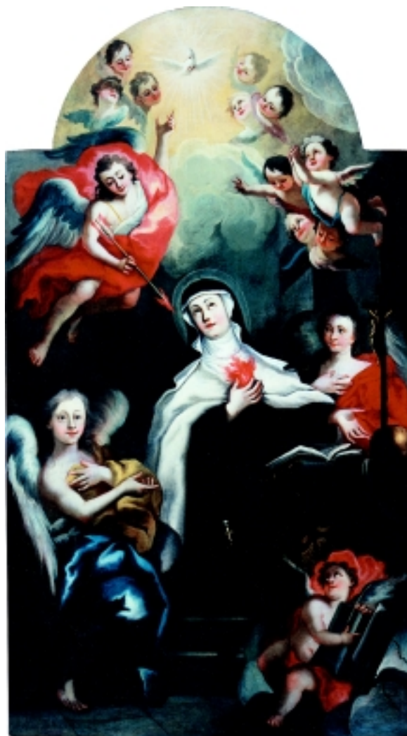
4. Zanos Sv. Tereze Avilske, Osijek, župna crkva Sv. Mihovila u Tvrđi 4. Exultation of St. Theresa of Avil , St. Michael's parish church, Osijek, Tvrđa

odabirom boja nadovezuje se također na prikaz stigmatizacije iz franjevačke crkve u Pečuhu kao i na Porcijunkulski oprost u visočkom samostanu. (sl. 5, 6, 7, 8) Na osječkoj slici postavljena je svetica u samo središte kompozicije. Krupni i sitni anđeli zajedno s krilatim anđeoskim glavicama i golubicom nadahnuća slave Terezinu mističnu ekstazu. Strelica u rukama krupna anđela usmjerena je prema plamtećem srcu, pokazujući kakvu zaštitu možemo tražiti moleći se svetoj karmelićanki. Sam slikani prostor nejasan je i tonski prigušen pa se likovi doimlju kao da su gotovo reljefno istaknuti. Svjetlo i sjena pomno sudjeluju u modelaciji volumena, glatkih i punih na obnaženim djelovima tijela, rastočenih i zaigranih u opisima draperije. Neosporna je sličnost među likovima s te i s ostalih Senserovih slika. U njihovoj realizaciji priklonio se jednakim prototipovima kakve nalazimo na prikazu Majke Božje Pomoćnice (Osijek), prikazu porcijunkulskog oprosta (Visoko), stigmatizacije (Pečuh) ili na slici Bogorodica od ružarija u Velikoj, još jednom do danas nepoznatom djelu istog autora.