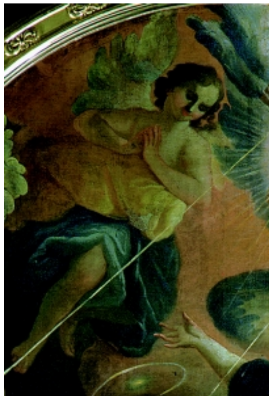
6. Stigmatizacija sv. Franje Asiškog (detalj), Pečuh, župna crkva Sv. Franje

5. Stigmatization of St. Francis of Assisi (detail), St. Francis' parish church, Pécs