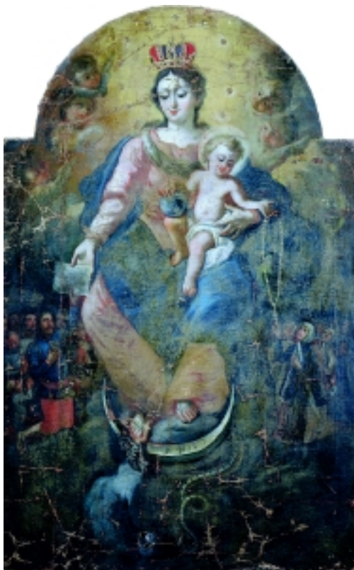
9. Bogorodica od ružarija, Velika, Dijecezanski muzej – odjel Velika (pri župnom uredu)

9. Mother of God of Rosary, Diocesan museum (within the parish office), Velika