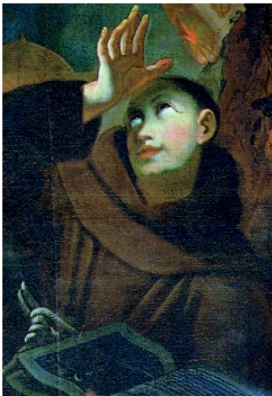
5. Stigmatizacija Sv. Franje Asiškog (detalj), Pečuh, župna crkva Sv. Franje

5. Stigmatization of St. Francis of Assisi (detail), St. Francis' parish church, Pécs