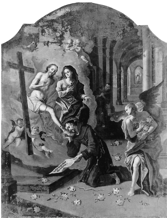
1. Porcijunkulski oprost, Visoko (Bosna i Hercegovina), franjevački samostan

1. The Porziuncola Indulgence, Franciscan monastery, Visoko