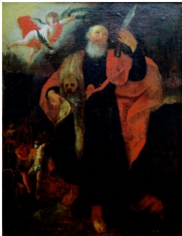
10. Sv. Bartolomej, Feričanci, kapela Sv. Bartolomeja, sada u zbirci Dijecezanskog muzeja Požeške biskupije u osnivanju

9. Mother of God of Rosary, Diocesan museum (within the parish office), Velika