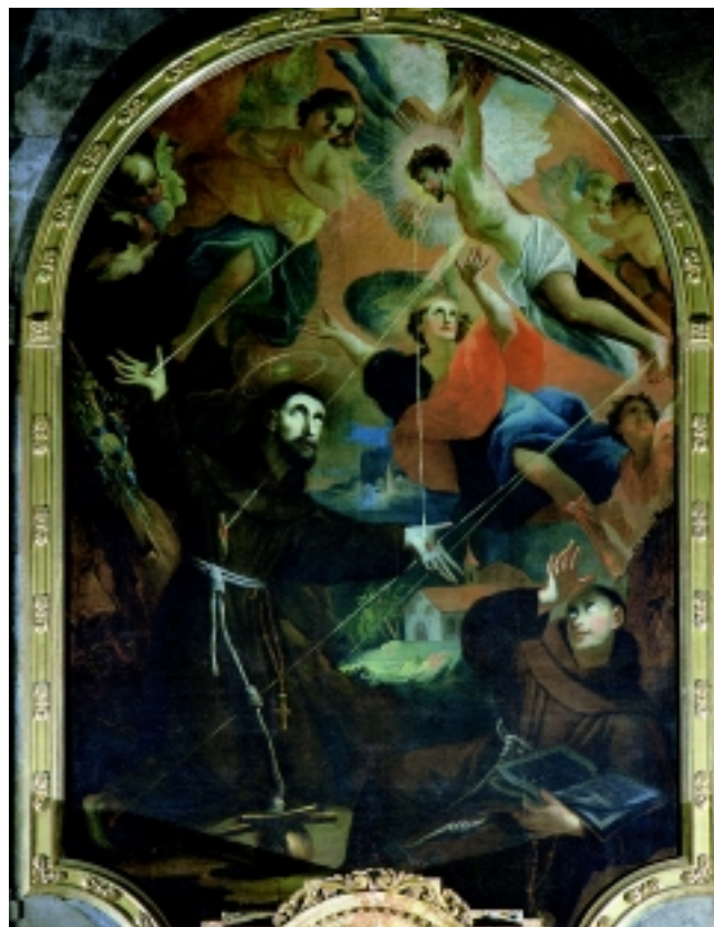
2. Stigmatizacija Sv. Franje Asiškog, Pečuh, župna crkva Sv. Franje

1. The Porziuncola Indulgence, Franciscan monastery, Visoko