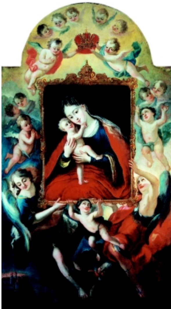
3. Majka Božja Pomoćnica, Osijek, župna crkva Sv. Mihovila u Tvrđi 3. The Merciful Mary , St. Michael's parish church, Osijek, Tvrđa