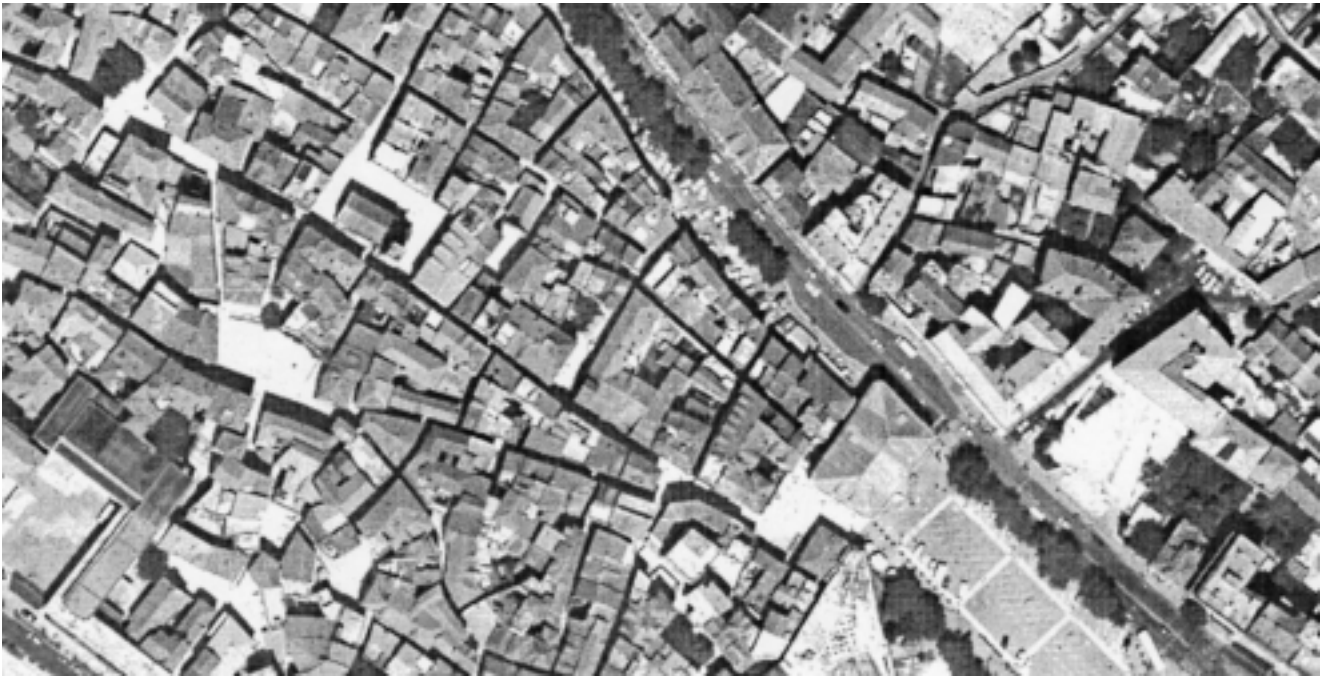
Šibenik, zračna snimka dijela povijesne jezgre, u sredini blok Sv. Spasa – izvorno templarski castrum Šibenik, aerial view of the part of medieval town with the block of the Holy Saviour, originally the seat of Templar Knights

but naselja koje nije biskupsko sjedište. Dio tog naselja bila je i utvrda – kaštel Sv. Mihovila (na položaju današnje tvrđave Sv. Ane) – koja se izričajima onovremenog latiniteta nije mogla imenovati nikako drukčije nego također castrum . Pojam castrum kao oznaku pravnog statusa naselja treba dakle razlikovati od oznake za kaštel, tj. utvrdu u užem smislu.