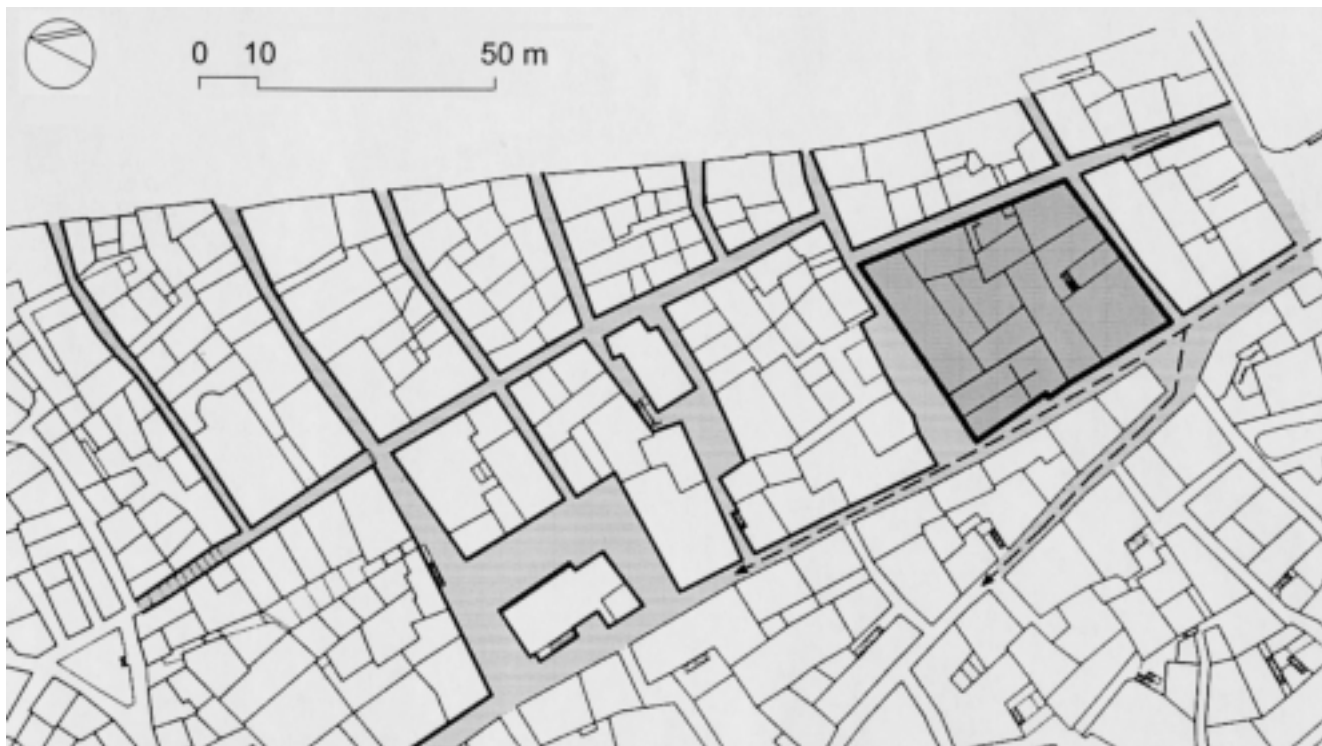
Blok Sv. Spasa u odnosu na urbanističku strukturu i komunikacije na Gorici

Block of the Holy Saviour in relation to the urban structure and communications' scheme of Gorica, a part of medieval town of Šibenik