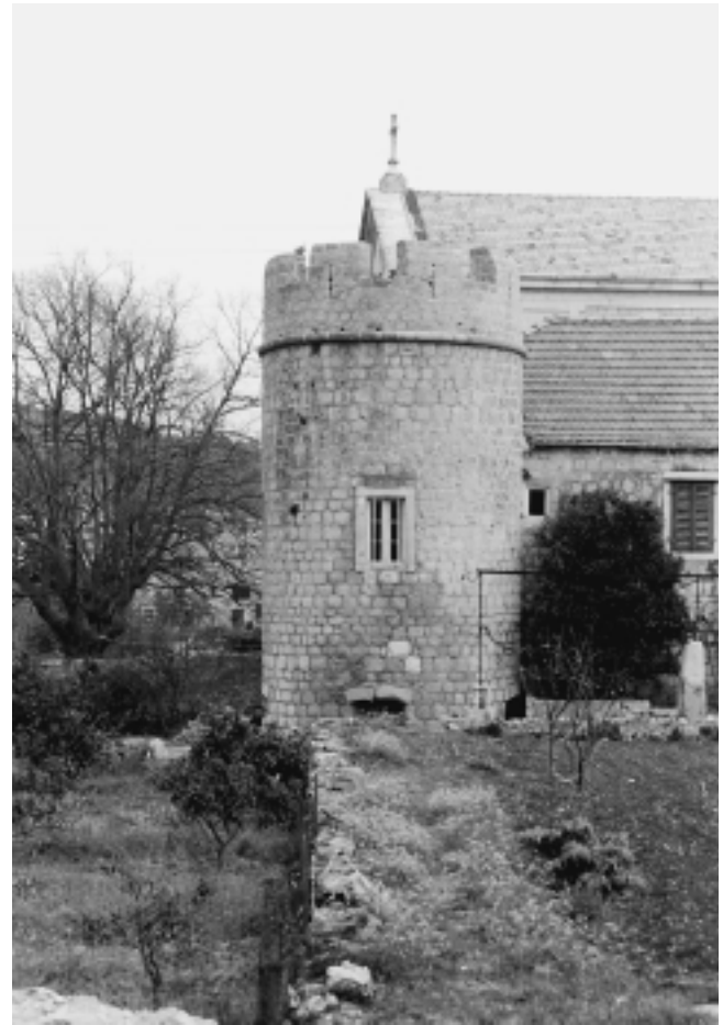
Samostan Sv. Petra Mučenika u Starom Gradu, pogled na jugozapadnu kulu Stari Grad, monastery of St. Peter the Martyr, view of the southwest tower

1481. godine. 22 Zahtjevi za njegovim osnivanjem su stariji, tako da je vikar provincije Dalmacije Petar iz S. Cantiana zatražio i dobio odobrenje za podizanje samostana od vrhovnog glavarara dominikanskog reda Leonarda de Mansuetisa već 1479. godine. 23 Podizanje samostana poglavita je zasluga Germana iz Piacenze, koji je došao u hvarski dominikanski samostan Sv. Marka u pratnji biskupa Nikole de Crucibusa (1463.–1473.). 24 On je već 1481. godine započeo gradnju samostana, tako da se 15. siječnja 1482. godine spominje » već započeti samostan «. 25 Crkva je bila dovršena i posvećena 1488. godine, kada je fra German dao iznad ulaznih vrata uklesati natpis: F. GER. P. DIVO. PETRO MCCCLXXXVIII (FRATER GERMAN PLACENTINUS DIVO PETRO MCCCCLXXXVIII). 26