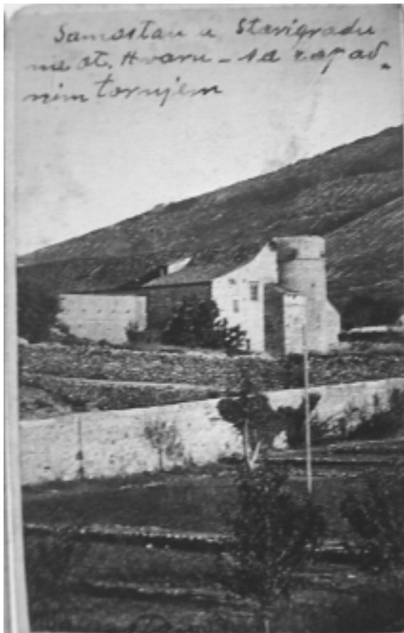
Samostan Sv. Petra Mučenika u Starom Gradu, pogled sa sjeverozapada na sklop samostana prije preuređenja 1893. godine

Stari Grad, monastery of St. Peter the Martyr, view of the southwest tower in the early 20 th century