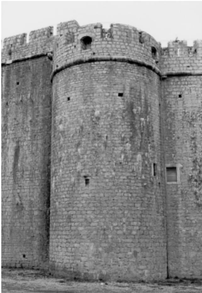
Crkva-tvrđava Sv. Marije u Vrboskoj, pogled na kulu Vrboska, church-fortress of St. Mary, view of the tower