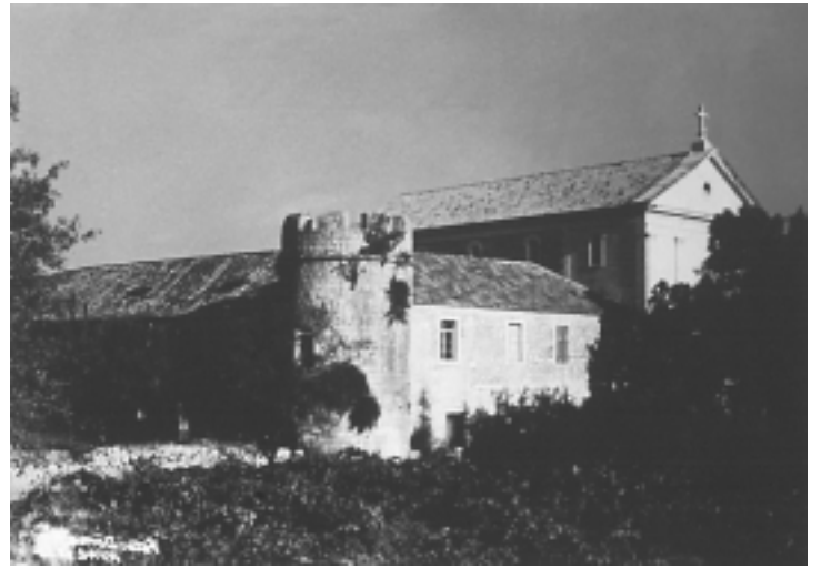
Samostan Sv. Petra Mučenika u Starom Gradu, pogled na jugozapadnu kulu početkom 20. stoljeća

Stari Grad, monastery of St. Peter the Martyr, base of the north belltower facade with visible foundation megaliths