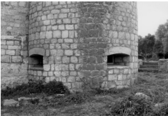
Samostan Sv. Petra Mučenika u Starom Gradu, podnožje jugozapadne kule s topovskim otvorima

Stari Grad, monastery of St. Peter the Martyr, view of the northeast tower