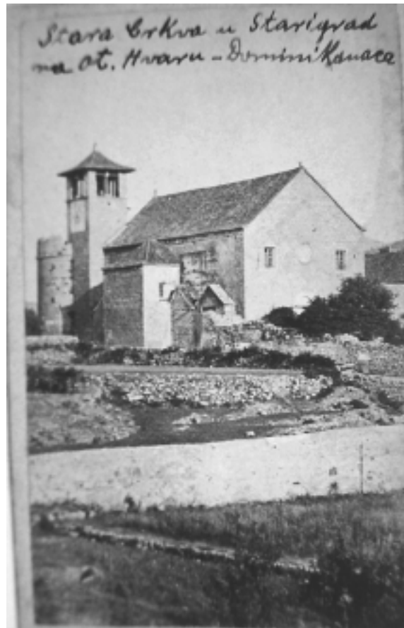
Samostan Sv. Petra Mučenika u Starom Gradu, pogled sa sjeverozapada na samostansku crkvu, zvonik i kulu prije preuređenja 1893. godine

Stari Grad, monastery of St. Peter the Martyr, view from the northwest of the monastery complex before the reconstruction in 1893