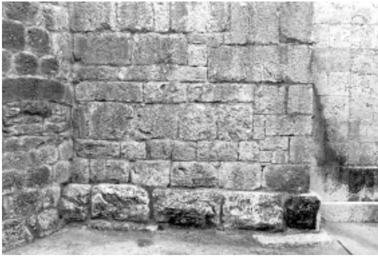
Samostan Sv. Petra Mučenika u Starom Gradu, podnožje sjevernog pročelja zvonika s vidljivim megalitima temelja

Stari Grad, monastery of St. Peter the Martyr, base of the north belltower facade with visible foundation megaliths