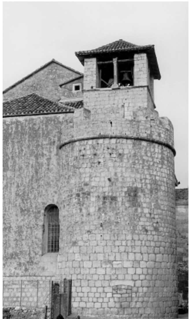
Samostan Sv. Petra Mučenika u Starom Gradu, pogled na sjeveroistočnu kulu, postojeće stanje