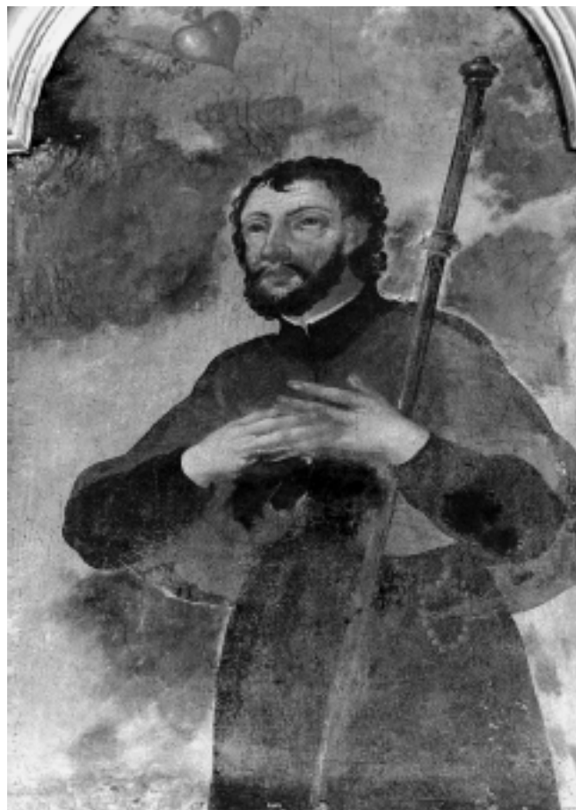
Sv. Franjo Ksaverski, kapela Sv. Fabijana i Sebastijana, Varaždin St. Francis Xavier, Chapel of SS Fabian and Sebastian, Varaždin

presijeca lik u desnom dijelu kompozicije. Slikani je prostor, kao i na oltarnoj pali Sv. Filipa u kapeli Sv. Fabijana i Sebastijana, naglo skraćen, a prostorna dijagonala nelogično se obrušava prema perspektivno umanjenom liku lijevo u pozadini. Fizionomija Sv. Fidelija neznatno je individualizirana. Tipološki je srodna likovima svetaca koji naseljavaju nebeski krajolik u sakristiji varaždinske prvostolnice, prosijedom Sv. Filipu na već spomenutoj oltarnoj pali i Sv. Franji Ksaverskom na prikazu koji resi atiku istoga oltara u kapeli Sv. Fabijana i Sebastijana. S lakoćom se očitavaju otežali kapci naglašenih obrisa, konveksno zaključena čvrsta bradica, vršnim svjetlima istaknute vlasi kose i karakteristična, po sredini razdijeljena duga brada. Grueber ponovno poseže za uobičajenom paletom, a dijelovi draperije ponovo postaju predmetom njegova osjećaja za dekorativno i linearno, pa se, gdje god je to moguće, gužvaju u nečitke labirinte rastočene naglašenim odnosima svijetlih istaka i sivosmeđom bojom zatamnjenih, pravilno omeđenih uleknuća.