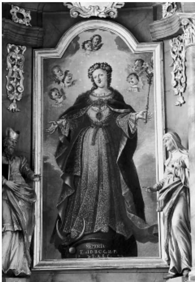
Bezgrješna Bogorodica, kapela Sv. Vida, Varaždin Immaculate Virgin, Chapel of St. Vid, Varaždin