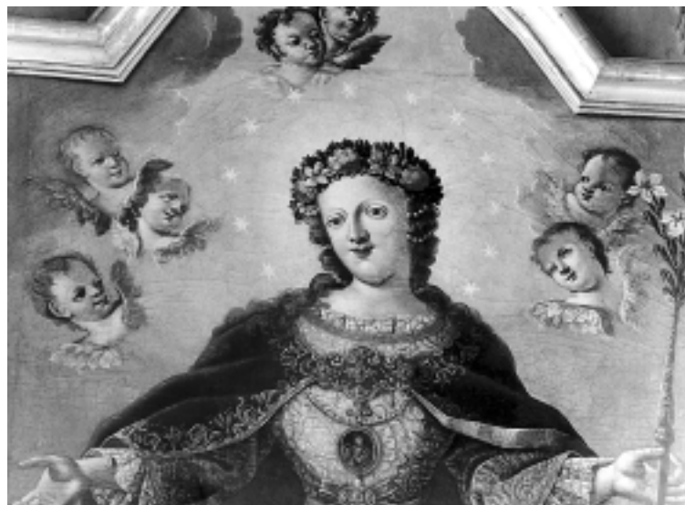
Bezgrješna Bogorodica, detalj, kapela Sv. Vida, Varaždin Immaculate Virgin, detail, Chapel of St. Vid, Varaždin

niz široku haljinu razvedenu plitkim naborima oštih kontura pričvršćuju je u jednoj ravnini, posve približenoj gledatelju. Slikajući Bezgrješnu Bogorodicu za crkvu Sv. Mihovila arkandela u Mihovljanu, Grueber izvodi istovjetnu scenografiju – zemaljsku kuglu presječenu donjim rubom kadra i svjetlom osmišljen prostor stiliziranog nebeskog krajolika koji se otvara iza uspravne Marijine figure. Prikazuje ipak drugi tip Immaculate , Mariju Pobjednicu s malim Isusom koji prislonjen uz majčin lijevi bok dugim krakom križa zadaje zmiji pod njenim nogama smrtonosni udarac.