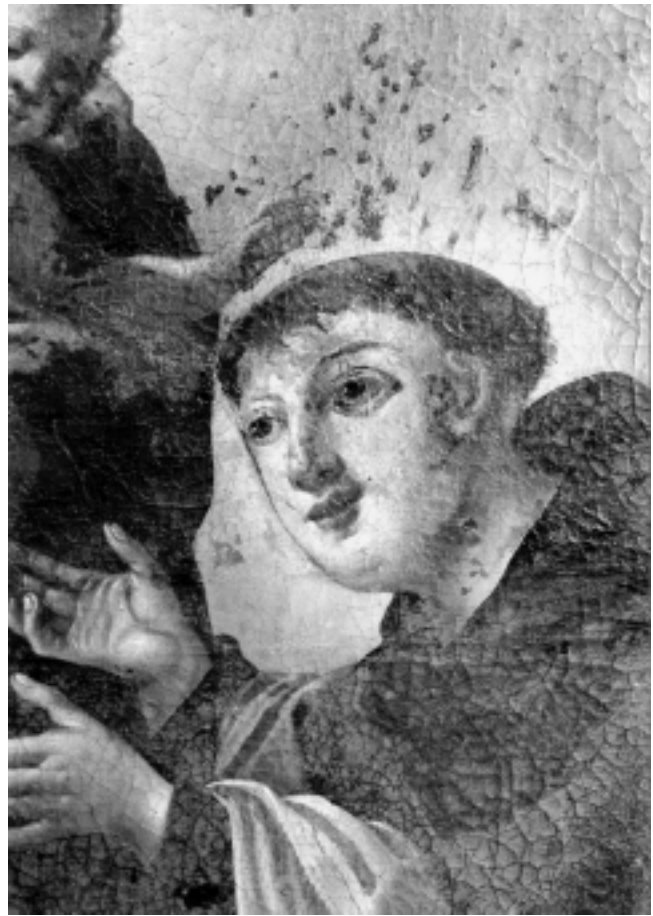
Sv. Antun Padovanski s Bogorodicom i Djetetom, detalj, Dijecezanski muzej, Zagreb St. Anthony of Padua with Virgin and Child, detail, Diocesan Museum, Zagreb