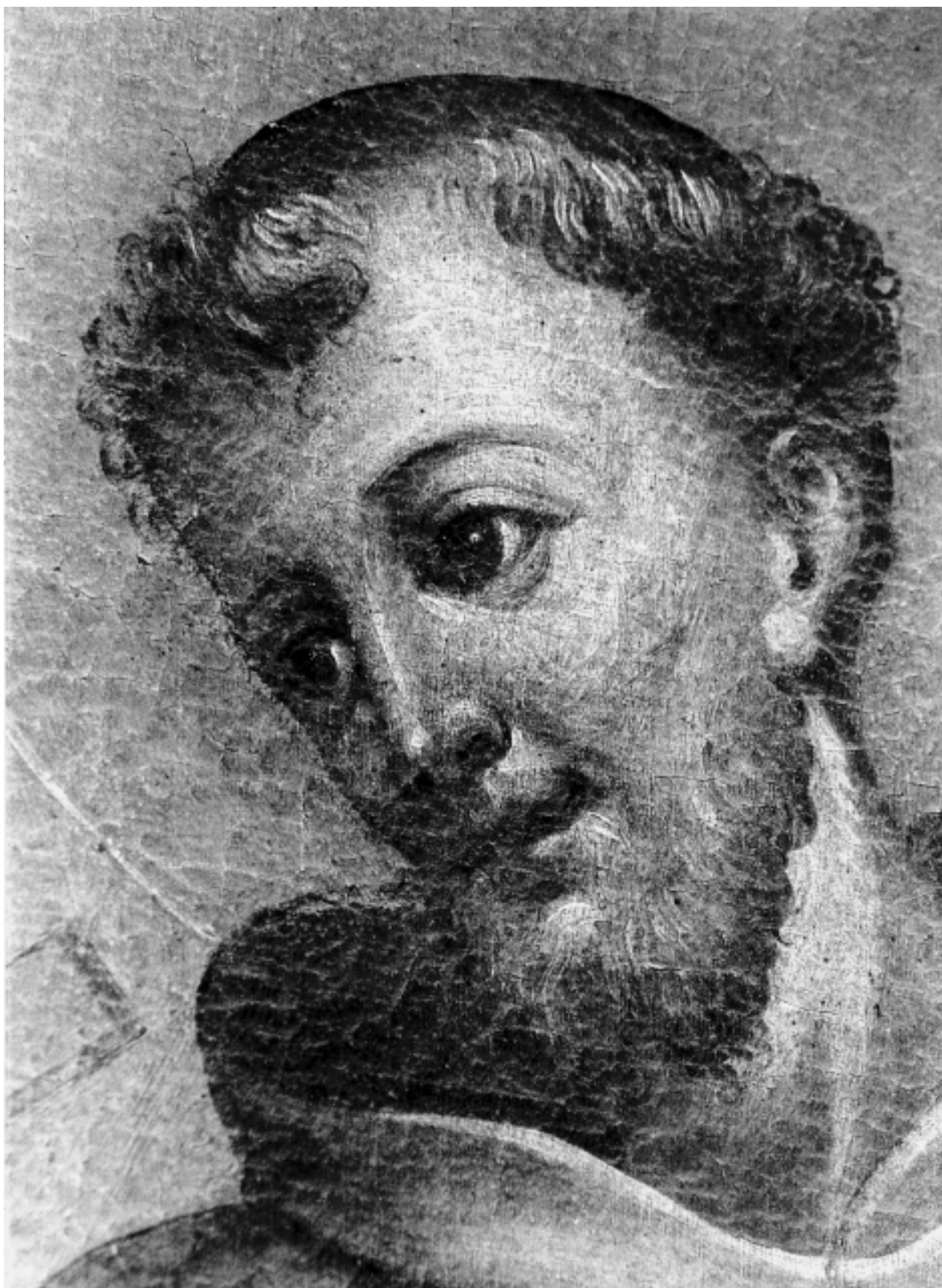
Sv. Franjo Asiški, detalj, Franjevački samostan, Varaždin St. Francis of Assisi, detail, Franciscan Monastery, Varaždin