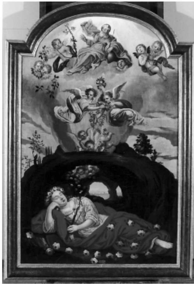
Sv. Rozalija, kapela Sv. Rozalije, Đurđevac St. Rosalia, Chapel of St. Rosalia, Đurđevac