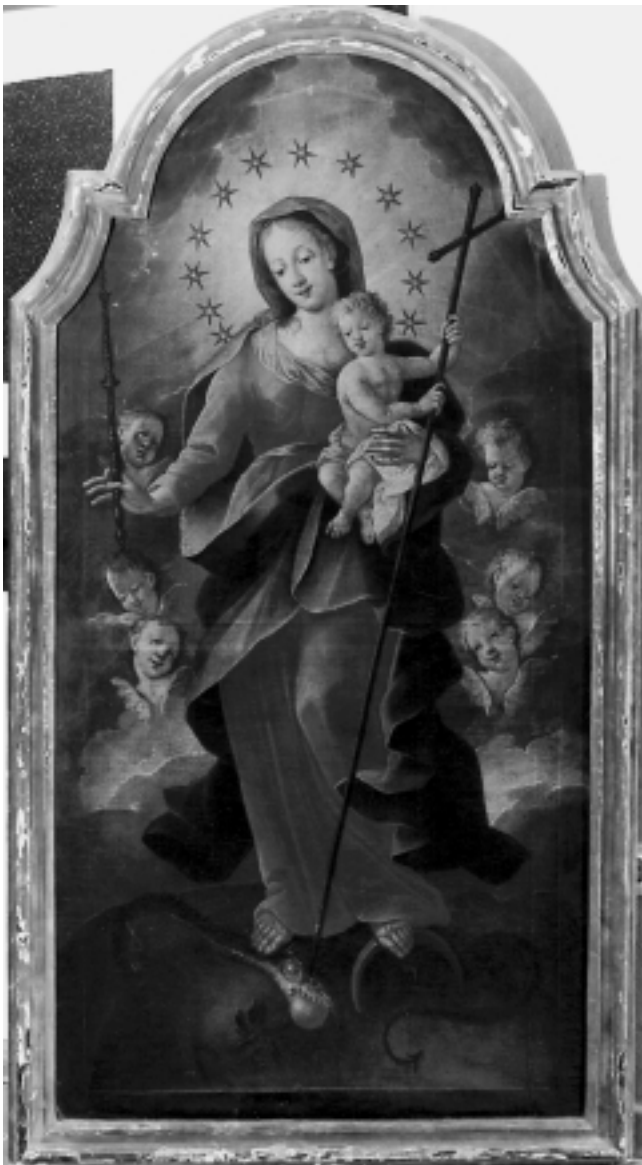
Bezgrješna Bogorodica, Franjevački samostan, Čakovec Immaculate Virgin, Franciscan Monastery, Čakovec