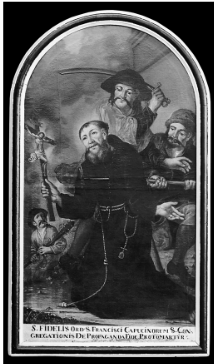
Sv. Fidelije, Kapucinski samostan, Varaždin St. Fidelius, Capuchin Monastery, Varaždin

zoru Marijina uznesenja na svodu sakristije u bivšoj varaždinskoj jezuitskoj crkvi – naglašeni čeonni dio u konturi obraza, široke nosnice, okruglastu bradu i kratki konkavni rez koji je dijeli od podvaljka. Sivkasti veo na Margaretinjoj glavi pokreću obrati nabora stanjenih rubova kao i one na glavama Grueberovih Bogorodica. Skromna vegetacija oko njenih nogu i lišće na slici Sv. Jakova Markijskog raste pod istim podnebljem kao ono s Grueberove freske. Sve navodi na zaključak da autora tih franjevačkih slika treba tražiti u krugu Grueberove radionice koju je zasigurno imao, jer poblizi pogled i na potpisanim freskama u sakristiji otkriva dvije, međusobno vrlo slične ruke. Riječ je svakako o djelima koja pripadaju kasnim dvadesetim ili ranim tridesetim godinama XVIII. stoljeća budući da su po formalnim obilježjima bliža varaždinskim sakristijskim freskama nego kasnije nastalim prikazima Bogorodica.