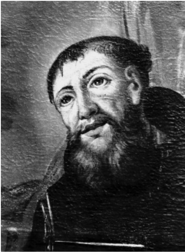
Sv. Fidelije, detalj, Kapucinski samostan, Varaždin St. Fidelius, detail, Capuchin Monastery, Varaždin