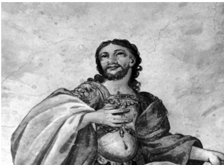
Detalj freske u sakristiji, crkva Uznesenja Marijina, Varaždin Detail of the fresco in the sacristy, Church of the Assumption of Mary, Varaždin