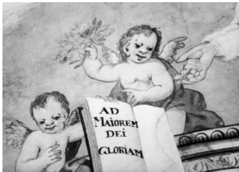
Detalj freske u sakristiji, crkva Uznesenja Marijina, Varaždin Detail of the fresco in the sacristy, Church of the Assumption of Mary, Varaždin