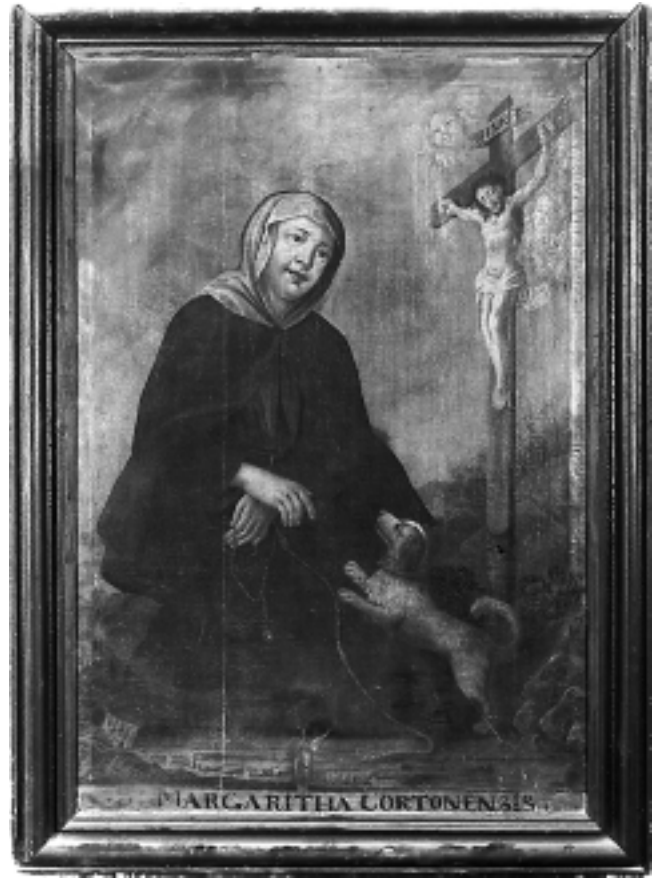
Sv. Margareta Kortonska, Franjevački samostan, Varaždin St. Margaret of Cortona, Franciscan Monastery, Varaždin

jom svetačkih likova, neuobičajenim odnosom likova i prostora, promijenjenim tretmanom draperije, pa čak i morfologije. Slika Sv. Franje Asiškog u varaždinskom Franjevačkom samostanu monokromna je poput grizaja u nastojanju da se predoči utisak koji bi na gledatelja imala izvorna mramorna skulptura oca franjevačkog reda. Lik Sv. Franje prikazan je frontalno i pokrenut diskretnim kontrapostom. U desnoj, do visine struka podignutoj podlaktici drži raspelo, a lijevom je o vanjski dio bedra oslonio otvorenu knjigu koju pridržava živahni anđeo priljubljen uz njegovu nogu. Opis slikanog prostora posve je izostavljen, a tamnosiva sjena koja prati jasno iscrtanu konturu osmišljava ga kao nišu, doduše pravokutnu, u koju je smještena skulptura. Naglašavanje rubova vertikalnih nabora, labirint u kojem se uvija tanka tkani- na nabačena oko poluobnaženog tijela anđela, mekana modelacija lica, sjetni prijazni izraz, neobično izduženo uho zamršeno u gornjem dijelu, nadilaze razlikovne elemente koji bi tu sliku udaljili iz Grueberova vidokruga. Trokutasta forma svečeve glave zasigurno polazi od grafičkog predloška što potvrđuje još jedna slika rađena nešto kasnije u XVIII. stoljeću na istu temu, slika Sv. Franje Asiškog na oltaru franjevačke kapele na Kaptolu u Zagrebu, te još kasnije, potkraj XIX. stoljeća nastala replika u zbirci Dijecezanskog muzeja u Zagrebu.