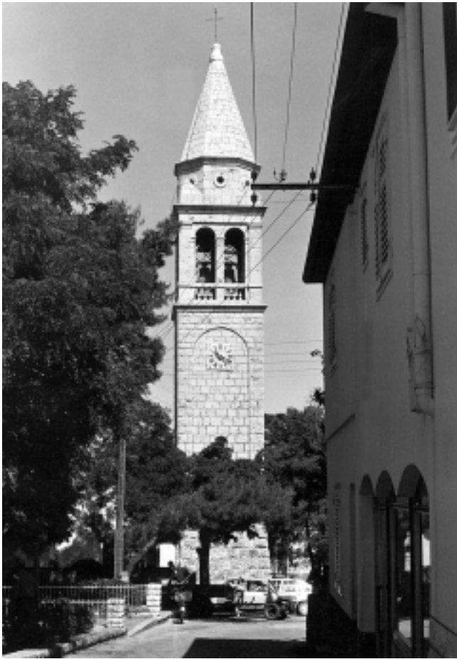
Kali, zvonik crkve Sv. Lovre (1892), pogled s jugoistoka Kali, Saint Lawrence, Church Tower (1892), south-east view

drugoj polovici XVIII. stoljeća. 8 Za sve to vrijeme zvona su bila smještena u preslici nad zapadnim pročeljem. Taj tradicionalni oblik izgradnje kamenog okvira za zvona korišten je u Dalmaciji od srednjega vijeka. Na otocima i u kopnenom zaleđu taj će se način kao jeftinija inačica susretati i u drugoj polovici XIX. stoljeća.