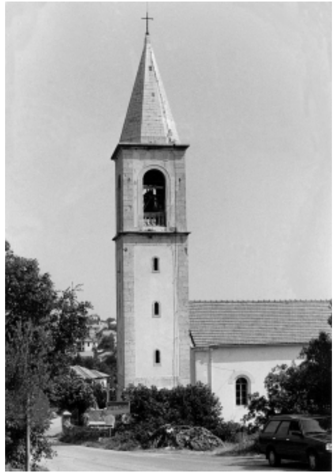
Sutomišćica, zvonik crkve Sv. Eufemije (1836) Sutomišćica, Saint Euphemia, Church Tower (1836)

Iako podignut u prvoj polovici XIX. st., zvonik je građen poput baroknih, a uzor mu je bio onaj kukljički iz 1741. godine.