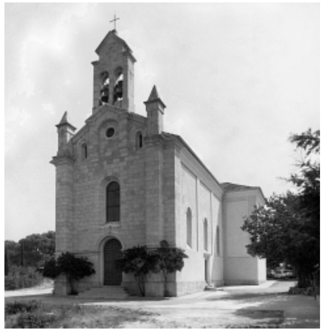
Lukoran, crkva Sv. Lovre (1877), pogled sa sjeverozapada Lukoran, Church of Saint Lawrence (1877), north-west view

U Lukoranu nalaze se ostaci dviju crkava koje su bile obnavljane u vrijeme baroka. To je bivša župna crkva Sv. Lovre koja se nalazi na groblju i crkva Sv. Trojstva, u kojoj se također