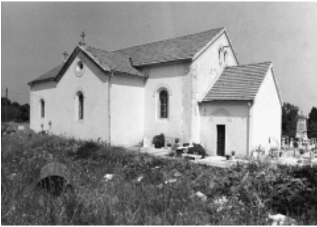
Sutomišćica, crkva Sv. Eufemije (1889), pogled s juga Sutomišćica, Church of Saint Euphemia (1889), south view

na nekom drugome mjestu. Početkom XX. st. tako se postupilo i u Preku.