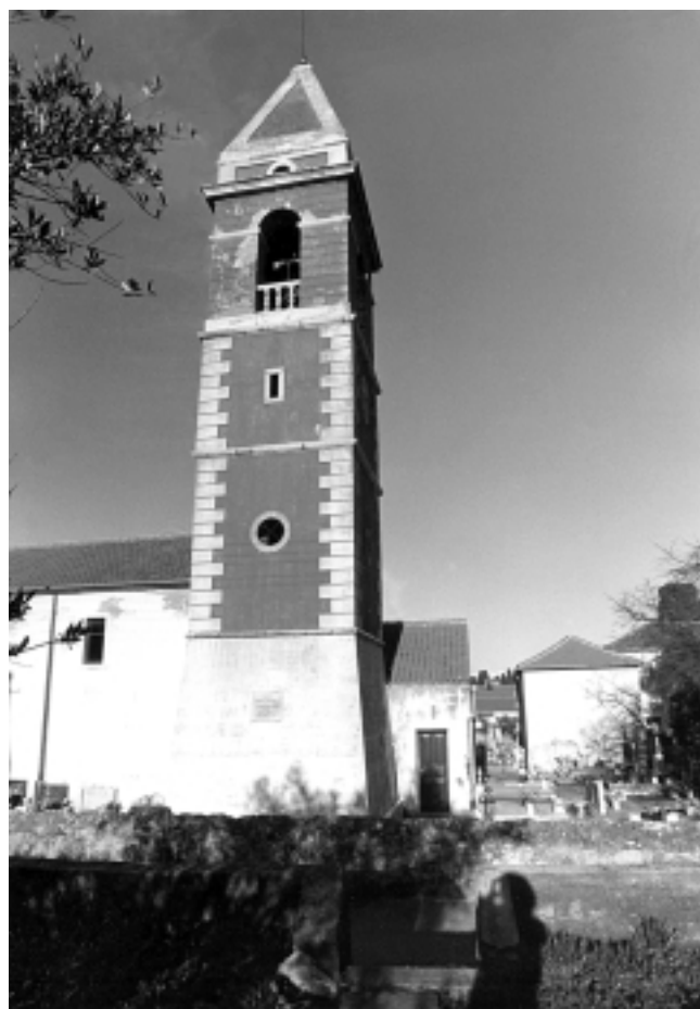
Preko, zvonik crkve Gospe od Ružarija (1844), pogled sa zapada Preko, Bell Tower of Our Lady of the Rosary (1844), west view

Za pohranu triju zvona mještani su o svom trošku podigli samostojeći zvonik 1844. godine, koji se spaja s južnim licem crkve. Njegov oblik, raščlanjenost i otvori mješavina su