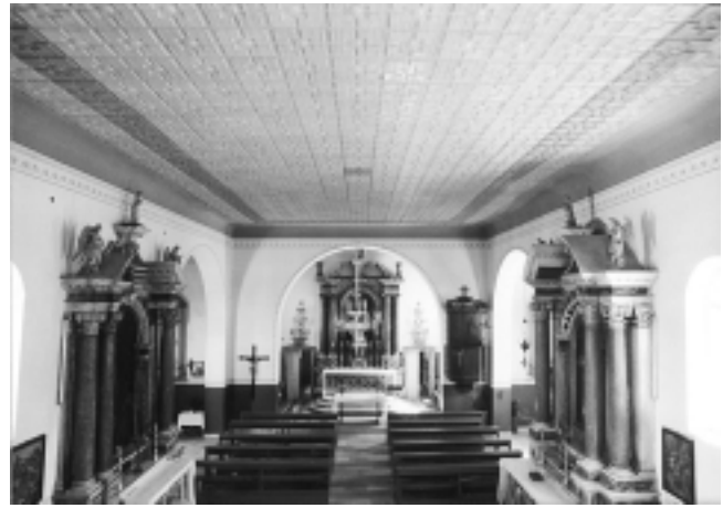
Sutomišćica, crkva Sv. Eufemije, unutrašnjost Sutomišćica, Church of Saint Euphemia, Interior

Uz crkvu Sv. Lovre u Kalima zvonik je podignut uz sjeverno lice sakristije. Svojom vitkom linijom pridonio je vizuri crkve.