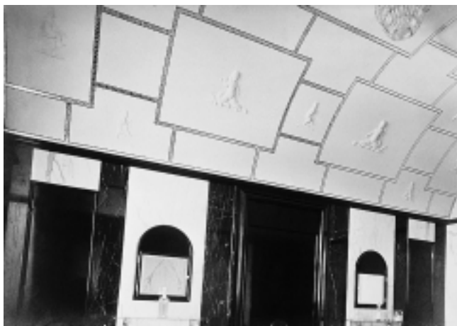
Kuća Deutch-Maceljski, 1922–1924. god. Trg hrvatskih velikana 2, Zagreb. Kupaonica Deutsch-Maceljski building, 1922–1924. Trg hrvatskih velikana 2, Zagreb. Bathroom