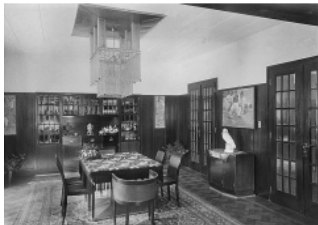
Vila S. Benedik, 1909–1910. god. Tuškanac 14, Zagreb. Blagovaonica Villa S. Benedik, 1909–1910. Tuškanac 14, Zagreb. Dining room

Po uzoru na principe oblikovanja Wiener Werkstätte, sav je Baranyaijev dekorativni instrumentarij potpuno u skladu s funkcionalnošću, u kombinacijama različitih materijala i tehnika njihove obrade komponiranih metodom kontrasta geometrijskog linearizma i figurativne stilizacije, tvoreći raskošni ansambl boja i oblika savršene elegancije i harmoničnosti prostora. Primjerice, jednostavne klasicističke profilacije zidnih oplata od drva i kasetirane štuko dekoracije stropova čine apstraktni raster, protuteža kojem su figuralne kompozicije na vitrajima i florealni motivi kao akcenti. Podjednaka pažnja posvećena je i oblikovanju parka, s neizbježnim omiljenim Baranyaijevim motivom pergole, fontanama, bazenom i teniskim terenima, koji se poput mekanog omotača obavija oko vile. 10