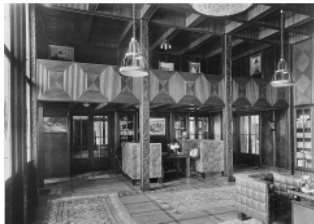
Vila Ilić, 1918–1920. god. Paunovac 7, Zagreb. Hall s galerijom Villa Ilić. Paunovac 7, Zagreb. Hall with gallery

To neveliko zdanje odlikuje vrlo jednostavna organizacija unutrašnjeg prostora, s atelijerom smještenim na gornjoj etaži. Zatvoreni volumen dobio je kontrapunkt u raskošno ornamentiranom pročelju. Polukružno izvijeni ukras oko ulaza nadvišen je motivom lovora sa slikarskim simbolom, iznad kojeg se prema arhitektovoj zamisli nalazila Tišovljeva figuralna kompozicija s likom Madone identična onoj iz »Zlatne dvorane« u Opatičkoj 10, dok su na plohama plitkih uklada bile predviđene dekorativne slike simbolističkog ugođaja. 2