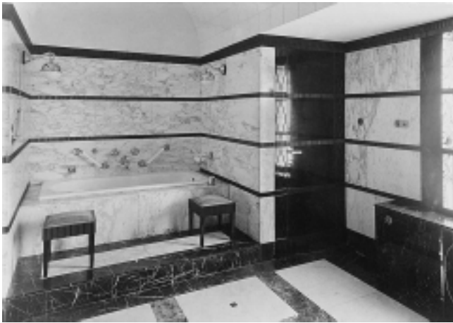
Vila Ilić, 1918–1920. god. Paunovac 7, Zagreb. Kupaonica Vila Ilić, 1918–1920. Paunovac 7, Zagreb. Bathroom