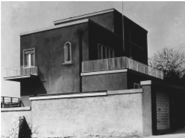
Vila Baranyai, 1930–1931. god. Jabukovac 37, Zagreb Villa Baranyai, 1930–1931. Jabukovac 37, Zagreb