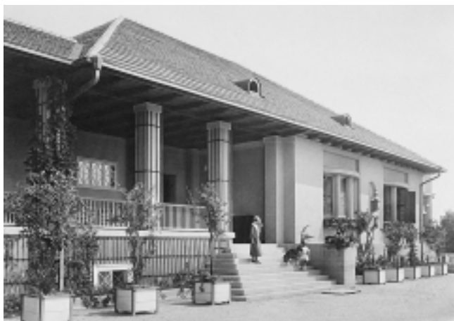
Vila Ilić, 1918–1920. Paunovac 7, Zagreb. Pročelje Villa Ilić, 1918–1920. Paunovac 7, Zagreb. Facade