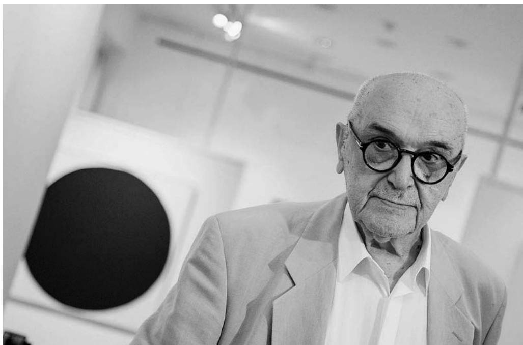
↑ Mladen Galić, Foto G. Vranić © Moderna galerija, Zagreb

ta crta bila izazovno prekinuta. Prostor 2 (također 2018.) se sastoji na prvi pogled samo od velike nepravilne elipsaste crne mrlje po sredini i smeđe-okeraštih traka boje uz gornji rub. Ipak, uz donji rub crnoga središta pomalja se ljubičastosmeđa treperava linija, kao signal da slika nije puka demonstracija načela nego i vizualni izazov za sustavno promatranje i smirenu kontemplaciju. x