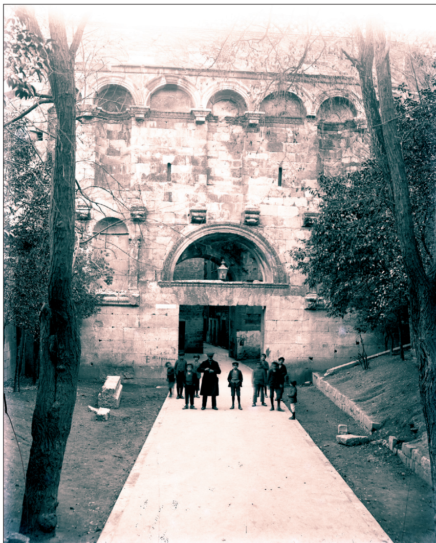
Slika 5. Zlatna vrata oko 1900.

Bulat je ukazivao na štetne posljedice „vinske klauzule“ i tražio od središnje vlade da pomogne Dalmaciji. 76 U Carevinskom vijeću kritizirao je vladu zbog, za Dalmaciju, izuzetno nepovoljnog trgovačkog ugovora, ukazujući na njegove pogubne posljedice na gospodarski položaj Dalmacije, odnosno na njeno pomorstvo, ribarstvo i vinogradarstvo. 77 U Zadru je inicirao osnivanje i izradio zaključke posebnog sedmočlanog odbora koji je obrazložio veliku gospodarsku