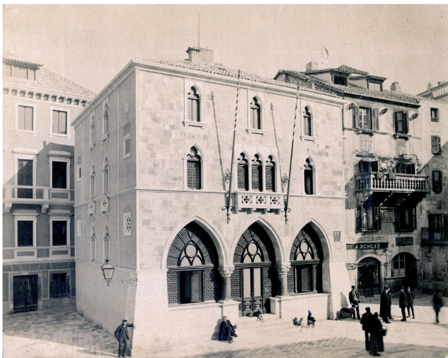
Slika 3. Općinski dom oko 1895.

kako svaki put raste broj narodnih birača“ što smatra rezultatom višegodišnjeg političkog djelovanja. Za predsjednika Sabora izabran je „Juraj (Gjorgje) knez Vojnović-Užički“, a Bulat je imenovan njegovim zamjenikom. Ovim carskim imenovanjem prvi put je jedan član narodne hrvatske stranke postao potpredsjednikom Dalmatinskog sabora. Na konstituirajućoj sjednici, održanoj 20. srpnja, Bulat je izabran i u financijski odbor. 60 Na jednoj od prvih sjednica Bulat je, zajedno s nekoliko drugih zastupnika, postavio „vladi N.V. upit o društvu „associazione dalmatica“ koje je, unatoč odluci Namjesništva o raspuštanju, i dalje kamen smutnje te pitaju: Koje mjere misli poduzeti c.k. vlada da se stavi na čisto pravo stanje društva „Associazione Dalmatica“ i da po zakonu postupa glede zlorababa, što su se sbile u dotičnoj upravi.“ 61